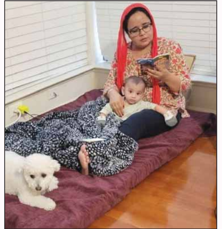
ਨੂੰਹ ਰਾਣੀ ਤਾਂ ਡਿਨਰ ਬਣਾਵੇ ਸੱਸ ਕਰਦੀ ਏ ਪਾਠ ਦਾਦੀ ਦੀ ਗੋਦੀ ਵਿਚ ਬੈਠਾ ਪੋਤਾ ਬਣ ਕੇ ਰਾਠ!