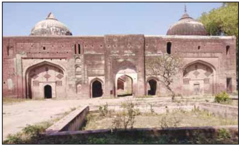
ਭਗਤ ਸਧਨੇ ਦੀ ਮਸੀਤ