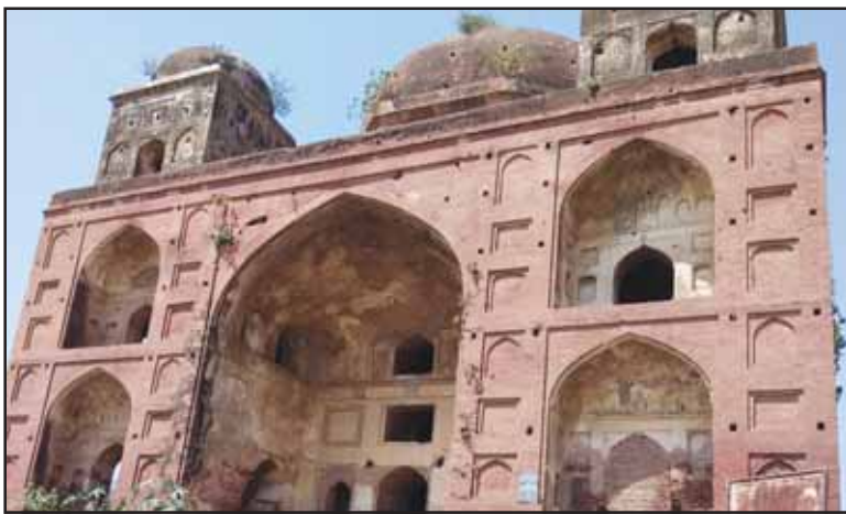
ਸ਼ਾਗਿਰਦ ਦਾ ਮਕਬਰਾ

ਤੇਰੇ ਅੰਦਰ ਆਏ ਹੰਕਾਰ ਦਾ ਸਿਰ ਕਲਮ ਕਰਨਾ ਹੈ। ਇਸ ਤਰ੍ਹਾਂ ਉਸਤਾਦ ਨੇ ਆਪਣੇ ਸ਼ਾਗਿਰਦ