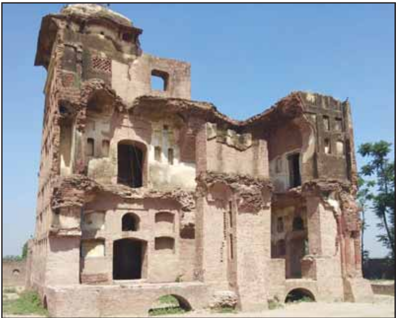
ਦੀਵਾਨ ਟੋਡਰ ਮਲ ਦੀ ਜਹਾਜ਼ ਹਵੇਲੀ

ਬਣੀਆਂ ਜ਼ਿਆਦਾਤਰ ਸਮਾਰਕਾਂ ਖੰਡਰਾਂ ਦਾ ਰੂਪ ਧਾਰਨ ਕਰ ਚੁੱਕੀਆਂ ਹਨ। ਭਾਰਤ ਅਤੇ ਪੰਜਾਬ