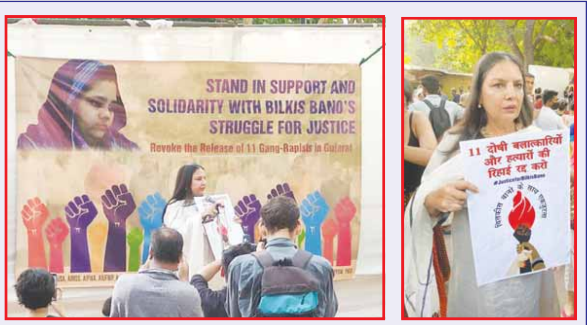
ਨਵੀਂ ਦਿੱਲੀ ਵਿੱਚ ਰੋਸ ਵਿਖਾਵੇ ਵਿੱਚ ਸ਼ਿਰਕਤ ਕਰ ਰਹੀ ਅਦਾਕਾਰਾ ਸ਼ਬਾਨਾ ਆਜ਼ਮੀ ਦੀਆਂ ਦੋ ਤਸਵੀਰਾਂ।

ਬਲਕੀਸ ਬਾਨੋ ਤੇ ਉਸ ਦਾ ਪਰਿਵਾਰ ਖੇਤਰ ਵਿੱਚ ਜਾ ਲੁਕੇ ਸਨ। ਦੰਗਈ ਭੀੜ 3 ਮਾਰਚ 2002 ਨੂੰ ਉੱਥੇ ਪਹੁੰਚੀ ਅਤੇ ਉਨ੍ਹਾਂ ਨੇ ਉਸ ਦੇ ਪਰਿਵਾਰ ਦੇ 7 ਜੀਆਂ ਦੀ ਹੱਤਿਆ ਕੀਤੀ ਅਤੇ ਗਰਭਵਤੀ ਬਲਕੀਸ ਬਾਨੋ ਨਾਲ ਜਬਰ-ਜਨਾਹ ਕੀਤਾ। ਸੁਪਰੀਮ ਕੋਰਟ ਨੇ ਕੇਸ ਸੀ.ਬੀ.ਆਈ. ਨੂੰ ਸੌਂਪਿਆ ਜਿਸ ਨੇ 2004 ਵਿੱਚ ਅਪਰਾਧੀਆਂ ਨੂੰ ਗ੍ਰਿਫਤਾਰ ਕੀਤਾ। ਮੁਕੱਦਮਾ ਮਹਾਰਾਸ਼ਟਰ ਵਿੱਚ ਸੀ.ਬੀ.ਆਈ. ਦੀ ਅਦਾਲਤ ਵਿੱਚ ਪੇਸ਼ ਹੋਇਆ ਅਤੇ ਅਦਾਲਤ ਨੇ 11 ਅਪਰਾਧੀਆਂ ਨੂੰ ਉਮਰ ਕੈਦ ਦੀ ਸਜ਼ਾ ਸੁਣਾਈ। ਇਸ ਸਾਲ 75ਵੇਂ ਆਜ਼ਾਦੀ ਦਿਵਸ 'ਤੇ ਇਨ੍ਹਾਂ ਅਪਰਾਧੀਆਂ ਨੂੰ ਗੋਧਰਾ ਜੇਲ੍ਹ ਤੋਂ ਰਿਹਾ ਕਰ ਦਿੱਤਾ ਗਿਆ। ਗੁਜਰਾਤ ਸਰਕਾਰ