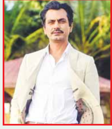
ਆਪਣੀ ਨਵੀਂ ਫਿਲਮ 'ਹੱਡੀ' ਵਿੱਚ ਨਵਾਜ਼ੁਦੀਨ ਸਿੱਦੀਕੀ ਅਤੇ (ਸੱਜੇ) ਕੋਟ-ਪੈਂਟ ਵਿੱਚ ਸਜਿਆ ਨਵਾਜ਼ੁਦੀਨ ਸਿੱਦੀਕੀ।