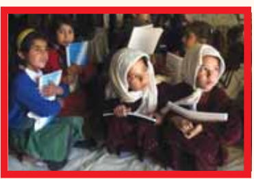
ਇਕ ਸਕੂਲ ਵਿਚ ਪੜ੍ਹ ਰਹੀਆਂ ਅਫਗਾਨ ਕੁੜੀਆਂ।

ਇਹ ਸੰਗ੍ਰਹਿ ਉਤਪੀੜਤ ਸਮਾਜਾਂ ਦੀਆਂ ਲੇਖਿਕਾਵਾਂ ਨੂੰ ਮੁੱਖ ਬਖ਼ਸ਼ਣ ਦਾ ਕੰਮ ਕਰ ਰਹੀ ਸੰਸਥਾ 'ਅਨਟੋਲਡ' ਦੇ ਉੱਦਮ ਸਦਕਾ ਵਜੂਦ ਵਿਚ ਆਇਆ ਹੈ। ਇਸ ਨੂੰ ਪੜ੍ਹ ਕੇ ਇਹ ਹਕੀਕਤ ਸਮਝ ਆ ਜਾਂਦੀ ਹੈ ਕਿ ਤਾਲਿਬਾਨ ਹਕੂਮਤ ਵੱਲੋਂ ਲਾਈਆਂ ਬੰਦਸ਼ਾਂ ਤੇ ਸਖ਼ਤਾਈ ਦੀ ਅਵੱਗਿਆ ਕਰ ਕੇ ਜੇਕਰ ਕਾਬੁਲ, ਕੁੰਦੂਜ਼ ਤੇ ਕੰਧਾਰ ਵਿਚ ਔਰਤਾਂ ਵੱਲੋਂ ਆਪਣੇ ਘਰਾਂ ਦੇ ਅੰਦਰ ਔਰਤਾਂ ਲਈ ਉੱਚ ਸਿੱਖਿਆ ਦੇ ਸਕੂਲ ਚਲਾਏ ਜਾ ਰਹੇ ਹਨ ਤਾਂ ਉਹ ਕਿਸ ਜੁਝਾਰੂ ਬਿਰਤੀ ਦਾ ਨਤੀਜਾ ਹਨ। ਇਸ ਕਿਸਮ ਦੀ ਦਲੇਰੀ ਤੇ ਆਦਰਸ਼ਵਾਦ, ਸੱਚਮੁੱਚ ਹੀ, ਸਲਾਮ ਦੇ ਹੱਕਦਾਰ ਹਨ।