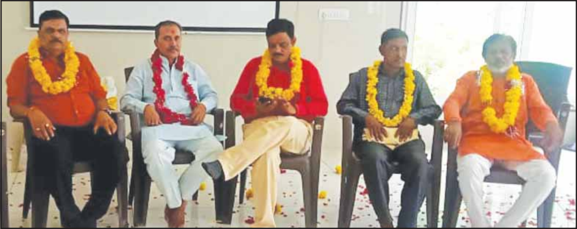
ਬਿਲਕੀਸ ਬਾਨੋ ਬਲਾਤਕਾਰ ਕੇਸ ਦੇ ਮੁਜਰਮਾਂ ਨੂੰ ਰਿਹਾਅ ਹੋਣ ਤੋਂ ਬਾਅਦ ਹਾਰ ਪਹਿਨਾਏ ਗਏ।