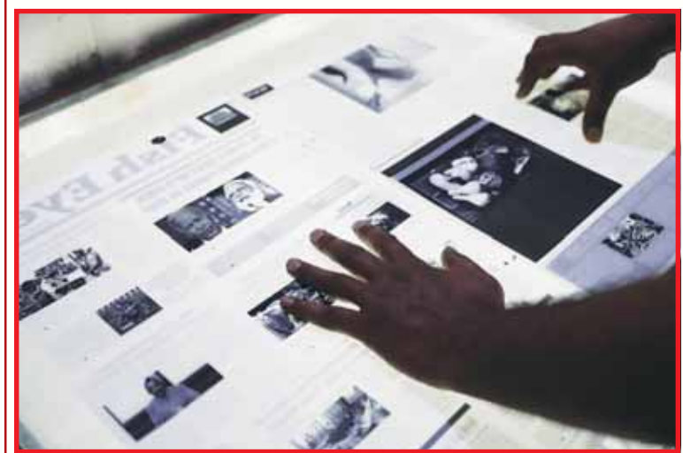
ਸ਼੍ਰੀਨਗਰ ਦੇ ਬਾਹਰੀ ਇਲਾਕੇ ਰੰਗਰੇਟ ਦੀ ਇਕ ਪ੍ਰੈੱਸ ਵਿਚ ਇਕ ਅਖਬਾਰ ਦੀ ਛਪਾਈ ਦੀ ਤਸਵੀਰ। ਇਸ ਇਲਾਕੇ ਦੇ ਅਖਬਾਰ ਵੱਡੇ ਪੈਮਾਨੇ 'ਤੇ ਸਿਰਫ ਲੈਫਟੀਨੈਂਟ ਗਵਰਨਰ ਮਨੋਜ ਸਿਨਹਾ ਦੇ ਪ੍ਰੈੱਸ ਬਿਆਨ ਅਤੇ ਭਾਜਪਾ ਦੇ ਬੁਲਾਰਿਆਂ ਦੇ ਬਿਆਨ ਕਵਰ ਕਰ ਰਹੇ ਹਨ। ਕਈ ਪੱਤਰਕਾਰਾਂ ਨੇ ਸ਼ਿਕਾਇਤ ਕੀਤੀ ਕਿ ਉਨ੍ਹਾਂ ਨੂੰ ਨੈਸ਼ਨਲ ਕਾਨਫਰੰਸ ਜਾਂ ਪੀ.ਡੀ.ਪੀ. ਦੇ ਬਿਆਨਾਂ ਅਤੇ ਖੇਤਰ 'ਚ ਹੋਈਆਂ ਹਿੰਸਕ ਝੜਪਾਂ ਬਾਰੇ ਰਿਪੋਰਟ ਕਰਨ ਦੀ ਇਜਾਜ਼ਤ ਨਹੀਂ ਹੈ।

ਅੱਗੇ ਕਿਹਾ ਹੈ ਕਿ ਜੰਮੂ ਕਸ਼ਮੀਰ ਦੇ ਕੇਂਦਰ ਸ਼ਾਸਤ ਪ੍ਰਦੇਸ਼ ਵਿਚ ਕੋਈ ਵੀ ਵਿਅਕਤੀ ਘਰ ਵਿਚ ਨਜ਼ਰਬੰਦ ਨਹੀਂ।" 4 ਫਰਵਰੀ ਨੂੰ ਹੁਰੀਅਤ ਨੇਤਾ ਮੀਰਵਾਇਜ਼ ਉਮਰ ਫਾਰੂਕ ਨੇ ਰੈਡੀ ਦੇ ਬਿਆਨ