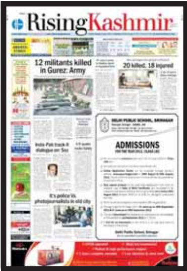
'ਦਿ ਰਾਈਜ਼ਿੰਗ ਕਸ਼ਮੀਰ' ਅਖਬਾਰ ਦਾ ਪਹਿਲਾ ਪੰਨਾ।