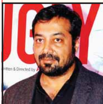
ਨਿਰਦੇਸ਼ਕ ਅਨੁਰਾਗ ਕਸ਼ਯਪ

ਚੁਟਕੀ ਲੈ ਰਹੇ ਕਿ ਲੋਕਾਂ ਨੇ ਅਨੁਰਾਗ ਦੀ ਇਹ ਗੱਲ ਮੰਨ ਲਈ ਅਤੇ ਸਿਨੇਮਾ ਘਰਾਂ ਅੰਦਰ ਫਿਲਮ ਦੇਖਣ ਹੀ ਨਹੀਂ ਗਏ।