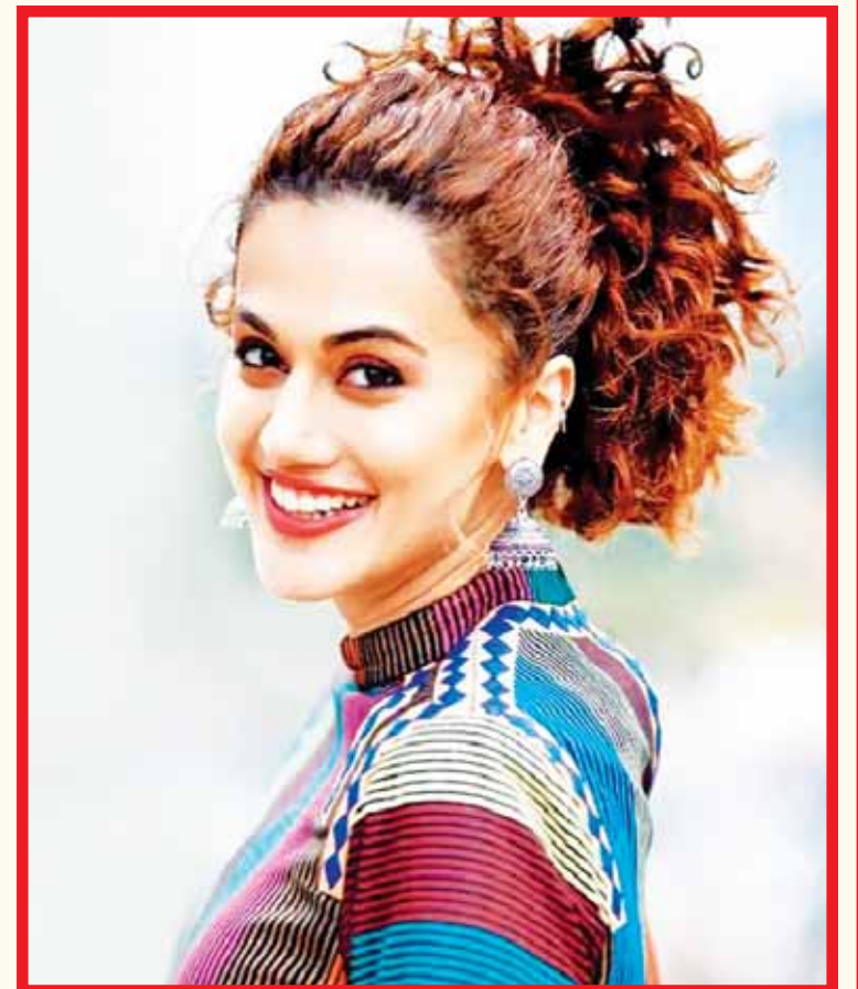
ਅਦਾਕਾਰਾ ਤਾਪਸੀ ਪੰਨੂ