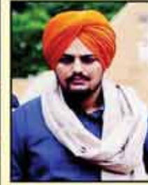
Sidhu Moose Wala