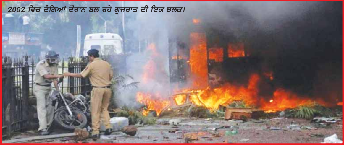
2002 ਵਿਚ ਦੰਗਿਆਂ ਦੌਰਾਨ ਬਲ ਰਹੇ ਗੁਜਰਾਤ ਦੀ ਇਕ ਤਸਵੀਰ।

ਫਿਰਕੂ ਤਣਾਅ ਸਮੇਂ ਪੁਲਿਸ ਦੀ ਭੂਮਿਕਾ ਜਾਂ ਨਿਰਪੱਖਤਾ ਨੂੰ ਲੈ ਕੇ ਭਾਰਤੀ ਸਮਾਜ ਦੀ ਸੋਚ ਵੰਡੀ ਹੋਈ ਹੈ। ਸਮਾਜ ਦੇ ਅਲੱਗ-ਅਲੱਗ ਵਰਗ ਪੁਲਿਸ ਦੀ ਨਿਰਪੱਖ ਭੂਮਿਕਾ ਦੀ ਵਿਆਖਿਆ ਵੀ ਆਪੋ-ਆਪਣੇ ਢੰਗ ਨਾਲ ਕਰਦੇ ਹਨ। ਮੇਰੇ ਅਧਿਐਨ ਵਿਚ ਮੁੱਖ ਰੂਪ ਵਿਚ ਤਿੰਨ ਵਰਗਾਂ ਦੀ ਰਾਇ ਜਾਨਣ ਦੀ ਕੋਸ਼ਿਸ਼ ਕੀਤੀ ਗਈ ਹੈ। ਇਹ ਸਨ: ਪੁਲਿਸ ਕਰਮਚਾਰੀ, ਬਹੁਗਿਣਤੀ ਫਿਰਕਾ ਅਤੇ ਘੱਟ ਗਿਣਤੀ ਫਿਰਕਾ। ਹੈਰਾਨੀ ਦੀ ਗੱਲ ਹੈ ਕਿ 'ਅਲੱਗ-ਅਲੱਗ ਤਿੰਨਾਂ ਵਰਗਾਂ ਦੇ ਮੈਂਬਰਾਂ ਦੀ ਰਾਇ ਲਗਭਗ ਇਕੋ ਜਿਹੀ ਸੀ; ਭਾਵ, ਇਕ ਵਰਗ ਦੇ ਲੋਕ