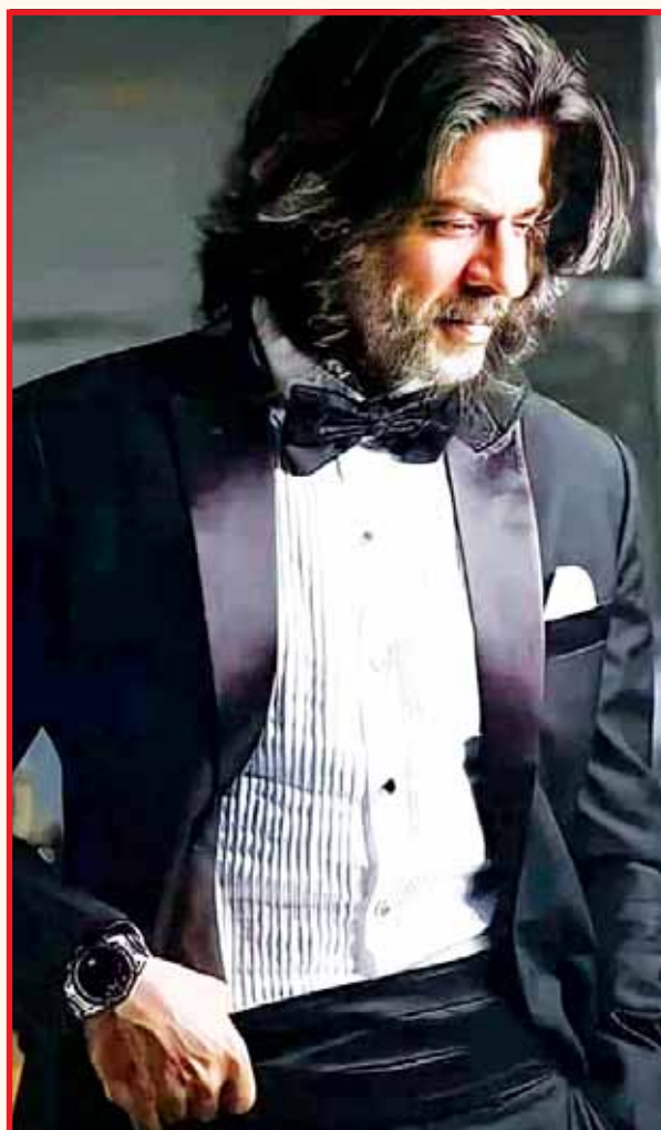
ਅੱਜ ਦਾ ਸ਼ਾਹਰੁਖ ਖਾਨ, (ਉਪਰ ਸੱਜੇ) ਟੈਲੀਵਿਜ਼ਨ ਲੜੀਵਾਰ 'ਫੌਜੀ' ਦੇ ਟ੍ਰਿਸ਼ ਵਿਚ ਅਤੇ ਕਰੀਅਰ ਵਿਚ ਚੜ੍ਹਤ ਵੇਲੇ।

2 ਨਵੰਬਰ 1965 ਨੂੰ ਜਨਮੇ ਸ਼ਾਹਰੁਖ ਖਾਨ ਨੇ ਆਪਣੇ ਕਰੀਅਰ ਦੀ ਸ਼ੁਰੂਆਤ ਟੈਲੀਵਿਜ਼ਨ ਤੋਂ ਕੀਤੀ ਸੀ। ਇਹ 1980ਵਿਆਂ ਦੀਆਂ ਗੱਲਾਂ ਹਨ। ਫੌਜੀ ਜੀਵਨ ਬਾਰੇ ਲੜੀਵਾਰ 'ਫੌਜੀ' ਨਾਲ ਉਸ ਦੀ ਅਦਾਕਾਰੀ ਦੀ ਚਰਚਾ ਆਰੰਭ ਹੋਈ। ਉਸ ਦੀ ਪਹਿਲੀ ਫਿਲਮ 'ਦੀਵਾਨਾ' ਸੀ ਜੋ 1992 ਵਿਚ ਰਿਲੀਜ਼ ਹੋਈ ਸੀ। ਸ਼ੁਰੂਆਤੀ ਦੌਰ ਵਿਚ ਉਸ ਨੇ 'ਬਾਜ਼ੀਗਰ' (1993), 'ਡਰ' (1993) ਅਤੇ 'ਅੰਜਾਮ'