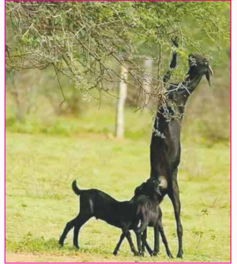
ਇਨਸਾਨ ਜਾਂ ਹੈਵਾਨ ਹੋਵੇ, ਮਾਂ ਤਾਂ ਆਖਰ ਮਾਂ ਹੁੰਦੀ ਹੈ। ਲੱਖ ਵਾਰੀ ਪੈਟੋਂ ਭੁੱਖੀ ਹੋਵੇ, ਬੱਚਿਆਂ ਨੂੰ ਤਾਂ ਹਾਂ ਹੁੰਦੀ ਹੈ।