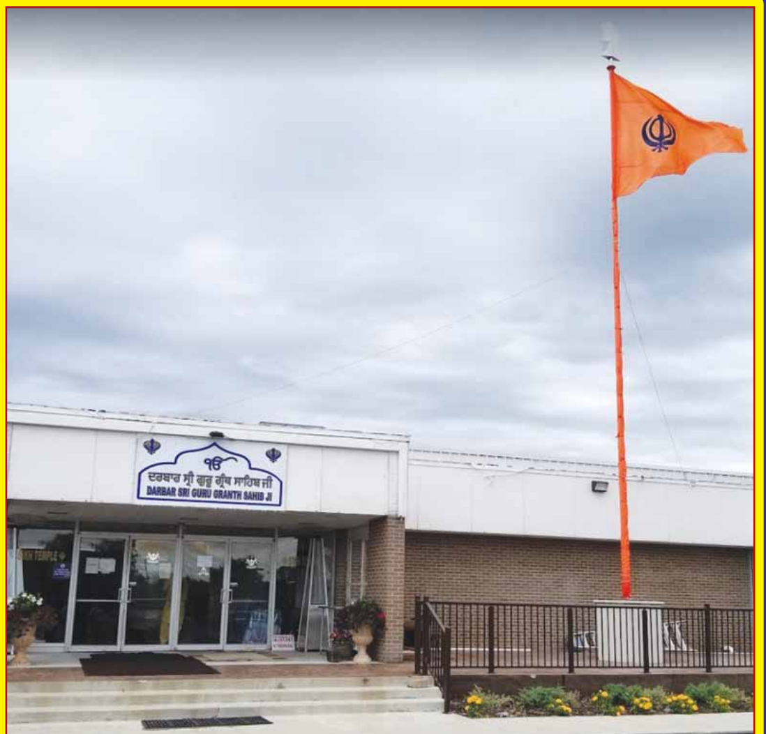
ਸਾਰਾ ਦਿਨ ਅਤੁੱਟ ਲੰਗਰ ਵਰਤੇਗਾ

ਐਤਵਾਰ 3 ਅਪਰੈਲ 2022 ਨੂੰ ਦੁਪਹਿਰ 11 ਤੋਂ 1 ਵਜੇ ਤੱਕ ਕੀਰਤਨ 1 ਤੋਂ 3 ਵਜੇ ਦੌਰਾਨ ਇਕ ਘੰਟੇ ਲਈ ਗਵਰਨਰ ਗੁਰਦੁਆਰਾ ਸਾਹਿਬ ਵਿਖੇ ਹਾਜ਼ਰੀ ਲੁਆਉਣਗੇ