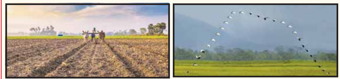
ਹੁਣ ਅਜਿਹੇ ਦ੍ਰਿਸ਼ ਦੁਰਲੱਭ ਹੋ ਗਏ ਹਨ, (ਖੱਬੇ) ਖੇਤਾਂ ਵਿਚ ਹਲ ਵਾਹ ਰਿਹਾ ਕਿਸਾਨ ਅਤੇ (ਸੱਜੇ) ਕੁੰਜਾਂ ਦੀ ਡਾਰ।