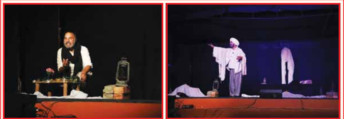
ਨਾਟਕ 'ਧਨੁ ਲੇਖਾਰੀ ਨਾਨਕਾ' ਦੇ ਦੋ ਵੱਖ-ਵੱਖ ਦ੍ਰਿਸ਼।

ਖੈਰ! ਆਪਣੇ ਸਵਾਲ ਜੇ ਮੈਂ ਹਾਲ ਦੀ ਘੜੀ ਪਾਸੇ ਕਰ ਦਿਆਂ ਤਾਂ ਠੀਕ ਰਹੇਗਾ, ਕਿਉਂਕਿ ਨਾਟਕ ਦੇਖਣ ਮਗਰੋਂ ਮਹਿਸੂਸ ਕੀਤਾ ਕਿ ਨਾਟਕਕਾਰ ਨੇ ਤਾਂ ਸਵਾਲਾਂ ਦਾ ਅਜਿਹਾ ਮੀਂਹ ਵਰ੍ਹਾਇਆ ਕਿ ਦੇਖਣ ਵਾਲੇ ਦੀਆਂ ਸੋਚਾਂ ਸਿੱਜੀਆਂ ਜਾਂਦੀਆਂ ਹਨ ਅਤੇ ਜਵਾਬਾਂ ਵਾਲਾ ਬੂਰ ਪੈਂਦਾ ਦੇਖਣ ਲਈ ਉਹ ਬਹੁਤ ਆਸਵੰਦ ਪ੍ਰਤੀਤ ਹੁੰਦਾ ਹੈ। ਇਨ੍ਹਾਂ ਸਵਾਲਾਂ 'ਚ ਹਰ ਤਰ੍ਹਾਂ ਦੇ ਸਵਾਲ ਸ਼ਾਮਲ ਹਨ। ਉਹ ਸਵਾਲ ਜਿਹੜੇ ਸਾਨੂੰ ਆਪਣੇ ਆਪ ਕੋਲੋਂ ਪੁੱਛਣੇ ਚਾਹੀਦੇ ਹਨ; ਉਹ ਸਵਾਲ ਜਿਹੜੇ ਹਰ ਸਾਧਾਰਨ ਇਨਸਾਨ ਦੇ ਦਿਮਾਗ 'ਚੋਂ ਉੱਠਦੇ ਹਨ ਪਰ ਉਹ ਉਨ੍ਹਾਂ ਸਵਾਲਾਂ ਨੂੰ ਪੁੱਛਣ