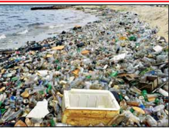
ਸਮੁੰਦਰ ਵਿਚ ਸੁੱਟੇ ਪਲਾਸਟਿਕ ਦੀ ਝਲਕ।

ਦੁਨੀਆ ਤੇ ਸਰਦਾਰੀ ਕਾਰਪੋਰੇਸ਼ਨਾਂ ਦੀ ਹੈ ਅਤੇ ਸਰਕਾਰਾਂ ਸਮਝੋ ਉਹਨਾਂ ਦੇ ਅਧੀਨ ਹਨ। ਸਾਰੀ ਦੁਨੀਆ ਵਿਚ ਜੰਗਲਾਂ ਦਾ ਵਢਾਗਾ ਬੁਰੀ ਤਰ੍ਹਾਂ ਹੋ ਰਿਹਾ ਹੈ। ਧਰਤੀ ਦੇ ਜੀਅ ਜੰਤ ਦੀ ਆਕਸੀਜਨ ਦੀ ਪੂਰਤੀ ਦਰੱਖਤ ਕਰਦੇ ਹਨ। ਜੰਗਲ ਧਰਤੀ ਦੇ ਫੇਫੜੇ ਹਨ। ਪਿਛਲੇ ਸਾਲ ਐਮਾਜ਼ੋਨ ਦੇ ਜੰਗਲ ਨੂੰ ਜਾਣ ਬੁੱਝ ਕੇ ਅੱਗ ਲਗਾਈ ਗਈ ਅਤੇ ਫਿਰ ਜੰਗਲ ਨੂੰ ਬੁਰੀ ਤਰ੍ਹਾਂ ਮੱਚਣ ਦਿੱਤਾ ਗਿਆ ਤਾਂ ਕਿ ਸਾਫ ਹੋਈ ਧਰਤੀ ਤੇ ਫਾਰਮਿੰਗ ਕੀਤੀ ਜਾ ਸਕੇ। ਜਦ ਐਮਾਜ਼ੋਨ ਦੇ ਆਦੀਵਾਸੀਆਂ ਨੇ ਉਹ ਲੋਕ ਫੜ ਲਏ ਜਿਹਨਾਂ ਨੇ ਅੱਗ ਲਾਈ ਸੀ ਤਾਂ ਸਰਕਾਰ ਨੇ ਅੱਗ ਲਾਉਣ ਵਾਲਿਆਂ ਨੂੰ ਤਾਂ ਕੁਝ ਨਹੀਂ ਕਿਹਾ ਪਰ ਉਹਨਾਂ ਆਦੀਵਾਸੀਆਂ ਨੂੰ ਜੇਲ੍ਹਾਂ ਵਿਚ ਸੁੱਟ ਦਿੱਤਾ ਤਾਂ ਕਿ ਹੋਰ ਵੀ ਕੋਈ ਸਰਕਾਰ ਨੂੰ ਚੈਲਿੰਜ ਕਰਨ ਦੀ ਹਿਮਾਕਤ ਨਾ ਕਰੇ। ਇਹ ਹੈ ਇਨਸਾਫ ਜਿਹੜਾ ਧਰਤੀ ਪੁੱਤਰਾਂ ਨੂੰ ਮਿਲਦਾ ਹੈ। ਹਰ ਸਾਲ ਵਾਤਾਵਰਨ ਬਚਾਉਣ ਵਾਲੇ ਲੋਕਾਂ ਦੇ ਕਤਲ ਹੋ ਰਹੇ ਹਨ। ਬਰਟਾ ਕੈਂਸਰਸ ਵਰਗੀ ਵਾਤਾਵਰਨ ਕਾਰਕੁਨ ਨੂੰ ਉਸ ਦੇ ਘਰੇ ਜਾ ਕੇ ਗੋਲੀਆਂ ਨਾਲ ਭੁੰਨ ਦਿੱਤਾ ਜਾਂਦਾ ਹੈ ਅਤੇ ਕਾਤਲਾਂ ਨੂੰ ਸ਼ੱਕ ਦੇ ਆਧਾਰ ਤੇ ਛੱਡ ਦਿੱਤਾ ਜਾਂਦਾ ਹੈ। ਸਾਰੀ ਦੁਨੀਆ ਵਿਚ ਹੀ ਜਲ ਜੰਗਲ ਬਚਾਉਣ ਵਾਲੇ ਲੋਕਾਂ ਨੂੰ ਅਤਿਵਾਦੀ ਗਰਦਾਨ ਕੇ ਗੋਲੀਆਂ ਨਾਲ ਭੁੰਨ ਦਿੱਤਾ ਜਾਂਦਾ ਹੈ ਜਾਂ ਜੇਲ੍ਹਾਂ ਵਿਚ ਸੁੱਟ ਦਿੱਤਾ ਜਾਂਦਾ ਹੈ।