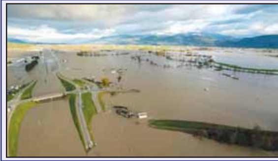
ਚਲੀ ਗਈ ਹੈ ਅਤੇ ਹਜ਼ਾਰਾਂ ਪਸ਼ੂ ਮੁਸੀਬਤ ਵਿਚ ਫਸੇ ਹੋਏ ਹਨ।