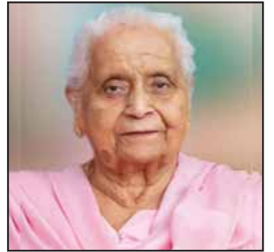
352-7222 'ਤੇ ਸੰਪਰਕ ਕੀਤਾ ਜਾ ਸਕਦਾ ਹੈ।