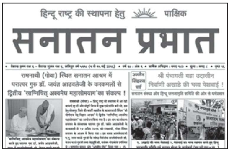
ਸਨਾਤਨ ਸੰਸਥਾ ਦੇ ਪਰਚੇ ਦਾ 'ਸਨਾਤਨ ਪ੍ਰਭਾਤ' ਦਾ ਮੁਖੜਾ।

ਅਠਾਵਲੇ ਦੀ ਇਹ ਸੰਸਥਾ ਤੇ ਹੋਰ ਸਬੰਧਤ ਸੰਸਥਾਵਾਂ ਆਪਣੇ ਆਪ ਨੂੰ ਅਧਿਆਤਮਕ ਸਿੱਖਿਆ ਦੇ ਵਿਲੱਖਣ ਕੇਂਦਰ ਸਿੱਧ ਕਰਨ ਲਈ ਪੂਰੀ ਟਿੱਲ ਲਾ ਰਹੇ ਹਨ। ਅਠਾਵਲੇ ਦੇ ਚੇਲੇ, ਸਾਧ ਅਤੇ ਸਾਧਵੀਆਂ ਸਵੇਰੇ 6 ਵਜੇ 2 ਘੰਟੇ ਦੀ ਭਗਤੀ ਅਤੇ ਪ੍ਰਾਰਥਨਾ ਪਿੱਛੋਂ ਨਾਸ਼ਤੇ ਨਾਲ ਦਿਨ ਸ਼ੁਰੂ ਕਰਦੇ ਹਨ। ਫਿਰ 'ਸਨਾਤਨ ਪ੍ਰਭਾਤ' ਅਖਬਾਰ ਜ਼ਰੀਏ ਅਠਾਵਲੇ ਦੇ ਵਿਚਾਰਾਂ ਰਾਹੀਂ ਆਪਸੀ ਸੰਚਾਰ ਕਰਦੇ ਹਨ, ਕਿਉਂਕਿ ਬਿਮਾਰ ਹੋਣ ਕਾਰਨ ਅਠਾਵਲੇ ਲੋਕਾਂ ਨੂੰ ਬਹੁਤ ਘੱਟ