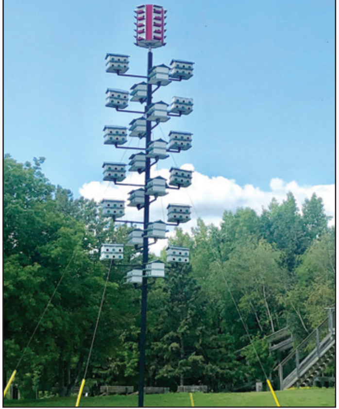
ਤੀਲਾ ਤੀਲਾ ਹੋਣ ਆਲੁਣੇ, ਜਦ ਝੱਖੜ ਝੋਲਾ ਆਏ। ਮਾਰੇ ਮਾਰੇ ਫਿਰਨ ਪੰਖੇਰੂ, ਕੁਦਰਤ ਕਹਿਰ ਕਮਾਏ। ਬੇਵਸੀ ਦੀ ਹਾਲਤ ਤੱਕ ਕੇ, ਕੁਦਰਤ ਪ੍ਰੇਮੀ ਅੱਗੇ ਆਏ। ਬਣਾ ਕੇ ਪੱਕੇ ਰੈਣ ਬਸੇਰੇ, ਅੱਧ ਅਸਮਾਨੀਂ ਲਾਏ।