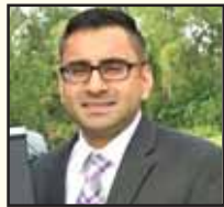
ਸਰਤਾਜ ਜੱਜ ਅਟਾਰਨੀ