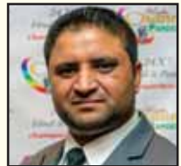
ਦਰਸ਼ਨ ਬਸਰਾਓ ਰੇਡੀਓ ਚੰਨ ਪਰਦੇਸੀ