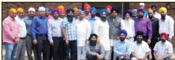
ਸੰਤ ਪ੍ਰੇਮ ਸਿੰਘ ਜੀ ਸੁਸਾਇਟੀ, ਇੰਡੀਆਨਾ

1273 N Rand Rd, Arlington Heights, IL 60004