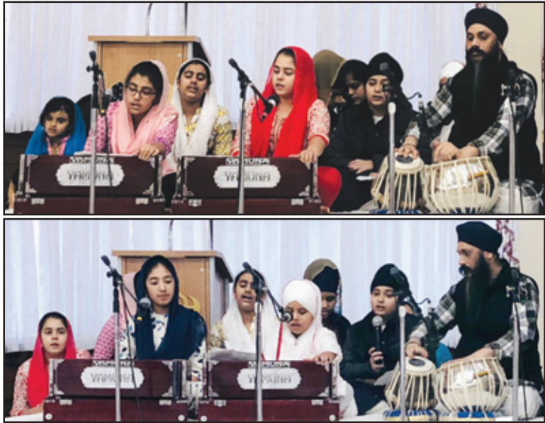
ਕੀਰਤਨ ਦਰਬਾਰ ਵਿਚ ਹਿੱਸਾ ਲੈ ਰਹੇ ਬੱਚੇ