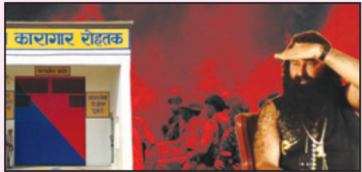
ਜਬਰ ਜਨਾਹ, ਹੱਤਿਆ ਤੇ ਜਬਰੀ ਨਿਪੁੰਸਕ ਬਣਾਉਣ ਦੇ ਮਾਮਲੇ ਦਰਜ ਹਨ। 2007 'ਚ ਉਸ ਨੂੰ ਸਿੱਖ ਭਾਈਚਾਰੇ ਦੇ ਗੁੱਸੇ ਦਾ ਸ਼ਿਕਾਰ ਹੋਣਾ ਪਿਆ ਜਦੋਂ ਉਸ ਨੇ ਸਿੱਖਾਂ ਦੀਆਂ ਧਾਰਮਿਕ ਭਾਵਨਾਵਾਂ ਨੂੰ ਠੇਸ ਪਹੁੰਚਾਈ ਸੀ। ਬਦਨਾਮੀ ਦੇ ਨੂੰ ਨੁਕਸਾਨ ਪਹੁੰਚਾਇਆ ਤੇ ਬੱਸਾਂ ਵੀ ਫੂਕ ਦਿੱਤੀਆਂ। ਫਤਿਹਾਬਾਦ ਜ਼ਿਲ੍ਹੇ ਦੇ ਰਹਿਣ ਵਾਲੇ ਡੇਰੇ ਦੇ ਸਾਬਕਾ ਸਾਧੂ ਹੰਸਰਾਜ ਚੌਹਾਨ ਨੇ 17 ਜੁਲਾਈ, 2012 ਨੂੰ ਹਾਈ ਕੋਰਟ ਵਿਚ ਪਟੀਸ਼ਨ ਦਰਜ ਕਰ ਦੇ ਡੇਰਾ ਮੁਖੀ 'ਤੇ ਡੇਰੇ ਦੇ 400 ਸਾਧੂਆਂ ਨੂੰ ਨਿਪੁੰਸਕ ਬਣਾਉਣ ਦੇ ਇਲਜ਼ਾਮ ਲਾਇਆ ਸੀ।

ਬਾਵਜੂਦ ਗੁਰਮੀਤ ਸਿਰਸਾ ਵਿਖੇ ਕਈ ਏਕੜ ਫੈਲੇ ਡੇਰੇ 'ਤੇ ਰਾਜ ਕਰਦਾ ਹੈ। ਤਕਰੀਬਨ 1000 ਏਕੜ 'ਚ ਫੈਲਿਆ ਡੇਰਾ ਸਿਰਸਾ ਆਪਣੇ ਆਪ 'ਚ ਇਕ ਸ਼ਹਿਰ ਹੈ, ਜਿਥੇ ਸਕੂਲ, ਕਾਲਜ, ਖੇਡ ਪਿੰਡ, ਹਸਪਤਾਲ, ਸਿਨੇਮਾ ਹਾਲ, ਸ਼ਾਪਿੰਗ ਮਾਲ ਤੇ ਹੋਰ ਸੁੱਖ ਸਹੂਲਤਾਂ ਮੌਜੂਦ ਹਨ। ਰਾਜਨੀਤੀ ਪਾਰਟੀਆਂ ਦਾ ਡੇਰਾ ਸਿਰਸਾ ਵਿਖੇ ਆਉਣ-ਜਾਣ ਲੱਗ ਰਹਿੰਦਾ ਹੈ। ਡੇਰਾ ਮੁਖੀ ਸਿਆਸੀ ਵਿੰਗ ਵੀ ਬਣਾਇਆ ਹੋਇਆ ਹੈ। 2014 ਦੀਆਂ ਚੋਣਾਂ 'ਚ ਡੇਰੇ ਦੇ ਰਾਜਨੀਤਕ ਵਿੰਗ ਨੇ ਹਰਿਆਣਾ ਵਿਚ ਭਾਜਪਾ ਦਾ ਸਮਰਥਨ ਕੀਤਾ ਸੀ। 2012 ਨੂੰ ਹਾਈ ਕੋਰਟ ਵਿਚ ਪਟੀਸ਼ਨ ਦਰਜ ਕਰ ਦੇ ਡੇਰਾ ਮੁਖੀ 'ਤੇ ਡੇਰੇ ਦੇ 400 ਸਾਧੂਆਂ ਨੂੰ ਨਿਪੁੰਸਕ ਬਣਾਉਣ ਦੇ ਇਲਜ਼ਾਮ ਲਾਇਆ ਸੀ।