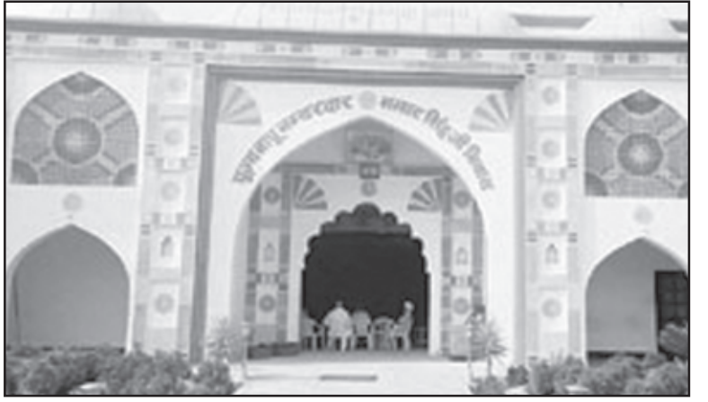
ਰਾਜਸਥਾਨ ਵਿਖੇ ਡੇਰਾ ਮੁਖੀ ਦਾ ਜੱਦੀ ਘਰ।