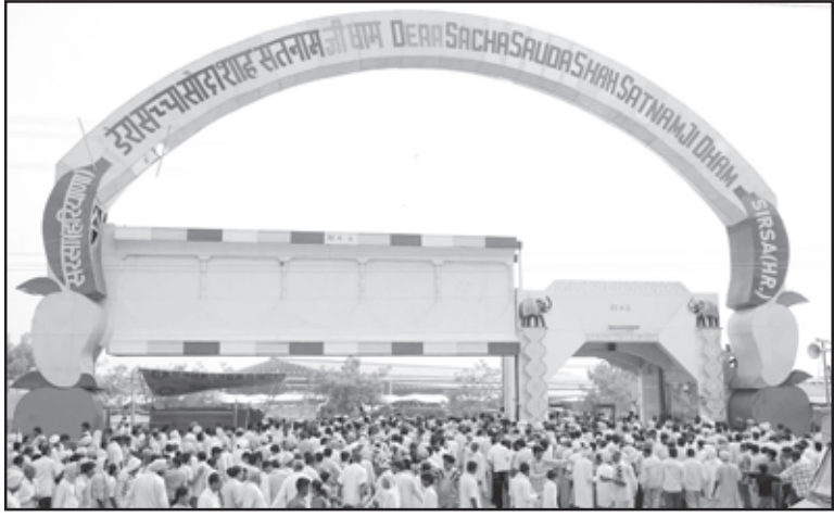
ਹਜ਼ਾਰ ਕਰੋੜ ਤੋਂ ਵੱਧ ਦੱਸੀ ਜਾ ਰਹੀ ਹੈ। ਨਵਾਂ ਡੇਰਾ ਸੱਤ ਸੌ ਕਿੱਲੋ ਜ਼ਮੀਨ ਵਿਚ ਬਣਿਆ ਹੈ ਜਿਸ ਵਿਚ ਐਮ.ਐਸ.ਜੀ. ਬਰਾਂਡ ਦੀਆਂ ਚੀਜ਼ਾਂ ਬਣਾਉਣ ਵਾਲੀਆਂ ਵੱਖ-ਵੱਖ ਫੈਕਟਰੀਆਂ ਤੋਂ

ਸਿਰਸਾ: ਡੇਰਾ ਸਿਰਸਾ ਦਾ ਸਾਮਰਾਜ ਗੁਰਮੀਤ ਰਾਮ ਰਹੀਮ ਦੇ ਗੱਦੀਨਸ਼ੀਨ ਹੋਣ ਮਗਰੋਂ ਹੀ ਖੜ੍ਹਾ ਹੋਇਆ ਹੈ। ਡੇਰੇ ਦੀ ਸਥਾਪਨਾ 1948 ਵਿਚ ਹੋਈ ਸੀ। ਡੇਰੇ ਦੇ ਪਹਿਲੇ ਗੱਦੀਨਸ਼ੀਨ ਸ਼ਾਹ ਮਸਤਾਨਾ ਸਨ ਜਿਨ੍ਹਾਂ ਮਗਰੋਂ ਗੱਦੀ ਸ਼ਾਹ ਸਤਨਾਮ ਸਿੰਘ ਨੂੰ ਸੌਂਪੀ ਗਈ। ਡੇਰੇ ਦੀ ਸਥਾਪਨਾ ਮੌਕੇ ਡੇਰੇ ਕੋਲ ਸਿਰਫ਼ ਪੰਜ ਕਿੱਲੋ ਜ਼ਮੀਨ ਸੀ ਜੋ ਦੂਜੀ ਗੱਦੀ ਤੱਕ ਵਧ ਕੇ 25 ਕਿੱਲੋ ਤੱਕ ਪੁੱਜੀ। ਸਾਲ 1990 ਵਿਚ ਡੇਰੇ ਦੇ ਤੀਜੇ ਗੱਦੀਨਸ਼ੀਨ ਗੁਰਮੀਤ ਰਾਮ ਰਹੀਮ ਸਿੰਘ ਦੀ ਨਿਯੁਕਤੀ ਨਾਲ ਡੇਰੇ ਦਾ ਵਿਸ਼ਾਲ ਸਾਮਰਾਜ ਸਥਾਪਤ ਹੋਣਾ ਸ਼ੁਰੂ ਹੋ ਗਿਆ। ਸੂਤਰਾਂ ਅਨੁਸਾਰ ਡੇਰੇ ਦੀ ਜਾਇਦਾਦ ਛੇ