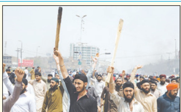
ਖੈਬਰ ਪਖਤੂਨਖਵਾ ਸੂਬੇ ਦੇ ਸ਼ਹਿਰ ਮਰਦਾਨ ਵਿਚ ਵਿਖਾਵਾ ਕਰ ਰਹੇ ਸਿੱਖ।

ਚੰਡੀਗੜ੍ਹ (ਪੰਜਾਬ ਟਾਈਮਜ਼ ਬਿਊਰੋ): ਪਾਕਿਸਤਾਨ ਵਿਚ ਹਿੰਸਾ ਦੀ ਮਾਰ ਹੇਠ ਆਏ ਸਿੱਖ ਆਖਰਕਾਰ ਸੜਕਾਂ ਉਤੇ ਉਤਰ ਆਏ ਹਨ ਅਤੇ ਸਰਕਾਰ ਨੂੰ ਸਖਤ ਚੇਤਾਵਨੀ ਦਿੰਦੀ ਹੈ ਕਿ ਜੇ ਉਨ੍ਹਾਂ ਦੀ ਜਾਨ-ਮਾਲ ਦੀ ਰਾਖੀ ਨਾ ਕੀਤੀ ਗਈ ਤਾਂ ਵੱਡੇ ਪੱਧਰ ਉਤੇ ਸੰਘਰਸ਼ ਵਿੱਢਿਆ ਜਾਵੇਗਾ। ਚੇਤੇ ਰਹੇ ਕਿ ਪਾਕਿਸਤਾਨ ਵੱਸਦੇ ਹਿੰਦੂਆਂ ਨੂੰ ਨਿਸ਼ਾਨਾ ਬਣਾਉਣ ਦੀਆਂ ਖਬਰਾਂ ਅਕਸਰ ਆਉਂਦੀਆਂ ਰਹਿੰਦੀਆਂ ਸਨ ਪਰ ਪਿਛਲੇ ਸਮੇਂ ਤੋਂ ਸਿੱਖਾਂ 'ਤੇ ਵੀ ਹਮਲੇ ਵਧ ਗਏ ਹਨ।