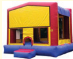
Moonwalk for kids