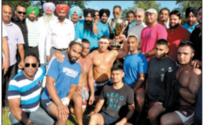
ਜੇਤੂ ਕੱਪ ਨਾਲ ਮਿਲਵਾਕੀ ਦੀ ਟੀਮ