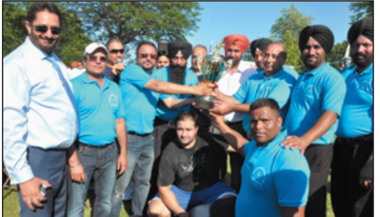
ਦੂਜੇ ਥਾਂ ਰਹੀ ਮੇਜ਼ਬਾਨ ਸ਼ੇਰੇ ਪੰਜਾਬ ਸਪੋਰਟਸ ਕਲੱਬ ਦੀ ਟੀਮ