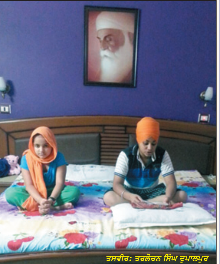
ਜਿਸ ਘਰ ਦੇ ਵਿਚ ਬੱਚੇ ਏਦਾਂ ਬੈਠ ਪੜ੍ਹਨ ਗੁਰਬਾਣੀ। ਪਤਿਤਪੁਣਾ ਤੇ ਨਸ਼ੇ ਬਿਮਾਰੀ ਨੇੜੇ ਮੂਲ ਨਾ ਆਣੀ।