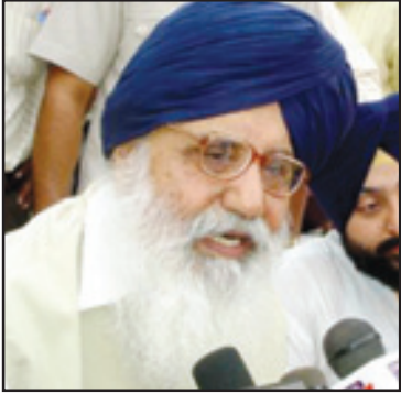
ਪੱਤਰਕਾਰਾਂ ਨਾਲ ਗੱਲਬਾਤ ਕਰ ਰਹੇ ਮੁੱਖ ਮੰਤਰੀ ਪ੍ਰਕਾਸ਼ ਸਿੰਘ ਬਾਦਲ

ਤਲਵੰਡੀ ਸਾਬੋ: ਮੁੱਖ ਮੰਤਰੀ ਪ੍ਰਕਾਸ਼ ਸਿੰਘ ਬਾਦਲ ਨੇ ਧਾਰਾ 370 ਦੇ ਮੁੱਦੇ 'ਤੇ ਸਰਵ ਪ੍ਰਵਾਨਤ ਹੱਲ ਦੀ ਵਕਾਲਤ ਕਰਦਿਆਂ ਕਿਹਾ ਕਿ ਅਜਿਹੇ ਮੁੱਦਿਆਂ 'ਤੇ ਕੋਈ ਵੀ ਫੈਸਲਾ ਲੈਣ ਤੋਂ ਪਹਿਲਾਂ ਕੇਂਦਰ ਸਰਕਾਰ ਨੂੰ ਦੇਸ਼ ਦੀਆਂ ਸਾਰੀਆਂ ਸਿਆਸੀਆਂ ਪਾਰਟੀਆਂ ਨੂੰ ਭਰੋਸੇ ਵਿਚ ਲੈਣਾ