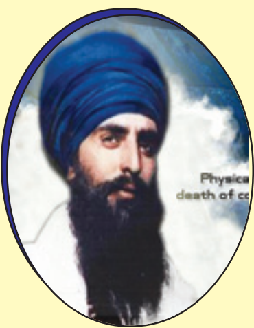
ਸੰਤ ਜਰਨੈਲ ਸਿੰਘ