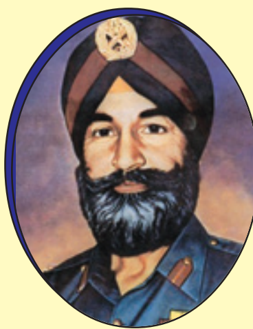
ਜਨਰਲ ਸੁਬੇਗ ਸਿੰਘ