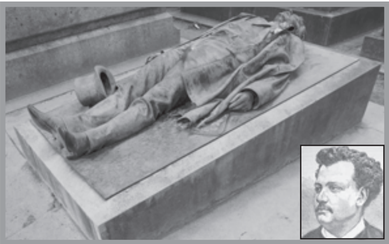
ਬਾਦਸ਼ਾਹ ਨੈਪੋਲੀਅਨ ਦੇ ਭਤੀਜੇ ਪੀਅਰੀ ਨੈਪੋਲੀਅਨ ਵੱਲੋਂ ਕਤਲ ਫਰਾਂਸੀਸੀ ਪੱਤਰਕਾਰ ਵਿਕਤੋਰ ਨੋਇਰ (ਇਨਸੈਟ) ਦੀ ਕਬਰ।

ਲਕੋਏ। ਪੁਲਿਸ ਨੇ ਜਿਹੜੀਆਂ ਗ੍ਰਿਫਤਾਰੀਆਂ ਕੀਤੀਆਂ, ਉਨ੍ਹਾਂ ਵਿਚੋਂ ਤਿੰਨ ਫੋਨੀ ਹਿੰਸਾ ਲਈ ਕਸੂਰਵਾਰ ਠਹਿਰਾਏ ਗਏ ਤੇ ਫਾਂਸੀ ਦੀ ਸਜ਼ਾ ਦਾ ਫੈਸਲਾ ਸੁਣਾਇਆ। 21 ਨਵੰਬਰ ਨੂੰ 25 ਹਜ਼ਾਰ ਹਮਦਰਦਾਂ ਨੇ ਮਹਾਰਾਣੀ ਨੂੰ ਦਰਖਾਸਤ ਦਿੱਤੀ ਕਿ ਖਿਮਾ ਕਰ ਦਿਓ। ਖਿਮਾ ਨਹੀਂ ਫਾਂਸੀ ਮਿਲੀ। ਫਾਂਸੀ ਵਾਲੇ ਦਿਨ ਗਲੀਆਂ ਵਿਚ ਸੁੰਨ ਵਰਤੀ ਹੋਈ ਸੀ ਪਰ ਆਇਰਿਸ਼ ਚਰਚਾ ਵਿਚ ਇੰਨੀ ਭੀੜ ਕਿ ਥਾਂ ਨਾ ਮਿਲੇ। ਆਪਣੇ ਸ਼ਹੀਦਾਂ ਵਾਸਤੇ