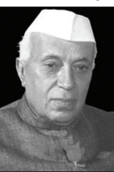
ਪੰਡਤ ਜਵਾਹਰ ਲਾਲ ਨਹਿਰੂ

ਰਫਤਾਰ ਪਹਿਲਾਂ ਨਾਲੋਂ ਧੀਮੀ ਹੀ ਰੱਖੀ। ਬੱਸ ਦੀ ਹਰ ਇਕ ਸਵਾਰੀ ਕੋਲ ਤੁਰ ਗਈ ਆਤਮਾ ਬਾਰੇ ਕੋਈ ਨਾ ਕੋਈ ਉਸਤਤੀ ਗਾਥਾ ਸੀ। ਇੱਕ ਬੰਦ ਹੁੰਦਾ ਸੀ ਤਾਂ ਦੂਜਾ ਬੋਲ ਪੈਂਦਾ। ਅਸੀਂ ਕਰਨਾਲ ਵਿਖੇ ਆਮ ਨਾਲੋਂ ਘਟ ਸਮਾਂ ਠਹਿਰ ਕੇ ਦਿੱਲੀ ਨੂੰ ਤੁਰ ਪਏ। ਡਰਾਈਵਰ ਬੜਾ ਧਿਆਨ ਨਾਲ ਗੱਡੀ ਚਲਾ ਰਿਹਾ ਸੀ। ਉਸ ਨੇ ਵੇਖ ਲਿਆ ਸੀ ਕਿ ਰਾਹ ਵਿਚ ਪੈਂਦੇ ਕਸਬਿਆਂ ਤੇ ਸ਼ਹਿਰਾਂ ਵਿਚ ਲੋਕ ਸੋਗ ਪਰਗਟ ਕਰਨ ਦੀ ਭਾਵਨਾ ਨਾਲ ਦੁਕਾਨਾਂ