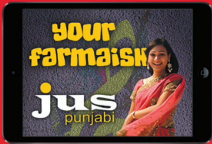
Apple iPad mini