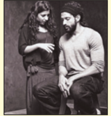
ਆਪਣੇ ਭਰਾ ਫਰਹਾਨ ਨੂੰ ਸੀਨ ਸਮਝਾ ਰਹੀ ਜੋਇਆ ਅਖਤਰ।

ਕਿ ਦੁਬਾਰਾ ਜ਼ਿੰਦਗੀ ਮਿਲਣੀ ਨਹੀਂ ਹੈ, ਇਸ ਲਈ ਇਸ ਜ਼ਿੰਦਗੀ ਨੂੰ ਹੋਰ, ਹੋਰ ਖੂਬਸੂਰਤ ਬਣਾਓ। ਇਸ ਫਿਲਮ ਉੱਤੇ ਕੁੱਲ 5.50 ਕਰੋੜ ਰੁਪਏ ਲੱਗੇ ਸਨ ਅਤੇ ਇਸ ਨੇ ਕਮਾਈ 15.53 ਕਰੋੜ ਰੁਪਏ ਦੀ ਕੀਤੀ ਸੀ। ਜੋਇਆ ਅਖਤਰ ਪਹਿਲਾਂ-ਪਹਿਲ ਬੜੇ ਐਕਟਰ ਫਿਲਮੀ ਦੁਨੀਆਂ ਵਿਚ ਆਈ ਸੀ। ਫਿਲਮ 'ਕਾਮਸੂਤਰ' ਵਿਚ ਉਹ ਮਸ਼ਹੂਰ ਅਦਾਕਾਰਾ ਰੋਖਾ ਨਾਲ ਆਈ ਸੀ ਅਤੇ ਇਹ ਕਿਰਦਾਰ ਕੋਈ ਬਹੁਤ ਮਹੱਤਵਪੂਰਨ ਨਹੀਂ ਸੀ ਪਰ ਆਪਣੀ ਅਦਾਕਾਰੀ ਨਾਲ ਜੋਇਆ ਨੇ ਸਭ ਦਾ ਧਿਆਨ ਖਿੱਚ ਲਿਆ। ਜੋਇਆ ਨੇ ਪੈਪਸੀ ਅਤੇ ਫਿਨੋਲੋਕਸ ਵਰਗੇ ਬ੍ਰਾਂਡਾਂ ਦੇ ਇਸਤਿਹਾਰ ਵੀ ਬਣਾਏ। ਫਿਰ ਉਸ ਨੇ ਇਕ ਰੌਕ ਬੈਂਡ ਲਈ 'ਪਰਾਈਸ ਆਫ ਬੁਲਿਟਸ' ਸੰਗੀਤ ਵੀਡੀਓ ਬਣਾਈ। ਫਿਰ ਕੁਝ ਫਿਲਮਾਂ ਵਿਚ ਕਾਸਟਿੰਗ ਡਾਇਰੈਕਟਰ ਬਣੀ। ਇਸ ਤੋਂ ਬਾਅਦ ਆਪੇ ਭਰਾ ਦੀਆਂ ਫਿਲਮਾਂ ਵਿਚ ਅਸਿਸਟੈਂਟ ਡਾਇਰੈਕਟਰ ਵਜੋਂ ਕੰਮ ਕੀਤਾ। ਇਨ੍ਹਾਂ ਫਿਲਮਾਂ ਵਿਚ 'ਲਕਸ਼ੈ' ਅਤੇ 'ਦਿਲ ਚਾਹਤਾ ਹੈ' ਵਰਗੀਆਂ ਫਿਲਮਾਂ ਵੀ ਸ਼ਾਮਲ ਹਨ। ਫਿਰ ਤਾਂ ਚੱਲ ਸੋ ਚੱਲ। ਉਸ ਨੇ ਕਦੀ ਪਿਛੇ ਮੁੜ ਕੇ ਨਹੀਂ ਦੇਖਿਆ। ਉਹ ਖੁਦ ਆਖਦੀ ਹੈ ਜਿਸ ਵਿਚ ਕੋਈ ਪ੍ਰਤਿਭਾ ਹੈ, ਉਹ ਕਿਸੇ ਨਾ ਕਿਸੇ ਦਿਨ ਸਾਹਮਣੇ ਆਉਣੀ ਹੀ ਹੁੰਦੀ ਹੈ।