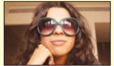
ਜੋਇਆ ਅਖਤਰ ਦਾ ਇਕ ਅੰਦਾਜ਼ਾ।

ਕੱਲ੍ਹ ਤੱਕ ਜੋਇਆ ਅਖਤਰ, ਸ਼ਾਇਰ ਜਾਵੇਦ ਅਖਤਰ ਅਤੇ ਪਟਕਥਾ ਲੇਖਕਾ ਹਨੀ ਇਰਾਨੀ ਦੀ ਧੀ ਸੀ। ਅੱਜ ਉਸ ਨੇ ਆਪਣੀ ਜਾਣ-ਪਛਾਣ ਆਪ ਬਣਾਈ ਹੈ। ਅੱਜ ਕੱਲ੍ਹ ਉਸ ਦੀ ਅਗਲੀ ਫਿਲਮ ਦੀ ਚਰਚਾ ਗਲੀ-ਗਲੀ ਹੋ ਰਹੀ ਹੈ ਅਤੇ ਇਹ ਫਿਲਮ ਬਣਾਉਣ ਦਾ ਅਜੇ ਐਲਾਨ ਹੀ ਹੋਇਆ ਹੈ। ਇਸ ਫਿਲਮ ਦਾ ਨਾਂ ਵੀ ਅਜੇ ਨਹੀਂ ਰੱਖਿਆ ਗਿਆ। ਸਿਰਫ ਐਲਾਨ ਹੀ ਹੋਇਆ। ਫਿਲਮ ਵਿਚ ਪ੍ਰਿਯੰਕਾ ਚੋਪੜਾ, ਰਣਵੀਰ ਸਿੰਘ ਅਤੇ ਅਨੁਸ਼ਕਾ ਸ਼ਰਮਾ ਕੰਮ ਕਰ ਰਹੇ ਹਨ। ਪ੍ਰਿਯੰਕਾ ਅਤੇ ਰਣਵੀਰ ਸਿੰਘ ਇਸ ਫਿਲਮ ਵਿਚ ਭੈਣ-ਭਰਾ ਬਣਨਗੇ ਅਤੇ ਅਨੁਸ਼ਕਾ ਸ਼ਰਮਾ ਨਾਲ ਰਣਵੀਰ ਸਿੰਘ ਦੀ ਰੁਮਾਂਟਿਕ ਜੋੜੀ ਬਣਾਈ ਗਈ ਹੈ। ਇਨ੍ਹਾਂ ਦੋਹਾਂ ਐਕਟਰਾਂ ਦੀ ਪਲੇਨੀ ਫਿਲਮ 'ਬੈਂਡ ਬਾਜਾ ਬਰਾਤ' ਬੜੀ ਸਫਲ ਰਹੀ ਹੀ; ਕਮਾਈ ਪੱਖੋਂ