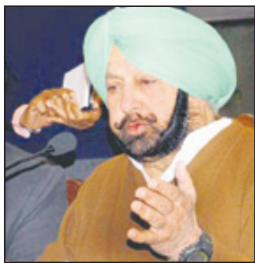
ਕੈਪਟਨ ਅਮਰਿੰਦਰ ਸਿੰਘ

ਸਾਬਕਾ ਪ੍ਰਧਾਨ ਮਰਹੂਮ ਸੰਤ ਹਰਚੰਦ ਸਿੰਘ ਲੌਂਗੋਵਾਲ ਵੱਲੋਂ ਤਤਕਾਲੀ ਪ੍ਰਧਾਨ ਮੰਤਰੀ ਇੰਦਰਾ ਗਾਂਧੀ ਦੇ ਨਿੱਜੀ ਸਕੱਤਰ ਆਰ.ਕੇ. ਧਵਨ ਨੂੰ 25 ਅਪਰੈਲ 1984 ਨੂੰ ਲਿਖੀ ਚਿੱਠੀ ਦਾ ਹਵਾਲਾ ਦਿੰਦਿਆਂ ਕੈਪਟਨ ਅਮਰਿੰਦਰ ਸਿੰਘ ਨੇ ਸ. ਬਾਦਲ ਨੂੰ ਵੰਗਾਰਿਆ ਕਿ ਉਹ ਇਹ ਸਪਸ਼ਟ ਕਰੇ ਕਿ ਕੀ ਸਾਕਾ ਨੀਲਾ ਤਾਰਾ ਤੋਂ ਪਹਿਲਾਂ ਕੇਂਦਰ ਸਰਕਾਰ ਨਾਲ ਚੱਲ ਰਹੀ ਗੱਲਬਾਤ ਵਿਚ ਉਹ ਨਿੱਜੀ ਤੌਰ 'ਤੇ ਸ਼ਾਮਲ ਸੀ ਜਾਂ ਨਹੀਂ? ਚਿੱਠੀ ਵਿਚ ਲਿਖਿਆ ਹੈ, "ਤੁਸੀਂ ਜਾਣਦੇ ਹੋ ਕਿ ਸਰਦਾਰ ਗੁਰਚਰਨ ਸਿੰਘ (ਟੌਹੜਾ) ਦੀ ਜਾਨ ਨੂੰ ਵੱਡਾ ਖਤਰਾ ਹੈ ਜਿਸ ਕਰ ਕੇ ਮੈਂ ਤੁਹਾਨੂੰ ਇਹ ਚਿੱਠੀ ਲਿਖ ਰਿਹਾ ਹਾਂ। ਸੰਤ ਜਰਨੈਲ ਸਿੰਘ