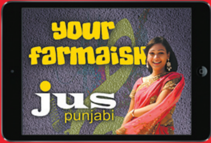
Apple iPad mini