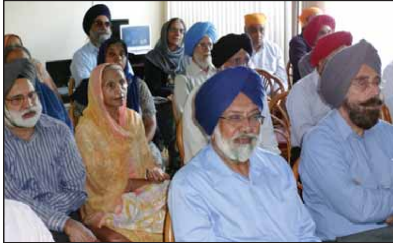
ਸੈਮੀਨਾਰ ਵਿਚ ਹਾਜ਼ਰ ਲੋਕ