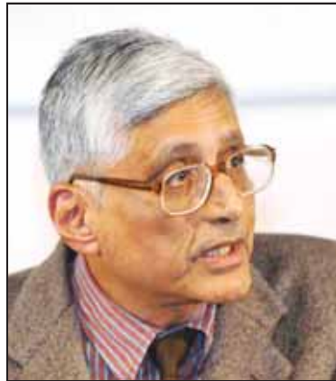
ਪਾਰੋਂ ਬਹੁਤ ਸਾਰੇ ਲੋਕ ਇਧਰ ਆ ਗਏ ਸਨ। ਉਸੇ ਦੌਰ ਵਿਚ ਉਨ੍ਹਾਂ ਦੇ ਦਾਦਾ (ਮਹਾਤਮਾ ਗਾਂਧੀ)

ਪ੍ਰਿੰਸੀਪਲ ਇਕ ਪੰਜਾਬੀ ਸੀ। ਬਹੁਤ ਸਾਰੇ ਮੁਸਲਮਾਨ ਦਿੱਲੀ ਛੱਡ ਕੇ ਚਲੇ ਗਏ ਤੇ ਸਰਹੱਦ