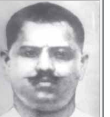
ਰਾਮ ਪੁਸਾਦ ਬਿਸਮਿਲ

ਇਹ ਗਦਰੀਆਂ ਦਾ ਹੀ ਪ੍ਰਭਾਵ ਸੀ ਕਿ ਪਿਛਲੀਆਂ ਇਨਕਲਾਬੀ ਲਹਿਰਾਂ ਵਿਚ ਵੀ ਧਰਮ ਨੂੰ ਮੰਨਦਿਆਂ ਹੋਇਆਂ ਵੀ, ਧਰਮ ਤੋਂ ਉਪਰ ਉਠ ਕੇ ਦੇਸ਼ ਦੀ ਆਜ਼ਾਦੀ ਲਈ ਇਕ ਜਾਨ ਹੋ ਕੇ ਕੰਮ ਕਰਨ ਤੇ ਕੁਰਬਾਨ ਹੋਣ ਦੀਆਂ ਅਨੇਕਾਂ ਮਿਸਾਲਾਂ ਵਿਚੋਂ ਕਾਕੋਰੀ ਕੇਸ ਨਾਲ ਸੰਬੰਧਤ ਦੋ ਸ਼ਹੀਦਾਂ ਰਾਮ ਪੁਸਾਦ ਬਿਸਮਿਲ ਅਤੇ ਅਸ਼ਵਾਕ-ਉਲਾ ਦੇ ਆਪਸੀ ਪੀਚਵੇਂ ਪਿਆਰ ਦੀ ਮਿਸਾਲ ਦਿੱਤੀ ਜਾ ਸਕਦੀ ਹੈ। ਦੋਵੇਂ ਹੀ ਆਪਣੇ-ਆਪਣੇ ਧਰਮ ਵਿਚ ਪਰਪੱਕ ਪਰ ਦੇਸ਼ ਪਿਆਰ ਤੇ ਕੁਰਬਾਨੀ ਦੇ ਜਜ਼ਬੇ ਨਾਲ ਵੀ ਭਰਪੂਰ। ਇੱਕ ਕੱਟੜ ਆਰੀਆ ਸਮਾਜੀ ਤੇ ਦੂਜਾ ਪੱਕਾ ਮੁਸਲਮਾਨ। ਤੇ ਇਹ ਉਸ ਵੇਲੇ ਦੀ ਗੱਲ ਹੈ ਜਦੋਂ ਹਿੰਦੂ ਮੁਸਲਮਾਨਾਂ ਵਿਚ ਬੜੀ ਵਿੱਥ ਪੈਂਦੀ ਜਾ ਰਹੀ ਸੀ। ਰਾਮ ਪੁਸਾਦ ਬਿਸਮਿਲ ਆਪਣੀ ਸਵੈਜੀਵਨੀ ਵਿਚ ਅਸ਼ਵਾਕ-ਉਲਾ ਨੂੰ 'ਸੱਚਾ ਮੁਸਲਮਾਨ ਤੇ ਸੱਚਾ ਦੇਸ਼ ਭਗਤ' ਆਖਦਾ ਹੈ ਤੇ ਇਹ ਵੀ ਮੰਨਦਾ ਹੈ, "ਤੇਰੇ ਮੇਰੇ ਵਿਚ ਕੋਈ ਫ਼ਰਕ ਹੀ ਨਹੀਂ ਸੀ। ਕਈ ਵਾਰ ਤੂੰ ਤੇ ਮੈਂ ਇਕੋ ਥਾਲੀ ਵਿਚ ਰੋਟੀ ਖਾਧੀ।"