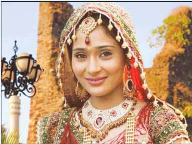
ਹੰਸ, ਫ਼ੀਲ, ਮੁਕਲਾਵੇ ਜੋ ਨਾਰ ਆਈ, ਮੜਕ ਨਾਲ ਉਠਾਵਦੇ ਪੈਰ ਤਿੰਨੋਂ...

ਸਾਇਆ ਸੰਘਣੀ ਸਰਦ ਜ਼ਰੂਰ ਦਿੰਦੇ, ਪਿੱਪਲ, ਨਿੰਮ, ਸ਼ਰੀਂਹ ਤੇ ਬੋਹੜ ਚਾਰੇ। ਦੁੱਖ ਦੇਣ ਨ ਚੱਲੀਏ ਪੈਰ ਨੰਗੇ, ਕੰਡਾ, ਕੱਚ, ਅਰ ਠੀਕਰੀ, ਰੋੜ ਚਾਰੇ। ਪਿੱਛੇ ਲੱਗੀਆਂ ਲਹਿਣ ਬੀਮਾਰੀਆਂ ਨਾ, ਦੱਦ, ਖੰਘ, ਅਧਰੰਗ ਤੇ ਕੋਹੜ ਚਾਰੇ। ਵੱਸ ਭੂੜ, ਸਪੂੜ, ਸਰਵੈਂਟ, ਚੇਲਾ, ਨਹੀਂ ਕਰਨ ਜ਼ਬਾਨ ਸੇ ਮੋੜ ਚਾਰੇ। ਦਾੜਾ, ਭੰਡ, ਗੰਢ-ਕੱਟ, ਜੁਆਰੀਆ ਵੀ, ਧਨ ਦਿਨ ਮੇਂ ਦੇਣ ਨਖੋੜ ਚਾਰੇ। ਜੜੀ, ਸਖੀ, ਅਵਤਾਰ ਤੇ ਹੋਰ ਸੂਰਾ, ਠੀਕ ਰੱਖਦੇ ਧਰਮ ਦੀ ਲੋੜ ਚਾਰੇ। ਦਿਲ, ਦੁੱਧ ਤੇ ਕੱਚ ਸਮੇਤ ਪੱਥਰ,