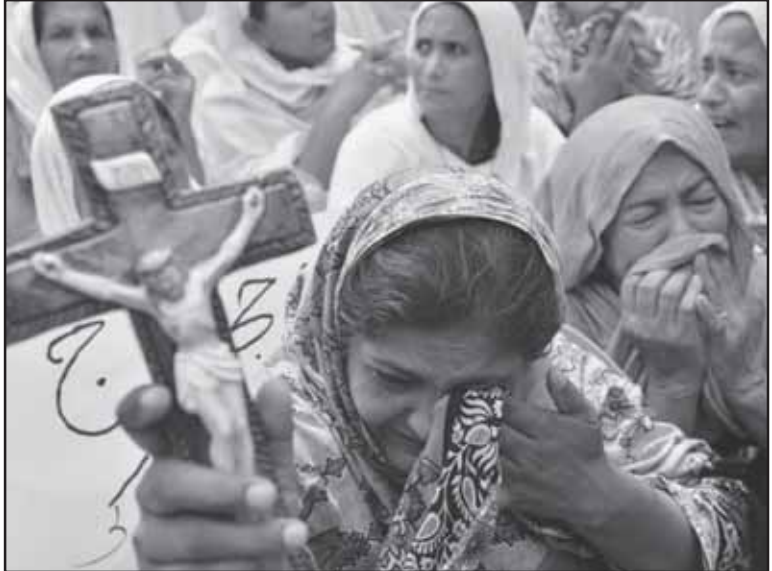
ਪਾਕਿਸਤਾਨ 'ਚ ਚਰਚ ਉੱਤੇ ਹਮਲੇ ਤੋਂ ਪ੍ਰਭਾਵਿਤ ਕੁਝ ਲੋਕ

ਮਾੜੀ ਗੱਲ ਇਹ ਹੈ ਕਿ ਪਾਕਿਸਤਾਨ ਦਾ ਮੀਡੀਆ ਵੀ ਬਹੁਤਾ ਕਰ ਕੇ ਉਹ ਗੱਲਾਂ ਕਰਦਾ ਹੈ, ਜਿਨ੍ਹਾਂ ਦੀ ਉਸ ਦੇ ਕੰਨ ਵਿਚ ਕਿਸੇ ਪਾਸੇ ਤੋਂ ਫੁਕ ਮਾਰੀ ਜਾਂਦੀ ਹੈ। ਉਹ ਆਪਣੇ ਸਿਰ ਨਾਲ ਸਿਰਫ ਅੰਦਰੂਨੀ ਰਾਜਨੀਤੀ ਦੇ ਮਾਮਲੇ ਵਿਚ ਇੱਕ ਜਾਂ ਦੂਸਰੀ ਪਿਰ ਦਾ ਪੱਖ ਲੈਣ ਵੇਲੇ ਜਾਂ ਕਿ ਕੁਝ ਦੇ ਕੀਤੇ ਕੱਢਣ ਵੇਲੇ ਸੋਚਦਾ ਹੈ, ਭਾਰਤ ਨਾਲ ਸਬੰਧ ਸੁਧਾਰਨ ਵਿਚ ਉਸ ਦੀ ਕੋਈ ਦਿਲਚਸਪੀ ਨਹੀਂ ਜਾਪਦੀ, ਸਗੋਂ ਵਿਗਾੜ ਦੇ ਟੋਟੇ ਪੁੱਟਦਾ ਹੈ। ਇਸੇ ਸੋਚਣੀ ਦੇ ਨਾਲ ਪਾਕਿਸਤਾਨ ਦੇ ਇੱਕ ਪੱਤਰਕਾਰ ਨੇ ਭਾਰਤ ਦੇ ਪ੍ਰਧਾਨ ਮੰਤਰੀ ਨੂੰ ਨਵਾਜ਼ ਸ਼ਰੀਫ ਵੱਲੋਂ 'ਦਿਹਾੜੀ ਔਰਤ ਵਰਗਾ' ਆਖਣ ਦੀ ਉਹ ਮਨਘੜਤ ਟਿਪਣੀ ਪੇਸ਼ ਕਰ ਦਿੱਤੀ ਸੀ, ਜਿਹੜੀ ਓਥੇ ਬੈਠੀ ਭਾਰਤੀ ਪੱਤਰਕਾਰ ਵੀ ਕਹਿੰਦੀ ਹੈ ਕਿ ਨਵਾਜ਼ ਨੇ ਨਹੀਂ ਸੀ ਕਹੀ ਤੇ ਨਵਾਜ਼ ਨੇ ਵੀ ਇਸ ਦਾ ਖੰਡਨ ਕਰ ਦਿੱਤਾ ਹੈ। ਬਾਅਦ ਵਿਚ ਉਸ ਪੱਤਰਕਾਰ ਨੇ ਇਹ ਟਿਪਣੀ ਵਾਪਸ ਵੀ ਲੈ ਲਈ ਹੈ। ਇਸ ਤਰ੍ਹਾਂ ਦੀਆਂ ਗੱਲਾਂ ਕਰ ਕੇ ਭਾਰਤ ਤੇ ਪਾਕਿਸਤਾਨ ਦੇ ਸਬੰਧਾਂ ਨੂੰ ਵਿਗਾੜਨ ਦਾ ਯਤਨ ਕਰਨ ਵਾਲੇ ਇਨ੍ਹਾਂ ਪੱਤਰਕਾਰਾਂ ਨੇ ਉਦੋਂ ਕੌੜਾ ਸੱਚ ਪ੍ਰਵਾਨ ਨਹੀਂ ਸੀ ਕੀਤਾ, ਜਦੋਂ ਕਾਰਗਿਲ ਦੀਆਂ ਚੋਟੀਆਂ ਤੋਂ ਪਾਕਿਸਤਾਨ ਦੇ ਫੌਜੀ ਗੋਲੇ