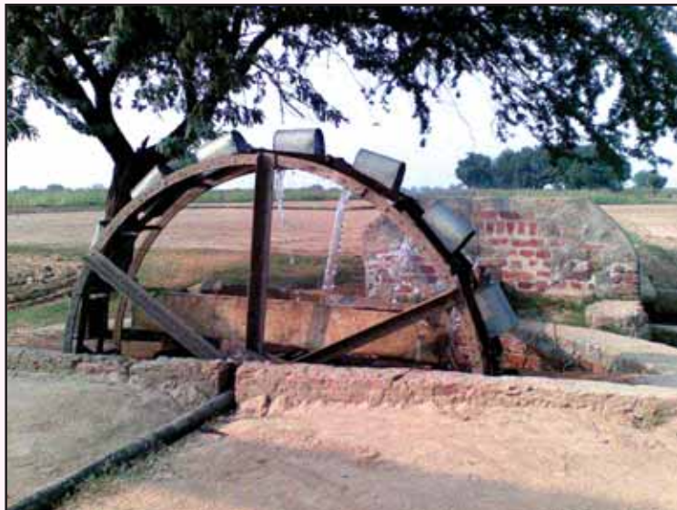
ਸਹਿਜ ਸਹਿਜ ਨਾਲ ਖੂਹ ਪਿਆ ਵਗੇ ਟਿੱਡਾਂ ਸੁੱਟਣ ਪਾਣੀ। ਨਵੇਂ ਪੱਚ ਲਈ ਬਣ ਕੇ ਰਹਿ ਗਈ ਇਹ ਵੀ ਇਕ ਕਹਾਣੀ!