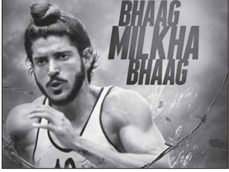
ਅਦਾਕਾਰ ਇਰਫਾਨ ਅਖਤਰ ਫਿਲਮ 'ਭਾਗ ਮਿਲਖਾ ਭਾਗ' ਵਿਚ

1960 ਵਿਚ ਜਦੋਂ ਰੋਮ ਦੀਆਂ ਉਲੰਪਿਕ ਖੇਡਾਂ ਹੋਈਆਂ ਉਦੋਂ 400 ਮੀਟਰ ਦੌੜ ਦਾ