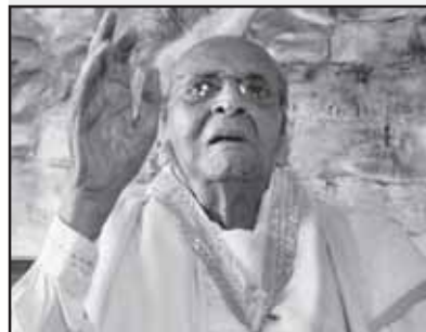
ਪ੍ਰਾਣ ਆਪਣੇ ਬੁਢਾਪੇ ਵੇਲੇ

ਮੁੰਬਈ: ਸਦਾਬਹਾਰ ਬਾਲੀਵੁੱਡ ਅਦਾਕਾਰ ਪ੍ਰਾਣ ਦਾ 93 ਵਰ੍ਹਿਆਂ ਦੀ ਉਮਰ ਵਿਚ ਦੇਹਾਂਤ ਹੋ ਗਿਆ। ਉਹ ਲੰਬੇ ਸਮੇਂ ਤੋਂ ਬਿਮਾਰੀ ਨਾਲ ਜੂਝ ਰਹੇ ਸਨ। ਪ੍ਰਾਣ ਦਾ ਲੀਲਾਵਤੀ ਹਸਪਤਾਲ ਵਿਚ ਇਲਾਜ ਚੱਲ ਰਿਹਾ ਸੀ ਜਿੱਥੇ ਉਨ੍ਹਾਂ ਆਖਰੀ ਸਾਹ ਲਿਆ। ਪ੍ਰਾਣ ਦਾ ਪੂਰਾ ਨਾਂ ਪ੍ਰਾਣ ਕ੍ਰਿਸ਼ਨ ਸਿਕੰਦ ਸੀ। ਉਨ੍ਹਾਂ ਦਾ ਜਨਮ 12 ਫਰਵਰੀ, 1920 ਨੂੰ