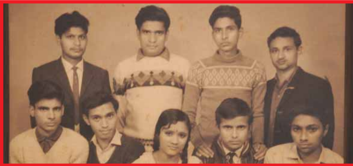
ਇਕ ਨੇਪਾਲੀ ਕਾਲਜ ਦੇ ਪਾੜਿਆਂ ਦੀ 1966 'ਚ ਖਿੱਚੀ ਤਸਵੀਰ। ਗਰੈਜੂਏਟਾਂ ਦੇ ਇਸ ਬੈਚ 'ਚ ਸਿਰਫ ਇਕ ਲੜਕੀ ਸੀ।

ਸਾਡੇ ਰੋਜ਼ਮੱਰਾ ਜੀਵਨ ਵਿਚ ਬਹੁਤ ਸਾਰੀਆਂ ਗੱਲਾਂ ਅਜਿਹੀਆਂ ਹੁੰਦੀਆਂ ਹਨ ਜਿਹੜੀਆਂ ਅਕਸਰ ਅਣਫੋਹੀਆਂ ਜਿਹੀਆਂ ਰਹਿ ਜਾਂਦੀਆਂ ਹਨ। ਮਸਲਨ, ਜਦੋਂ ਤੁਸੀਂ ਚਿਰਾਂ ਬਾਅਦ ਘਰ ਪਰਤਦੇ ਹੋ, ਤਾਂ ਤੁਹਾਡੇ ਮਾਪਿਆਂ ਦੇ ਚਿਹਰੇ ਉਤੇ ਆਈ ਮਿੱਠੀ ਤੇ ਮਿੱਠੀ ਮੁਸਕਾਣ; ਜਾਂ ਘਰੋਂ ਤੁਰਨ ਵੇਲੇ ਉਨ੍ਹਾਂ ਦੇ ਚਿਹਰੇ ਉਤੇ ਛਾਈ ਉਦਾਸੀ; ਤਫਰੀਹ ਜਿਹੀ ਦੌਰਾਨ ਆਪਣੇ ਮਿੱਤਰਾਂ-ਦੋਸਤਾਂ ਨਾਲ ਕਿਸੇ ਰੈਸਟੋਰੈਂਟ ਵਿਚ ਜਾਣਾ ਤੇ ਉਥੇ