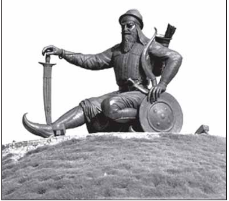
ਚੱਪੜਚਿੜੀ (ਮੋਹਾਲੀ) ਵਿਚ ਬੰਦਾ ਸਿੰਘ ਬਹਾਦਰ ਦੀ ਬਣਾਈ ਗਈ ਯਾਦਗਾਰ