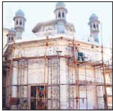
ਦਰਵਾਜ਼ੇ ਹਨ। ਯਾਦਗਾਰ ਦੇ ਕੰਪਲੈਕਸ ਲਈ ਹੁਣ 60 ਗੁਣਾ 65 ਫੁੱਟ ਰਕਬਾ ਰੱਖਿਆ ਗਿਆ ਹੈ ਜਿਸ

ਗ੍ਰੰਥ ਸਾਹਿਬ ਦਾ ਪ੍ਰਕਾਸ਼ ਕੀਤਾ ਜਾਵੇਗਾ। ਇਹ ਇਮਾਰਤ ਅੱਠ ਕੋਨੀ ਹੈ ਜਿਸ ਵਿਚ ਤਿੰਨ ਪਾਸੇ