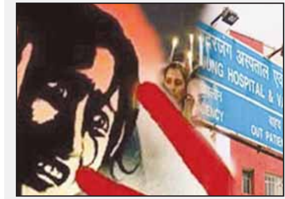
ਲੁਧਿਆਣਾ ਵਿਚ 103 ਕੇਸ ਲਟਕੇ