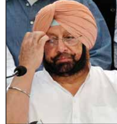
ਕੈਪਟਨ ਅਮਰਿੰਦਰ ਸਿੰਘ