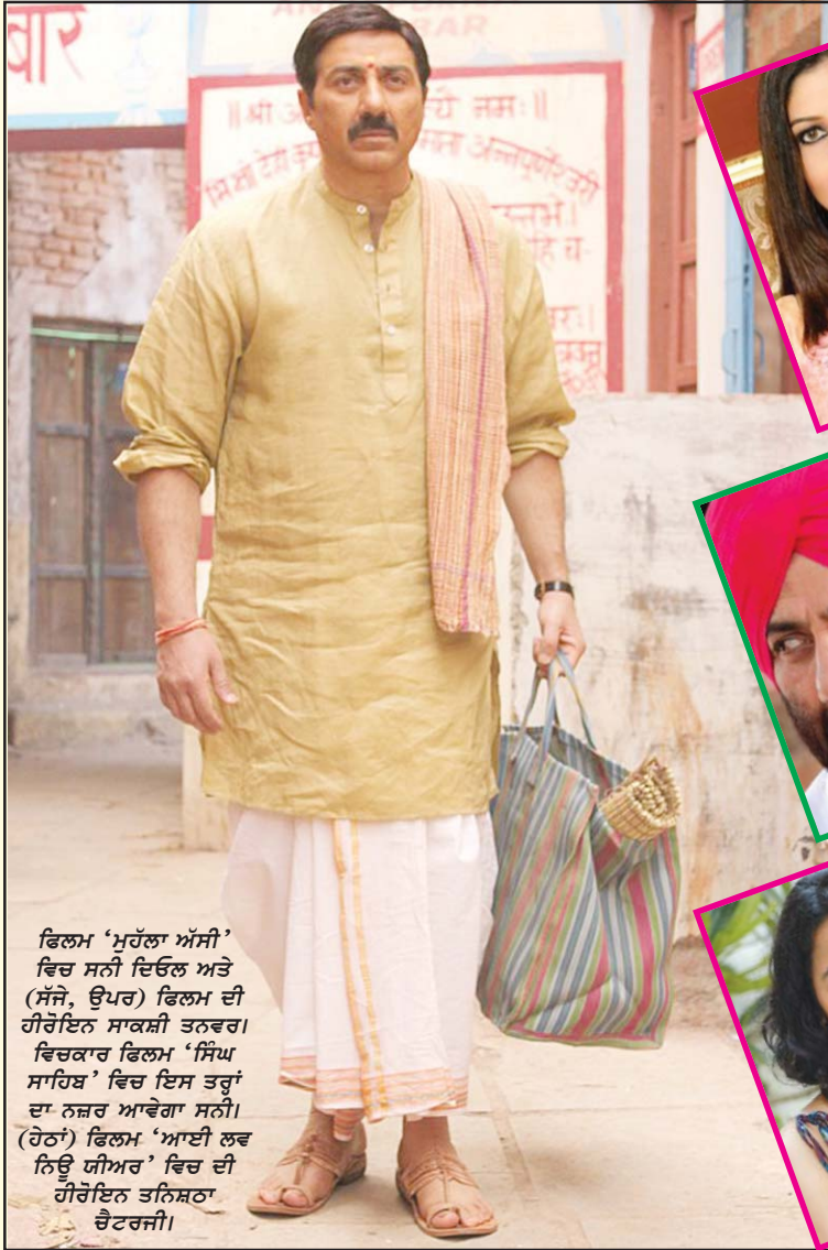
ਫਿਲਮ 'ਮੁਹੱਲਾ ਅੱਸੀ' ਵਿਚ ਸਨੀ ਦਿਓਲ ਅਤੇ (ਸੱਜੇ, ਉਪਰ) ਫਿਲਮ ਦੀ ਹੀਰੋਇਨ ਸਾਕਸ਼ੀ ਤਨਵਰ। ਵਿਚਕਾਰ ਫਿਲਮ 'ਸਿੰਘ ਸਾਹਿਬ' ਵਿਚ ਇਸ ਤਰ੍ਹਾਂ ਦਾ ਨਜ਼ਰ ਆਵੇਗਾ ਸਨੀ। (ਹੇਠਾਂ) ਫਿਲਮ 'ਆਈ ਲਵ ਨਿਊ ਯੀਅਰ' ਵਿਚ ਦੀ ਹੀਰੋਇਨ ਤਨਿਸ਼ਠਾ ਚੈਟਰਜੀ।