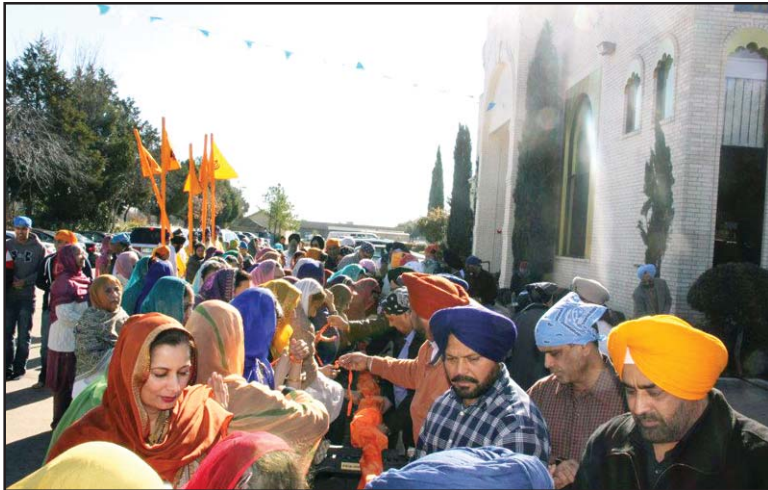
ਗੁਰਦੁਆਰਾ ਸਿੱਖ ਟੈਂਪਲ ਗਾਰਲੈਂਡ ਵਿਖੇ ਗੁਰੂ ਘਰ ਦੀ ਪਰਿਕਾਰਮਾ ਕਰਦੀਆਂ ਅਤੇ ਨਿਸ਼ਾਨ ਸਾਹਿਬ ਨੂੰ ਚੋਲਾ ਚੜ੍ਹਾ ਰਹੀਆਂ ਸੰਗਤਾਂ

ਡੈਲਸ, ਟੈਕਸਸ (ਹਰਜੀਤ ਢੇਸੀ): ਸਥਾਨਕ ਗੁਰਦੁਆਰਾ ਸਿੱਖ ਟੈਂਪਲ, ਗਾਰਲੈਂਡ ਅਤੇ ਗੁਰਦੁਆਰਾ ਸਿੱਖ ਸਭਾ, ਰਿਚਰਡਸਨ ਵਿਖੇ