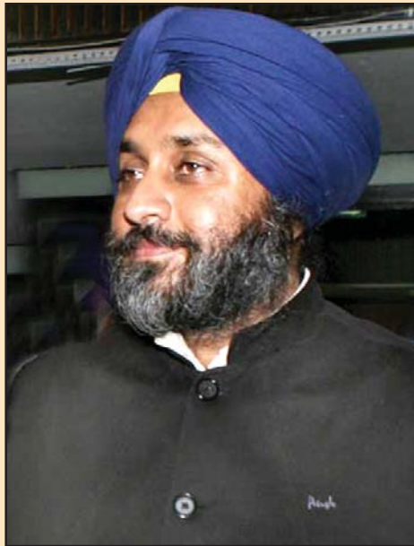
ਸ. ਸੁਖਬੀਰ ਸਿੰਘ ਬਾਦਲ ਉਪ ਮੁਖ ਮੰਤਰੀ, ਪੰਜਾਬ