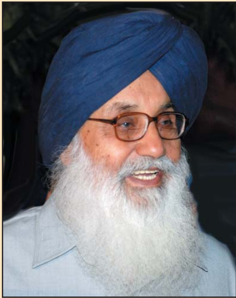
ਸ. ਪ੍ਰਕਾਸ਼ ਸਿੰਘ ਬਾਦਲ ਮੁਖ ਮੰਤਰੀ, ਪੰਜਾਬ