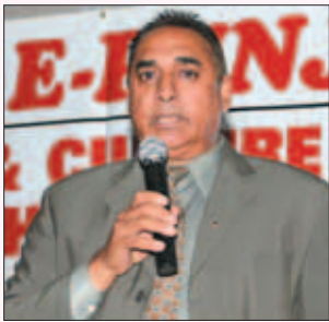
ਕਲੱਬ ਦੇ ਅਹੁਦੇਦਾਰ ਅਤੇ ਮੈਂਬਰ