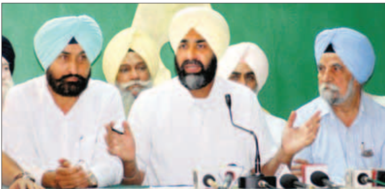
ਸ. ਮਨਪ੍ਰੀਤ ਸਿੰਘ ਬਾਦਲ ਪੀ.ਪੀ.ਪੀ. ਦੇ ਜਥੇਬੰਦਕ ਢਾਂਚੇ ਦਾ ਐਲਾਨ ਕਰਦੇ ਹੋਏ

ਚੰਡੀਗੜ੍ਹ (ਪੰਜਾਬ ਟਾਈਮਜ਼ ਬਿਊਰੋ): ਪੀਪਲਜ਼ ਪਾਰਟੀ ਆਫ ਪੰਜਾਬ, ਸ਼੍ਰੋਮਣੀ ਅਕਾਲੀ ਦਲ (ਲੌਗੋਵਾਲ), ਸੀ.ਪੀ.ਐਮ ਅਤੇ ਸੀ.ਪੀ.ਆਈ. ਵੱਲੋਂ ਆਉਂਦੀਆਂ ਪੰਜਾਬ ਵਿਧਾਨ ਸਭਾ ਚੋਣਾਂ ਲਈ ਸਾਂਝਾ ਮੋਰਚਾ ਕਾਇਮ ਕੀਤੇ ਜਾਣ ਕਰਕੇ ਪੰਜਾਬ ਵਿਚ ਸ਼੍ਰੋਮਣੀ ਗੁਰਦੁਆਰਾ ਪ੍ਰਬੰਧਕ ਕਮੇਟੀ ਚੋਣਾਂ ਤੋਂ ਬਾਅਦ ਸ਼ਾਂਤ ਹੋਇਆ ਸਿਆਸੀ ਮਾਹੌਲ ਇਕ ਵਾਰ ਫਿਰ ਭਖ ਗਿਆ ਹੈ। ਚੋਣਾਂ 'ਚ ਅਜੇ ਤਕਰੀਬਨ ਚਾਰ ਮਹੀਨੇ ਪਏ ਹਨ ਤੇ ਇਸ ਸਮੇਂ ਦੌਰਾਨ ਹੋਰ ਪਾਰਟੀਆਂ ਵੀ ਇਸ ਮੋਰਚੇ 'ਚ ਸ਼ਾਮਲ ਹੋ ਸਕਦੀਆਂ ਹਨ ਜਿਸ ਨਾਲ ਸੱਤਾਧਾਰੀ ਸ਼੍ਰੋਮਣੀ ਅਕਾਲੀ ਦਲ (ਬ) ਅਤੇ ਕਾਂਗਰਸ ਨੂੰ ਚੋਣਾਂ ਦੇ ਪਿੜ ਵਿਚ ਨਵੀਂ ਵੰਗਾਰ ਮਿਲ ਸਕਦੀ ਹੈ।