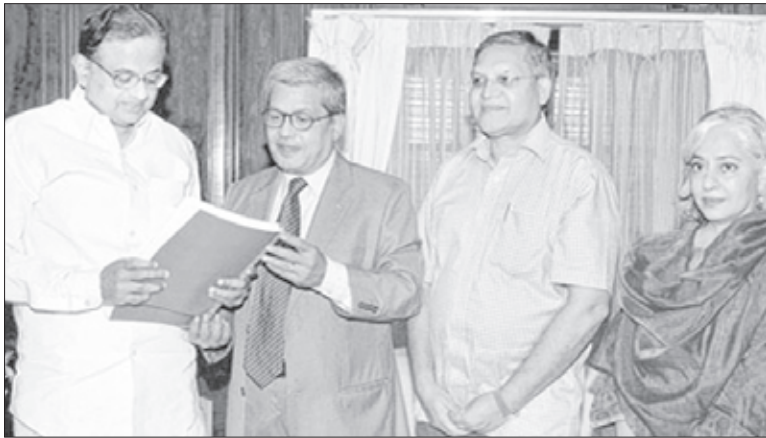
ਗ੍ਰਹਿ ਮੰਤਰੀ ਪੀ. ਚਿਦੰਬਰਮ ਨੂੰ ਰਿਪੋਰਟ ਸੌਂਪਦੇ ਹੋਏ ਮੁੱਖ ਵਾਰਤਾਕਾਰ।