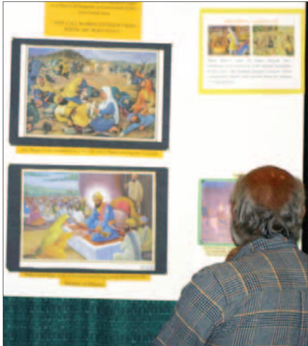
ਇਕ ਦਰਸ਼ਕ ਪ੍ਰਦਰਸ਼ਨੀ ਵੇਖਦੇ ਹੋਇਆ

ਸਮਾਰੋਹ ਕੀਤਾ ਗਿਆ ਜਿਸ ਵਿਚ ਸਿੱਖ ਧਰਮ ਦੇ ਵਖ ਵਖ ਪਹਿਲੂਆਂ ਬਾਰੇ ਚਾਨਣਾ ਪਾਇਆ ਗਿਆ। ਨਜ਼ਦੀਕੀ ਸ਼ਹਿਰ ਟਰਾਏ ਵਿਚ ਹਵਾਈ ਜਹਾਜ਼ਾਂ ਦੇ ਪੁਰਜੇ ਬਣਾਉਣ ਵਾਲੀ ਕੰਪਨੀ