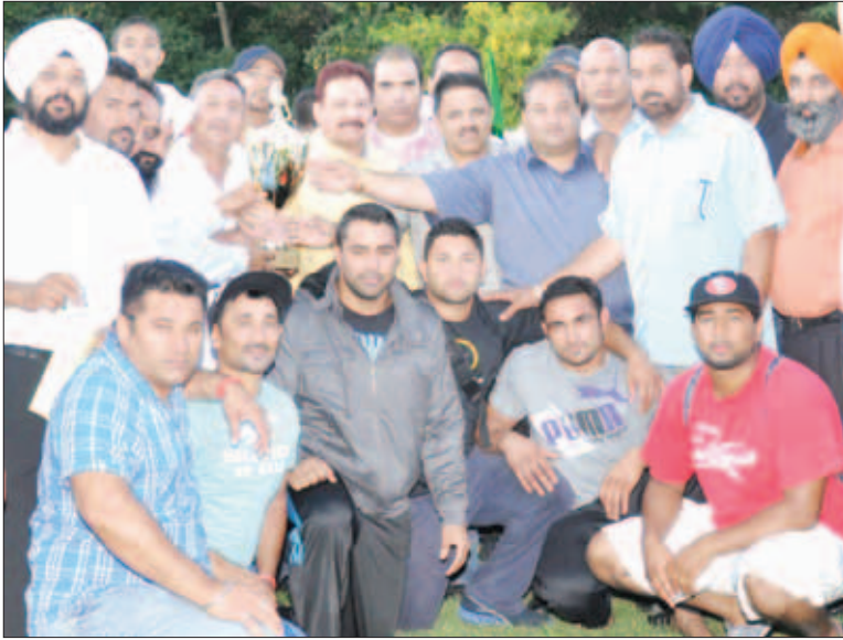
ਓਪਨ ਕਬੱਡੀ ਵਿਚ ਦੂਜੇ ਥਾਂ ਆਈ ਯੂ ਐਸ ਏ ਕਬੱਡੀ ਫੈਡਰੇਸ਼ਨ ਦੀ ਟੀਮ