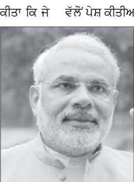
ਮੁੱਖ ਮੰਤਰੀ ਨਰਿੰਦਰ ਮੋਦੀ