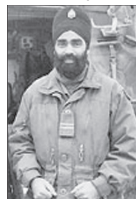
ਕਰਨਲ ਹਰਜੀਤ ਸਿੰਘ ਸੱਜਣ

ਫੌਜੀ ਵਜੋਂ ਭਰਤੀ ਹੋਏ ਹਰਜੀਤ ਸਿੰਘ ਸੱਜਣ ਨੇ ਦੋ ਸਾਲ ਪਿੱਛੋਂ 1991 'ਚ ਬ੍ਰਿਟਿਸ਼ ਕੋਲੰਬੀਆ ਰੈਜੀਮੈਂਟ ਵਿਚ ਕਮਿਸ਼ਨ ਹਾਸਲ ਕੀਤਾ। ਚਾਰ