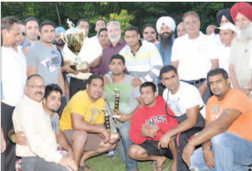
ਸ਼੍ਰੋਮਣੀ ਪੰਜਾਬ ਸਪੋਰਟਸ ਕਲੱਬ ਸ਼ਿਕਾਗੋ ਦੇ ਕਬੱਡੀ ਕੱਪ ਦੀ ਜੇਤੂ ਸਿਨਿਸਿਨੈਟੀ ਦੀ ਟੀਮ (ਖਬਰਾ ਸਫਾ 16 'ਤੇ)