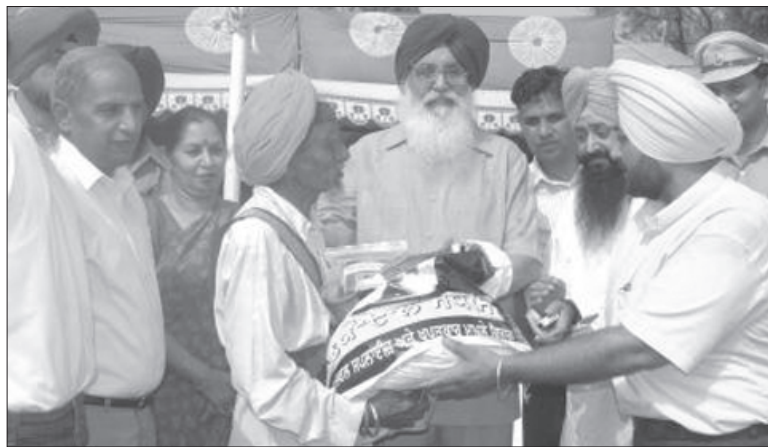
ਹਜ਼ਾਰ ਲਾਭ ਪਾਤਰੀ ਪਰਿਵਾਰਾਂ ਦੇ ਸ਼ਾਮਲ ਹੋਣ ਨਾਲ ਸਾਢੇ 17 ਲੱਖ ਤੋਂ ਵਧ ਜਾਵੇਗਾ। ਸਰਕਾਰ ਭਾਅ ਚਾਰ ਰੁਪਏ ਪ੍ਰਤੀ ਕਿੱਲੋ ਆਟਾ ਤੇ 20 ਰੁਪਏ ਪ੍ਰਤੀ ਕਿੱਲੋ ਦਾਲ ਹੈ।

ਵੱਲੋਂ ਇਸ ਯੋਜਨਾ ਤਹਿਤ ਲੋਕਾਂ ਨੂੰ ਇਸ ਸਮੇਂ 400 ਕਰੋੜ ਦੇ ਕਰੀਬ ਸਾਲਾਨਾ ਸਬਸਿਡੀ 'ਤੇ ਆਟਾ ਤੇ ਦਾਲ ਦਿੱਤੇ ਜਾ ਰਹੇ ਹਨ। ਸਰਕਾਰੀ