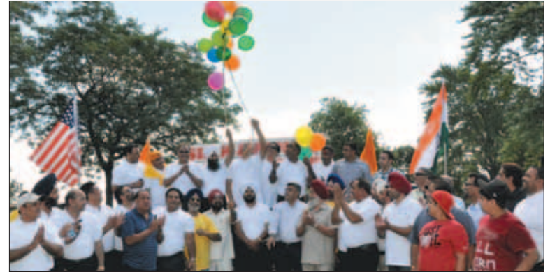
ਉਦਘਾਟਨੀ ਰਸਮ ਸਮੇਂ ਕਲੱਬ ਦੇ ਅਹੁਦੇਦਾਰ ਅਤੇ ਹੋਰ ਮਹਿਮਾਨ