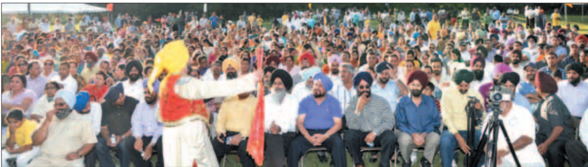
ਇਕ ਕਲਾਕਾਰ ਸਰੋਤਿਆਂ ਦਾ ਮਨੋਰੰਜਨ ਕਰਨ ਲਈ ਤਿਆਰੀ ਕਸਦਾ ਹੋਇਆ

ਕਈ ਦਿਨਾਂ ਤੋਂ ਸ਼ਿਕਾਗੋ ਇਲਾਕੇ ਵਿਚ ਕਾਫੀ ਗਰਮੀ ਚੱਲ ਰਹੀ ਸੀ ਜਿਸ ਕਰਕੇ ਪ੍ਰਬੰਧਕਾਂ ਦੇ ਚਿਹਰੇ 'ਤੇ ਚਿੰਤਾ ਦੀ ਸ਼ਿਕਨ ਸੀ ਕਿ ਪਤਾ ਨਹੀਂ ਮੇਲੇ ਵਾਲੇ ਦਿਨ ਮੌਸਮ ਕੈਸਾ ਰਹੇ ਪਰ ਦਿਨ ਪੂਰੀ ਤਰ੍ਹਾਂ ਨਿਖਰਿਆ ਹੋਇਆ ਸੀ ਤੇ ਮੌਸਮ ਸੁਖਾਵਾਂ ਸੀ। ਮੇਲੇ ਵਾਲੀ ਪਾਰਕ ਐਲਕ ਗਰੂਵ ਵਿਲੇਜ ਦੇ ਫਾਰੈਸਟ ਪ੍ਰਿਜ਼ਰਵ ਵਿਚ ਪ੍ਰਬੰਧਕ ਸਫੈਦ ਸ਼ਰਟਾਂ ਤੇ ਕਾਲੀਆਂ ਪੈਂਟਾਂ ਪਾਈ ਡਿਊਟੀਆਂ 'ਤੇ ਤਾਇਨਾਤ ਸਨ। ਸਫੈਦ ਰੰਗ ਦੇ ਟੈਂਟ ਲਿਸ਼ਕ ਰਹੇ ਤੇ ਰੰਗ ਬਰੰਗੇ ਝੰਡੇ ਝੁਲ ਰਹੇ ਸਨ। ਅਮਰੀਕਾ ਨਾਲ ਭਾਰਤ ਦਾ ਝੰਡਾ ਵੀ ਹੁਲਾਰੇ ਖਾ ਰਿਹਾ ਸੀ। ਹਰੇ ਘਾਹ ਉਤੇ ਕਬੱਡੀ ਦਾ ਸਫੈਦ ਦਾਇਰਾ ਉਲੀਕਿਆ ਹੋਇਆ ਸੀ ਜਿਸ ਦੁਆਲੇ ਪੀਲੀਆਂ ਪੱਟੀਆਂ ਦੀ ਵਾੜ ਕੀਤੀ ਹੋਈ ਸੀ।