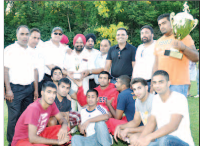
ਮਿਡਵੈਸਟ ਕੱਪ ਲਈ ਦੂਜੇ ਨੰਬਰ 'ਤੇ ਆਈ ਸਿਨਸਿਨੈਟੀ ਦੀ ਟੀਮ

ਕਬੱਡੀ ਮੈਚ ਦੇਖਣ ਲਈ ਦਰਸ਼ਕ ਨਾ ਸਿਰਫ ਇਲੀਨਾਏ ਦੇ ਵੱਖ ਵੱਖ ਹਿੱਸਿਆਂ ਤੋਂ ਹੀ