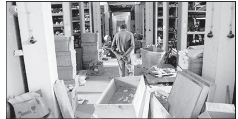
2003 ਵਿਚ ਅਮਰੀਕੀ ਕਬਜ਼ੇ ਤੋਂ ਬਾਅਦ ਬਗ਼ਦਾਦ ਵਿਚ ਲੁੱਟੇ ਗਏ ਅਜਾਇਬ ਘਰ ਦਾ ਦ੍ਰਿਸ਼।

ਪੇਸ਼ ਕੀਤੀ ਹਮਲਿਆਂ ਦੀ ਵਿਆਖਿਆ ਨੂੰ ਮੰਨ ਲਿਆ ਜਾਵੇ ਤਾਂ ਵੀ ਉਸ ਦੀਆਂ ਕਾਰਵਾਈਆਂ ਸਵਾਲਾਂ ਦੇ ਘੇਰੇ ਵਿਚ ਹਨ। ਉਸ ਦੇ ਦਾਅਵਿਆਂ ਅਤੇ ਮਨਸ਼ਿਆਂ ਵਿਚ ਬਹੁਤ ਪਾੜਾ ਹੈ। ਆਪਣੇ ਨਾਗਰਿਕਾਂ ਨੂੰ ਇਨਸਾਫ਼ ਦੇਣ ਲਈ ਅਫ਼ਗ਼ਾਨਿਸਤਾਨ ਅਤੇ ਇਰਾਕ ਵਿਚ ਹਮਲੇ ਕਰਨ ਵਾਲਾ ਪੀੜਤਾਂ ਨਾਲ ਕੀ ਵਿਹਾਰ ਕਰਦਾ ਹੈ? ਗਿਆਰਾਂ ਸਤੰਬਰ ਦੇ ਹਮਲੇ ਤੋਂ ਬਾਅਦ ਬਹੁਤ ਸਾਰੇ ਲੋਕਾਂ ਨੇ ਰਾਹਤ ਕਾਰਜਾਂ ਵਿਚ ਹਿੱਸਾ ਪਾਇਆ। ਇਨ੍ਹਾਂ ਵਿਚੋਂ ਜ਼ਿਆਦਾਤਰ ਲੋਕ ਸਾਹ ਦੀਆਂ ਘਾਤਕ ਬਿਮਾਰੀਆਂ ਦਾ ਸ਼ਿਕਾਰ ਹੋ ਗਏ। ਅਮਰੀਕਾ ਵਿਚ ਇਨ੍ਹਾਂ ਲੋਕਾਂ ਨੂੰ ਬੀਮਾ ਨਾ ਹੋਣ ਦੀ ਹਾਲਤ ਵਿਚ ਮਰਨ ਦੀ ਆਜ਼ਾਦੀ ਹੈ। ਮਾਈਕਲ ਮੂਰ ਦੀ ਦਸਤਾਵੇਜ਼ੀ ਫ਼ਿਲਮ 'ਸੀਕੋ' ਅਜਿਹੇ