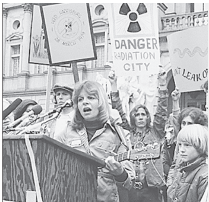
ਹੈਰਿਸਬਰਗ (ਅਮਰੀਕਾ) ਵਿਚ 1979 ਚ ਥ੍ਰੀ ਮਾਈਲ ਆਈਲੈਂਡ ਦੇ ਪਰਮਾਣੂ ਹਾਦਸੇ ਤੋਂ ਬਾਅਦ ਕੀਤੇ ਵਿਖਾਵੇ ਦਾ ਦ੍ਰਿਸ਼।

ਤਿੰਨ ਮੀਲ ਟਾਪੂ (ਥ੍ਰੀ ਮਾਈਲ ਆਈਲੈਂਡ) ਦੇ ਪਰਮਾਣੂ ਹਾਦਸੇ (ਸੰਨ 1979) ਤੋਂ ਬਾਅਦ ਅਮਰੀਕਾ ਦੀ ਵਾਲਸਟ੍ਰੀਟ ਨੇ ਪਰਮਾਣੂ ਸਨਅਤ 'ਤੇ ਰੋਕ ਲਾ ਦਿੱਤੀ। ਪਿਛਲੇ 25 ਸਾਲਾਂ ਤੋਂ ਯੂਰਪ ਨੇ ਕੋਈ ਨਵਾਂ ਪਰਮਾਣੂ ਰਿਐਕਟਰ ਨਹੀਂ ਬਣਾਇਆ। ਪੱਛਮੀ ਮੁਲਕ ਨਾਕਾਮਯਾਬ ਤਬਾਹਕਾਰੀ ਸਨਅਤ ਨੂੰ ਕੂੜੇ ਦੇ ਡੱਬੇ ਵਿਚ ਸੁੱਟ ਚੁੱਕੇ ਹਨ।...ਹੁਣ ਹਿੰਦ-ਅਮਰੀਕਾ ਪਰਮਾਣੂ ਸੰਧੀ ਸਦਕਾ ਅਗਲੇ ਪੰਜ ਸਾਲਾਂ ਵਿਚ ਹਰਿਆਣੇ ਵਿਚ ਚਾਰ ਪਰਮਾਣੂ ਪਲਾਂਟ ਲਾਏ ਜਾ ਰਹੇ ਹਨ। ਉਪਰੋਂ ਪੰਜਾਬ ਸਰਕਾਰ ਵਲੋਂ ਦਿਖਾਈ ਜਾ ਰਹੀ ਦਿਲਚਸਪੀ ਸੰਘਣੀ ਆਬਾਦੀ ਵਾਲੇ ਦੇਵਾਂ ਸੂਬਿਆਂ ਲਈ ਖ਼ਤਰੇ ਦੀ ਘੰਟੀ ਸਿੱਧ ਹੋ ਸਕਦੀ ਹੈ। ਇਕ ਭੁਲੇਖਾ ਸਸਤੀ ਬਿਜਲੀ ਦਾ ਪਾਇਆ ਜਾਂਦਾ ਹੈ।