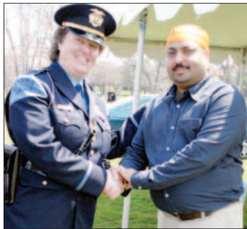
ਅੰਮ੍ਰਿਤ ਛਕਣ ਦਾ ਕੋਤਕ ਸੰਗਤਾਂ ਨੂੰ ਚੋਤੇ ਕਰਵਾ ਰਿਹਾ ਸੀ।

ਰਿਵਰ ਫਰੰਟ ਪਲਾਜ਼ਾ ਵਿਚ ਸੰਗਤਾਂ ਸਵੇਰੇ 9 ਵਜੇ ਤੋਂ ਹੀ ਇਕੱਤਰ ਹੋਣੀਆਂ ਸ਼ੁਰੂ ਹੋ ਗਈਆਂ ਸਨ। ਪਿਛਲੇ ਕਈ ਦਿਨਾਂ ਤੋਂ ਮੀਂਹ ਕਣੀ ਦਾ ਮੌਸਮ ਰਿਹਾ ਹੋਣ ਦੇ ਬਾਵਜੂਦ ਇਸ ਦਿਹਾੜੇ