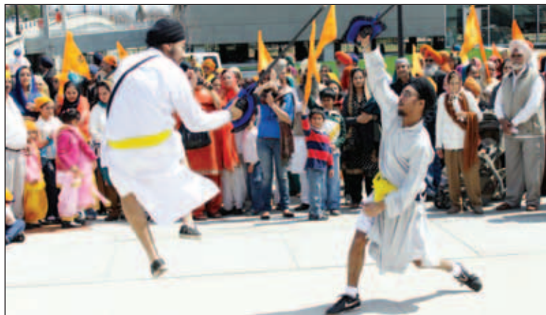
ਉਚਾਰਿਆ ਜਾ ਰਿਹਾ ਸੀ, 'ਵਾਹ ਵਾਹ ਗੁਰੂ ਗੋਬਿੰਦ ਸਿੰਘ ਆਪੇ ਗੁਰ ਚੇਲਾ' ਜੋ ਦਸਮ ਪਾਤਸ਼ਾਹ ਵਲੋਂ ਖਾਲਸਾ ਸਾਜ ਕੇ ਪੰਜ ਪਿਆਰਿਆਂ ਨੂੰ ਅੰਮ੍ਰਿਤ ਛਕਾਉਣ ਅਤੇ ਫਿਰ ਉਨ੍ਹਾਂ ਤੋਂ ਆਪ

ਇਸ ਮੌਕੇ ਵਖ ਵਖ ਤਰ੍ਹਾਂ ਦੀ ਖਰੀਦਦਾਰੀ ਦੇ ਸਟਾਲ ਵੀ ਲਗੇ ਹੋਏ ਸਨ। ਇਕ ਪੰਜਾਬੀ ਸੰਸਥਾ ਵਲੋਂ ਪੰਜਾਬੀ ਬਚਾਓ, ਪੰਜਾਬੀ ਬੋਲੇ ਦੇ ਸਲੋਗਨਾਂ ਵਾਲੇ ਬੈਨਰ ਲਾਏ ਗਏ ਸਨ ਜਿਥੋਂ ਮੁਫਤ ਪੁਸਤਕਾਂ ਅਤੇ ਟੀ-ਸ਼ਰਟਾਂ ਵੰਡੀਆਂ ਜਾ ਰਹੀਆਂ ਸਨ। ਨਗਰ ਕੀਰਤਨ ਅਤੇ ਸਭਿਆਚਾਰਕ ਮੇਲੇ ਨੂੰ ਸੁਪਾਂਸਰ ਕਰਨ ਵਾਲਿਆਂ ਵਿਚ ਗਰਿਲ ਆਫ ਇੰਡੀਆ, ਏਸ਼ੀਅਨ ਇੰਟਰਨੈਸ਼ਨਲ ਫੂਡਜ਼, ਇੰਡੀਅਨ ਗਰੋਸਰੀ ਸਟੋਰ, ਅਜੇ ਬਧਵਰ ਟੈਕਸ ਸਰਵਿਸ, ਵਰਲਡਵਾਈਡ ਟਰੈਵਲ ਅਤੇ ਸਿਆਨ ਵੀਡੀਓ ਸ਼ਾਮਲ ਸਨ। ਗੁਰੂ ਮਹਾਰਾਜ ਦੀ ਫਲੋਟ ਸਜਾਉਣ ਅਤੇ ਸਾਊਂਡ ਸਿਸਟਮ ਦੀ ਸੇਵਾ ਬੰਬੇ ਵੈਡਿੰਗ ਇਵੈਂਟਸ ਵਲੋਂ ਕੀਤੀ ਗਈ। ਇਸ ਸਮੁੱਚੇ ਪ੍ਰੋਗਰਾਮ ਨੂੰ ਕਾਮਯਾਬ ਕਰਨ ਵਿਚ ਲੈਨਸਿੰਗ