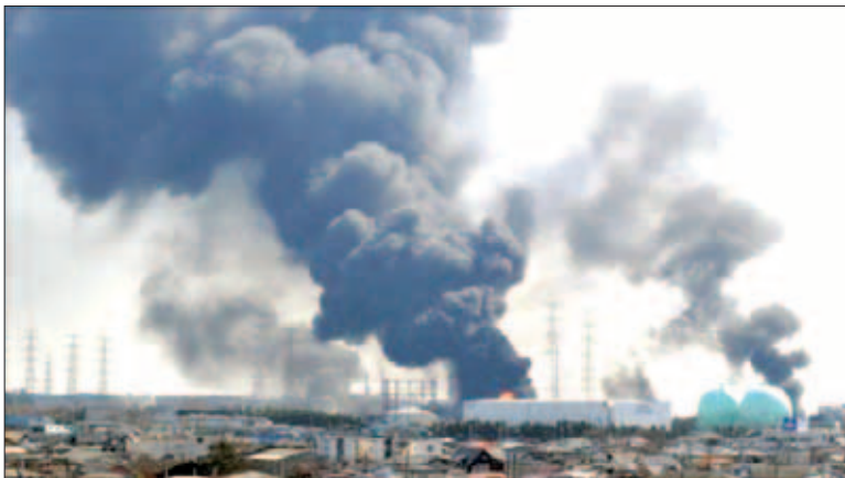
ਜਪਾਨ ਵਿਚ ਸੁਨਾਮੀ ਦੀ ਲਪੇਟ ਵਿਚ ਆਇਆ ਪਰਮਾਣੂ ਰਿਐਕਟਰ

—ਅਸੀਂ ਪਹਿਲਾਂ ਹੀ ਰੇਡੀਓਐਕਟਿਵ ਪਦਾਰਥਾਂ ਦੀ ਭਾਰੀ ਖੋਪ ਜਮ੍ਹਾਂ ਕਰ ਚੁੱਕੇ ਹਾਂ। ਇਸ ਲਈ ਜੇ ਕੋਈ ਚਮਤਕਾਰ ਹੋ ਜਾਵੇ ਅਤੇ ਅਸੀਂ ਹੋਰ ਬੰਬ ਜਾਂ ਪਰਮਾਣੂ ਉਰਜਾ ਨਾ ਬਣਾਈਏ, ਫਿਰ ਵੀ ਪਹਿਲਾਂ ਹੀ ਬਹੁਤ ਨੁਕਸਾਨ ਹੋ ਚੁੱਕਿਆ ਹੈ। ਜੇ ਰੇਡੀਓਐਕਟਿਵ ਪਦਾਰਥ ਅਸੀਂ ਬਣਾ ਚੁੱਕੇ ਹਾਂ, ਇਸ ਤੋਂ ਪਿੱਛਾ ਫੁਡਾਉਣਾ ਅਸੰਭਵ ਹੈ ਅਤੇ ਇਹ ਕਰੋੜਾਂ ਸਾਲਾਂ ਤੱਕ ਧਰਤੀ ਨੂੰ ਪ੍ਰਦੂਸ਼ਿਤ ਕਰਦਾ ਰਹੇਗਾ। ਹੁਣ ਤਾਂ ਅਸੀਂ ਸਿਰਫ ਇੰਨਾ ਹੀ ਕਰ ਸਕਦੇ ਹਾਂ ਕਿ ਹੋਰ ਬਣਾਉਣ ਤੋਂ ਤੌਬਾ ਕਰ ਲਈਏ।