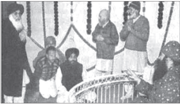
ਪ੍ਰਕਾਸ਼ ਸਿੰਘ ਬਾਦਲ ਤੇ ਸੁਖਬੀਰ ਬਾਦਲ ਸਿਰਸਾ ਡੇਰਾ 'ਚ ਹਾਜ਼ਰੀ ਭਰਦੇ ਹੋਏ। (ਫਾਈਲ ਫੋਟੋ)

ਡੇਰਾ ਸਿਰਸਾ ਦੇ ਸੂਤਰਾਂ ਅਨੁਸਾਰ ਚੋਣਾਂ ਦੌਰਾਨ ਕਾਂਗਰਸ, ਸ਼੍ਰੋਮਣੀ ਅਕਾਲੀ ਦਲ ਤੇ ਪੰਜਾਬ ਪੀਪਲਜ਼ ਪਾਰਟੀ ਦੇ ਉਮੀਦਵਾਰਾਂ ਨੂੰ ਧਿਆਨ 'ਚ ਰੱਖ ਕੇ ਹਮਾਇਤ ਕੀਤੀ ਜਾਵੇਗੀ। ਡੇਰਾ ਸਿਰਸਾ ਦੇ ਰਾਜਨੀਤਕ ਵਿੰਗ ਵੱਲੋਂ ਪਿਛਲੇ ਕੁਝ ਦਿਨਾਂ ਤੋਂ