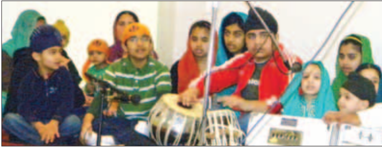
ਬੱਚੇ ਵਾਤਾਵਰਣ ਸਬੰਧੀ ਸ਼ਬਦ ਕੀਰਤਨ ਕਰਦੇ ਹੋਏ