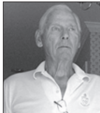
ਲਿਆਉਣ ਲਈ ਸੀ.ਬੀ.ਆਈ. ਨੂੰ ਹਰੀ ਝੰਡੀ ਦੇ ਦਿੱਤੀ ਹੈ।