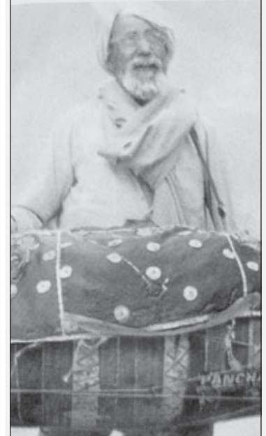
ਪੰਜਾਬੀ ਅਖੌਤ ਹੈ ਕਿ 'ਢੋਲ ਸਾਵਾਂ ਤੇ ਭਰਿਆਈ ਵਣਵਾਂ' ਭਾਵ ਜਦੋਂ ਕਿਸੇ ਕਸਬ ਨੂੰ ਕਰਨ ਵਾਲਾ ਤਾਂ ਬਦਲ ਜਾਵੇ ਪਰ ਕਸਬ ਉਹੀ ਰਹੇ। ਪਰ ਬੀਰੂ ਭਰਿਆਈ 'ਤੇ ਇਹ ਅਖੌਤ ਲਾਗੂ

ਜਿਤਨੇ 'ਬਿੰਗ ਸਿਟੀ' ਵਿਚ ਹੋਟਲ, ਨੰਗੇ ਨਾਚ ਨਚਾਉਂਦੇ ਟੋਟਲ। ਜਿੰਨੇ ਧਨਾਢ ਅਮੀਰ ਵਪਾਰੀ ਸਭ ਦੀ ਮੱਤ ਕਾਮ ਨੇ ਮਾਰੀ। ਡਿਊਟੀ ਭੁੱਲ ਗਏ ਸਭ ਅਧਿਕਾਰੀ, ਸਭ ਦੀ ਮੱਤ ਪੈਸੇ ਨੇ ਮਾਰੀ। ਸਭ ਦੀ ਇੱਕੋ ਟੋਪੀ ਸੇਲੀ, ਐਮ.ਪੀ. ਐਮ.ਐਲ.ਏ. ਦੇ ਬੇਲੀ। ਰਹਿੰਦੇ ਉਹਦੇ ਪੱਖ ਦੇ ਐ। ਪੈਸੇ ਲਏ ਬਗੈਰ ਨਾ ਚਪੜਾਸੀ ਰੱਖਦੇ ਐ! ਆਈ.ਏ.ਐਸ. ਰੈਂਕ ਦੇ ਅਹੁਦੇ ਲਾਉਂਦੇ ਪੈਸਿਆਂ ਵਾਲੇ ਸੋਦੇ। ਹੋਵੇ ਕਿੰਨਾ ਵਕੀਲ 'ਕਲੈਵਰ' ਮਾਇਆ ਬਾਝ ਬਣੁ ਕੰਮ 'ਨੈਵਰ' ਨਾ ਕੋਈ ਪੁੱਛ ਕੁਰਬਾਨੀ ਦੀ। ਆ ਗਏ ਦਿਨ ਕਲਿਯੁਗ ਦੇ ਮਾੜੇ...! 'ਜਥਾ ਰਾਜਾ ਤਬਾ ਪਰਜਾ' ਦੇ ਅਖਾਣ ਮੁਤਾਬਕ ਉਤਲਿਆਂ ਦੀ ਦੇਖਾ-ਦੇਖੀ ਵਿਗੜੇ ਤਿਗੜੇ ਸਮਾਜ ਵਿਚ ਜੋ ਕੜੀ ਘੁਲ ਰਹੀ ਹੈ, ਉਸਦਾ ਰੰਗ ਦੇਖੋ: ਰਲੇ ਨਾ ਨਾਹ ਪਤੀ ਦੀ ਮਰਜੀ, ਜੰਮ ਕੇ ਗਏ ਔਲਾਦਾਂ ਧਰ ਜੀ। ਮਾਂ ਪੁਤ ਵਿਚ ਕਚਹਿਰੀ ਝਗੜਨ,