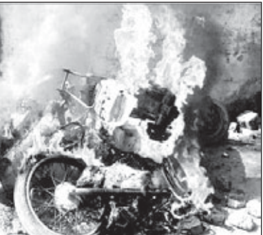
ਬਟਾਲਾ 'ਚ ਹੋਈ ਸਾੜਫੂਕ ਦਾ ਦ੍ਰਿਸ਼।

ਕਾਰਵਾਈ ਦੀ ਮੰਗ ਕੀਤੀ ਅਤੇ ਬਟਾਲਾ ਵਿਖੇ ਰੋਸ ਮਾਰਚ ਕਰਨ ਦਾ ਐਲਾਨ ਵੀ ਕੀਤਾ। ਹਿੰਦੂ ਸੰਗਠਨਾਂ ਵਲੋਂ ਸਖਤ ਰੁੱਖ ਅਖਤਿਆਰ ਕਰਨ