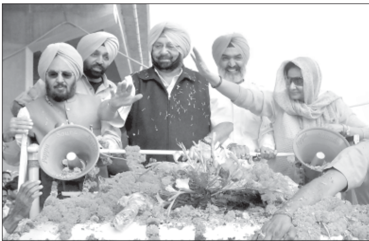
ਕੈਪਟਨ ਅਮਰਿੰਦਰ ਸਿੰਘ ਤੇ ਉਨ੍ਹਾਂ ਦੀ ਪਤਨੀ ਮਹਾਰਾਣੀ ਪ੍ਰੀਤ ਕੌਰ ਖੱਲੀ ਜੀਪ ਵਿੱਚ ਲੋਕਾਂ ਦਾ ਪਿਆਰ ਕਬੂਲਦੇ ਹੋਏ।

ਇਕ ਖੁੱਲ੍ਹੀ ਗੱਡੀ ਵਿੱਚ ਇਥੇ ਪੁੱਜੇ ਕੈਪਟਨ ਦੇ ਨਾਲ ਉਨ੍ਹਾਂ ਦੀ ਪਤਨੀ ਕੇਂਦਰੀ ਵਿਦੇਸ਼ ਮੰਤਰੀ