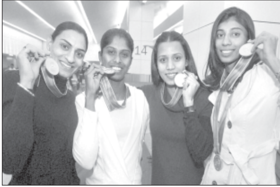
ਤਮਗੇ ਵਿਖਾਉਂਦੀਆਂ ਹੋਈਆਂ ਭਾਰਤੀ ਖਿਡਾਰੀਆਂ।