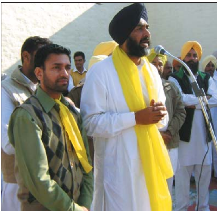
ਮਨਪ੍ਰੀਤ ਸਿੰਘ ਬਾਦਲ ਮੁਕਤਸਰ ਨੇੜੇ ਪਿੰਡ ਬਰਕੰਦੀ 'ਚ ਲੋਕਾਂ ਨੂੰ ਸੰਬੋਧਨ ਕਰਦੇ ਹੋਏ