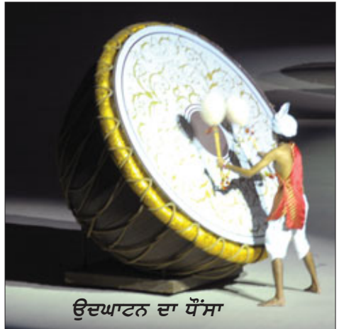
ਉਦਘਾਟਨ ਦਾ ਧੌਂਸਾ

ਨਵੀਂ ਦਿੱਲੀ: ਇਥੋਂ ਦੇ ਜਵਾਹਰ ਲਾਲ ਨਹਿਰੂ ਸਟੇਡੀਅਮ ਵਿਚ ਐਤਵਾਰ 19ਵੀਆਂ ਰਾਸ਼ਟਰਮੰਡਲ ਖੇਡਾਂ ਰੰਗਾਰੰਗ ਉਦਘਾਟਨੀ ਸਮਾਰੋਹ ਨਾਲ ਸ਼ੁਰੂ ਹੋ ਗਈਆਂ। ਇਕੱਤਰ ਰਾਸ਼ਟਰਮੰਡਲ ਮੁਲਕਾਂ ਦੇ ਸੱਤ ਹਜ਼ਾਰ ਖਿਡਾਰੀਆਂ ਦੀ ਸ਼ਮੂਲੀਅਤ ਵਾਲੀਆਂ ਖੇਡਾਂ ਦੀ ਮੇਜ਼ਬਾਨੀ ਨਾਲ ਭਾਰਤੀ ਖੇਡ ਇਤਿਹਾਸ ਵਿਚ ਸੁਨਹਿਰੀ ਪੰਨਾ ਜੁੜ ਗਿਆ। 1951 ਤੋਂ