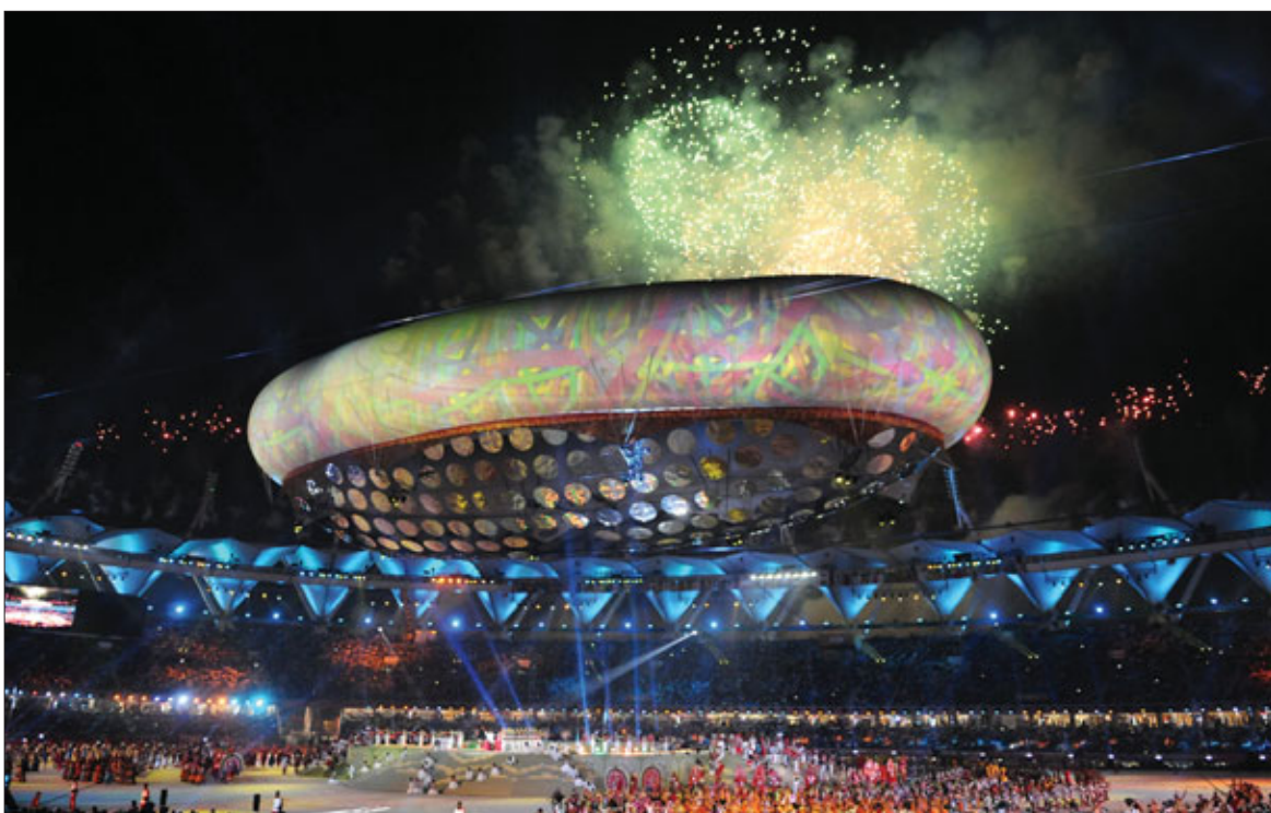
ਕਾਮਨਵੈਲਥ ਖੇਡਾਂ ਦੀ ਉਦਘਾਟਨੀ ਰਸਮ ਸਮੇਂ ਸਜੇ ਹੋਏ ਨਹਿਰੂ ਸਟੇਡੀਅਮ ਵਿਚ ਮਾਰਚ ਪਾਸਟ ਵਿਚ ਸ਼ਾਮਲ ਕਲਾਕਾਰ