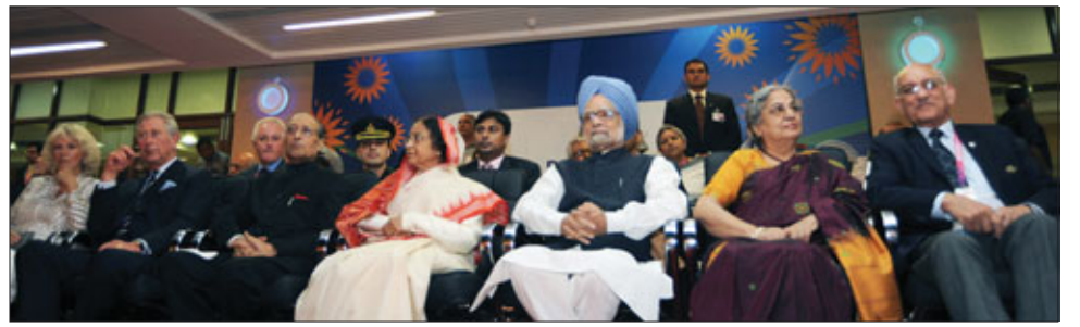
ਪ੍ਰਧਾਨ ਮੰਤਰੀ ਡਾ. ਮਨਮੋਹਨ ਸਿੰਘ ਪ੍ਰਿੰਸ ਚਾਰਲਸ ਅਤੇ ਹੋਰ ਮਹਿਮਾਨ ਉਦਘਾਟਨੀ ਸਮਾਗਮ ਮੌਕੇ

ਸਰਵੋਤਮ ਖਿਡਾਰੀ ਨਿਸ਼ਾਨੇਬਾਜ਼ ਸਮਰੇਸ਼ ਜੰਗ ਹਵਾਲੇ ਕੀਤਾ ਅਤੇ ਅੰਤ ਵਿਚ ਬੈਟਨ ਨੂੰ ਸਾਂਭਦਿਆਂ ਕੁਸ਼ਤੀ ਦੇ ਵਿਸ਼ਵ ਚੈਂਪੀਅਨ ਅਤੇ ਓਲੰਪਿਕ ਤਮਗਾ ਜੇਤੂ ਸੁਸ਼ੀਲ ਕੁਮਾਰ ਨੇ