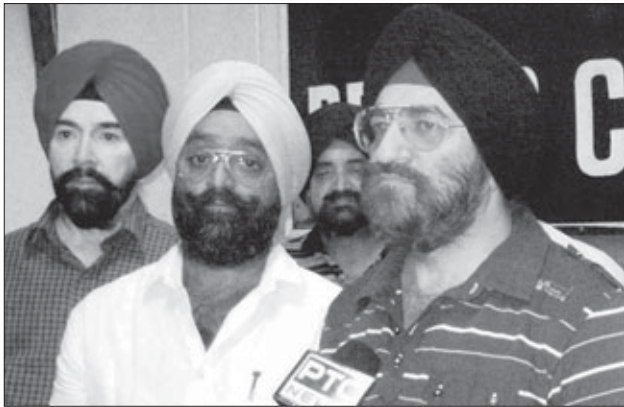
ਜੰਮੂ 'ਚ ਪੱਤਰਕਾਰਾਂ ਨਾਲ ਗੱਲ ਕਰਦੇ ਹੋਏ ਸਿੱਖ ਜਥੇਬੰਦੀਆਂ ਦੇ ਆਗੂ

ਕਸ਼ਮੀਰੀ ਹਿੰਦੂ ਫਿਰਕੇ ਦੇ ਲੋਕਾਂ ਨੂੰ ਮਿਲਦੀਆਂ ਸਨ ਪਰ ਉਨ੍ਹਾਂ ਦੀ ਰੱਖਿਆ ਕਰਨ ਵਿਚ ਸਰਕਾਰ ਅਸਫਲ ਰਹੀ ਹੈ। ਇਸ ਦੇ ਜਵਾਬ 'ਚ ਸ੍ਰੀ ਚਿਦੰਬਰਮ ਨੇ ਕਿਹਾ ਕਿ ਜੰਮੂ-ਕਸ਼ਮੀਰ ਦੇ ਮੁੱਖ ਮੰਤਰੀ ਨੇ ਉਨ੍ਹਾਂ ਨੂੰ ਭਰੋਸਾ ਦਿਵਾਇਆ ਹੈ ਕਿ ਸਿੱਖਾਂ ਦੇ ਅਧਿਕਾਰਾਂ ਦੀ ਰਾਖੀ ਕੀਤੀ ਜਾਵੇਗੀ ਅਤੇ ਉਨ੍ਹਾਂ ਨੂੰ ਕੋਈ ਨੁਕਸਾਨ ਨਹੀਂ ਪਹੁੰਚਣ ਦਿੱਤਾ ਜਾਵੇਗਾ।