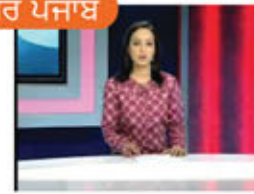
ਖਬਰ ਪੰਜਾਬ Khabar Punjab News from Punjab