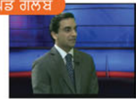
ਪਿੰਡ ਗਲੋਬ Pind Globe Panel discussion on Punjabi Diaspora issues