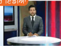
ਖਬਰ ਇੰਡੀਆ Khabar India India's National News Bulletin