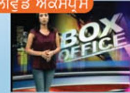
ਬੌਲੀਵੁੱਡ ਐਕਸਪ੍ਰੈਸ Bollywood Express News from Bollywood