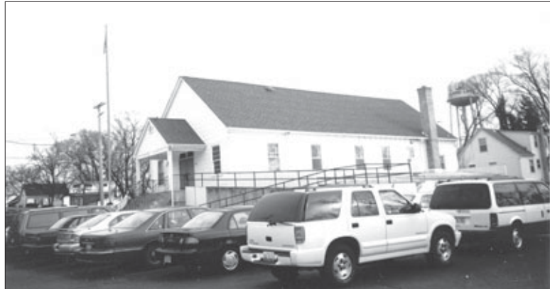
ਗੁਰਦੁਆਰਾ ਗੁਰਜੋਤਿ ਪ੍ਰਕਾਸ਼

ਬਾਅਦ ਵਿਚ ਪਤਾ ਲੱਗਿਆ ਕਿ ਸੈਦਾਨ ਵਿਚ ਸੌ ਲਾਸ਼ਾਂ ਪਈਆਂ ਸਨ। ਅਸੀਂ ਨੌਂ ਸੈਨਿਕਾਂ ਨੂੰ ਗੁਆ ਦਿੱਤਾ ਸੀ। ਸੱਤ ਸੈਨਿਕ ਜ਼ਖਮੀ ਹੋ ਗਏ ਸਨ। ਅਸੀਂ ਬਾਕੀ ਬਚੇ ਸਾਰੇ ਦਿਵਰੋਹੀਆਂ ਨੂੰ ਫਾਂਸੀ 'ਤੇ ਲਟਕਾ ਦਿੱਤਾ।"