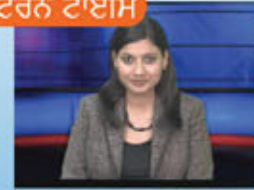
ਵੈਸਟਰਨ ਟਾਈਮ Western Times News from North America