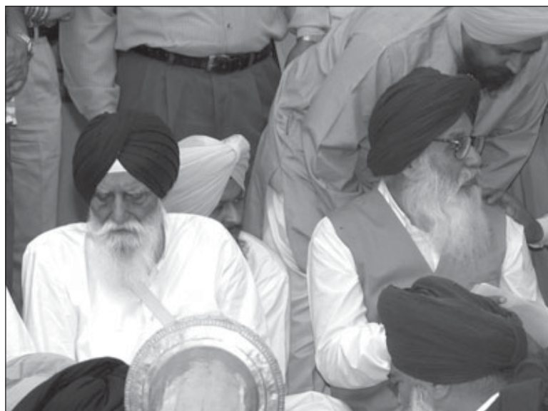
ਜਥੇਦਾਰ ਟੌਹੜਾ ਦੇ ਚਲਾਣੇ ਤੋਂ ਸਿਰਫ ਕੁਝ ਦਿਨ ਪਹਿਲਾਂ ਖਿੱਚੀ ਗਈ ਤਸਵੀਰ