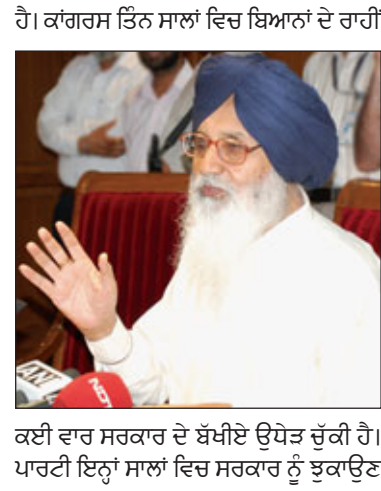
ਕਈ ਵਾਰ ਸਰਕਾਰ ਦੇ ਬੱਖੀਏ ਉਧੇੜ ਚੁੱਕੀ ਹੈ। ਪਾਰਟੀ ਇਨ੍ਹਾਂ ਸਾਲਾਂ ਵਿਚ ਸਰਕਾਰ ਨੂੰ ਝੁਕਾਉਣ

ਪੰਜਾਬ ਟਾਈਮਜ਼ ਬਿਊਰੋ ਜਲੰਧਰ: ਮੌਜੂਦਾ ਅਕਾਲੀ-ਭਾਜਪਾ ਸਰਕਾਰ ਦੇ ਤਿੰਨ ਸਾਲ ਬੀਤ ਚੁੱਕੇ ਹਨ ਪਰ ਇਸ ਕੋਲੋਂ ਆਪਣੇ ਵਾਅਦਿਆਂ ਅਤੇ ਵਿਕਾਸ ਕਾਰਜਾਂ ਦੇ ਮਾਮਲੇ ਵਿਚ ਗੋਰੇ ਵਿਚੋਂ ਪੂਣੀ ਵੀ ਨਹੀਂ ਕੱਤੀ ਗਈ। ਇਨ੍ਹਾਂ ਪਛਲੇ ਤਿੰਨ ਸਾਲਾਂ ਦੇ ਦੌਰਾਨ ਕੰਮਕਾਜ ਦੇ ਲਿਹਾਜ਼ ਨਾਲ ਜੇਕਰ ਸਰਕਾਰ ਸੁਸਤ ਨਜ਼ਰ ਆਉਂਦੀ ਹੈ ਤਾਂ ਵਿਰੋਧੀ ਧਿਰ ਵੀ ਨਕਾਰਾ ਨਜ਼ਰ ਵਿਖਾਈ ਦਿੰਦੀ। ਆਪਸੀ ਲੜਾਈ ਵਿਚ ਉਲਝੀ ਕਾਂਗਰਸ ਨਾ ਤਾਂ ਵਿਧਾਨਸਭਾ ਵਿਚ ਤੇ ਨਾ ਹੀ ਇਸ ਤੋਂ ਬਾਹਰ ਪ੍ਰਭਾਵੀ ਵਿਰੋਧੀ ਧਿਰ ਦੀ ਭੂਮਿਕਾ ਵਿਚ ਨਜ਼ਰ ਆਈ। ਇਸ ਦੇ ਉਲਟ ਜਨਤਾ ਦੇ ਹਿੱਤ ਵਿਚ ਸਰਕਾਰ ਨੂੰ ਫੈਸਲਾ ਬਦਲਣ ਲਈ ਮਜ਼ਬੂਰ ਕਰਨ ਦਾ ਕੰਮ ਸੱਤਾ 'ਚ ਭਾਈਵਾਲ ਭਾਜਪਾ ਨੇ ਕੀਤਾ