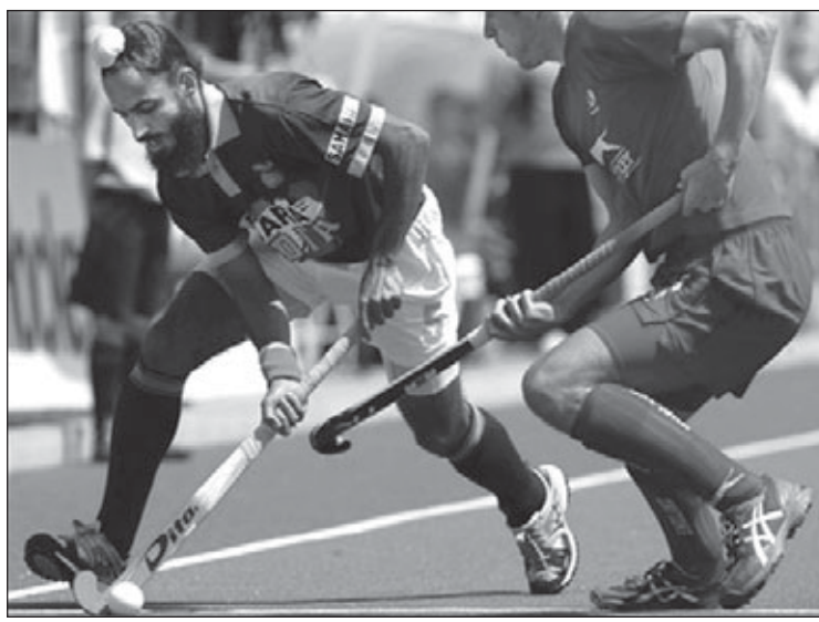
ਏਸ਼ੀਆ ਵਿਚ ਹਾਕੀ ਦੀ ਖੇਡ ਦੇ ਮਾਮਲੇ ਵਿਚ ਸਿਰਫ ਕੋਰੀਆ ਹੀ ਕੁਝ ਸਨਮਾਨਯੋਗ ਸਥਾਨ ਬਣਾ ਸਕਿਆ ਹੈ। ਉੱਧਰ ਯੂਰਪੀਅਨ ਟੀਮਾਂ ਵਿਚੋਂ ਸਪੇਨ, ਨਿਊਜ਼ੀਲੈਂਡ ਵੀ ਸਨਮਾਨ

ਜਲੰਧਰ: 28 ਫਰਵਰੀ ਤੋਂ 14 ਮਾਰਚ ਤਕ ਨਵੀਂ ਦਿੱਲੀ ਵਿਚ ਹੋ ਰਹੇ ਵਿਸ਼ਵ ਕੱਪ ਹਾਕੀ ਮੁਕਾਬਲੇ ਵਿਚ ਇਕ ਵਾਰ ਫਿਰ ਯੂਰਪੀ ਟੀਮਾਂ ਨੇ ਆਪਣਾ ਦਬਦਬਾ ਕਾਇਮ ਕਰ ਲਿਆ ਹੈ। ਆਸਟ੍ਰੇਲੀਆ, ਇੰਗਲੈਂਡ, ਹਾਲੈਂਡ ਅਤੇ ਜਰਮਨੀ ਦੀਆਂ ਟੀਮਾਂ ਵਿਸ਼ਵ ਕੱਪ ਹਾਕੀ ਦੇ ਸੈਮੀਫਾਈਨਲ ਵਿਚ ਆਪਣਾ ਸਥਾਨ ਪੱਕਾ ਕਰ ਚੁੱਕੀਆਂ ਹਨ। ਨੀਦਰਲੈਂਡ ਦੀ ਟੀਮ ਭਾਵੇਂ ਆਪਣਾ ਆਖਰੀ ਲੀਗ ਮੁਕਾਬਲਾ ਦੱਖਣੀ ਕੋਰੀਆ ਦੀ ਟੀਮ ਨੂੰ 1-2 ਨਾਲ ਹਾਰ ਗਈ ਪਰ ਬੇਹਤਰ ਗੋਲ ਔਸਤ ਦੇ ਆਧਾਰ 'ਤੇ ਉਸ ਨੇ ਸੈਮੀਫਾਈਨਲ ਵਿਚ ਦਾਖਲਾ ਪਾ ਲਿਆ। ਪਿਛਲੀ ਵਾਰ ਦੀ ਵਿਸ਼ਵ ਕੱਪ ਚੈਂਪੀਅਨ ਜਰਮਨੀ ਦੀ ਟੀਮ ਨੇ ਨਿਊਜ਼ੀਲੈਂਡ ਦੀ ਟੀਮ ਨੂੰ 5-2 ਦੇ ਫਰਕ ਨਾਲ ਹਰਾ ਕੇ ਆਪਣਾ ਆਖਰੀ ਲੀਗ ਮੁਕਾਬਲਾ ਜਿੱਤਿਆ। ਇੰਜ ਹੀ ਇੰਗਲੈਂਡ ਦੀ ਟੀਮ ਆਪਣਾ ਆਖਰੀ ਲੀਗ ਮੁਕਾਬਲਾ ਸਪੇਨ ਦੀ ਟੀਮ ਨੂੰ 2-0 ਨਾਲ ਹਾਰਨ ਦੇ ਬਾਵਜੂਦ ਸੈਮੀਫਾਈਨਲ ਵਿਚ ਪਹੁੰਚ ਗਈ ਸੀ। ਆਸਟ੍ਰੇਲੀਆ ਦੀ ਟੀਮ ਵੀ ਆਪਣਾ ਇਕ ਲੀਗ ਮੈਚ ਇੰਗਲੈਂਡ ਦੇ ਵਿਰੁਧ ਹਾਰ ਚੁੱਕੀ ਹੈ, ਪਰ ਉਸ ਨੇ ਆਪਣੇ ਬਾਕੀ ਸਾਰੇ ਲੀਗ ਮੈਚ ਜਿੱਤ ਕੇ ਦਿੱਲੀ ਵਿਚ ਹੋ ਰਹੇ ਹੀਰੋ ਹਾਂਡ ਵਿਸ਼ਵ ਕੱਪ ਦੇ ਸੈਮੀਫਾਈਨਲ ਵਿਚ ਪ੍ਰਵੇਸ਼ ਕੀਤਾ। ਆਪਣੇ ਲੀਗ ਮੁਕਾਬਲਿਆਂ ਵਿਚ ਜਰਮਨੀ ਦੀ ਟੀਮ ਹੀ ਅਜੇ ਤੱਕ ਰਹੀ। ਉਸ ਦਾ ਕੋਰੀਆ ਨਾਲ ਲੀਗ ਮੁਕਾਬਲਾ ਬਰਾਬਰ ਰਿਹਾ ਸੀ ਪਰ ਬਾਕੀ ਸਾਰੇ ਲੀਗ ਮੁਕਾਬਲਿਆਂ ਵਿਚ ਉਸ ਨੇ ਜਿੱਤ ਪ੍ਰਾਪਤ ਕੀਤੀ ਹੈ।