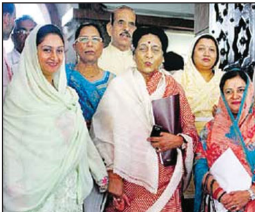
ਮਹਿਲਾ ਰਾਖਵਾਂਕਰਨ ਬਿਲ ਪਾਸ ਹੋਣ 'ਤੇ ਹਰਸਿਮਰਤ ਕੌਰ ਬਾਦਲ ਹੋਰ ਮੈਂਬਰਾਂ ਨਾਲ

ਵਿਰੋਧੀ ਧਿਰ ਦੇ ਨੇਤਾ ਅਰੁਣ ਜੇਤਲੀ ਤੇ ਵੱਖ-ਵੱਖ ਦਲਾਂ ਦੇ ਮੈਂਬਰਾਂ ਤੋਂ ਇਲਾਵਾ ਪ੍ਰਧਾਨ ਮੰਤਰੀ ਡਾ. ਮਨਮੋਹਨ ਸਿੰਘ ਨੇ ਵੀ ਆਪਣਾ ਪੱਖ ਰੱਖਦਿਆਂ ਪਿਛਲੇ ਦੋ ਦਿਨਾਂ ਦੌਰਾਨ ਰਾਜ ਸਭਾ ਵਿਚ ਹੋਈਆਂ ਘਟਨਾਵਾਂ ਤੇ ਦੁੱਖ ਪ੍ਰਗਟ ਕਰਦਿਆਂ ਕਿਹਾ ਕਿ ਬਿਲ ਦੇ ਪੱਖ ਵਿਚ 186 ਅਤੇ ਵਿਰੋਧ ਵਿਚ 1 ਵੋਟ। ਇਸ ਵੱਡੀ ਹਮਾਇਤ ਤੋਂ ਪਤਾ ਲਗਦਾ ਹੈ ਕਿ ਲੋਕਤੰਤਰ ਮਜ਼ਬੂਤ ਆਧਾਰ 'ਤੇ ਖੜ੍ਹਾ ਹੈ ਅਤੇ ਔਰਤਾਂ ਦੀ ਭਲਾਈ (ਸਸਕਤੀਕਰਨ) ਦੀ (ਬਾਕੀ ਸਫਾ 3 'ਤੇ)