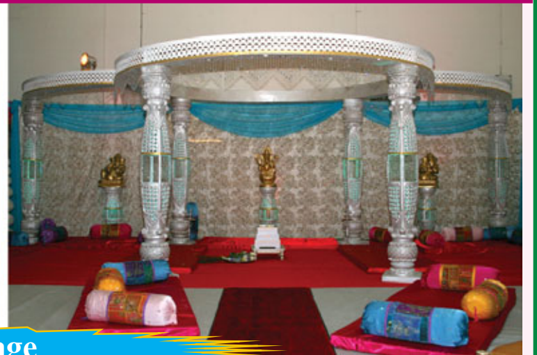
Crystal Mandap and Stage

Free up to 500 rental chair covers with Full package Services