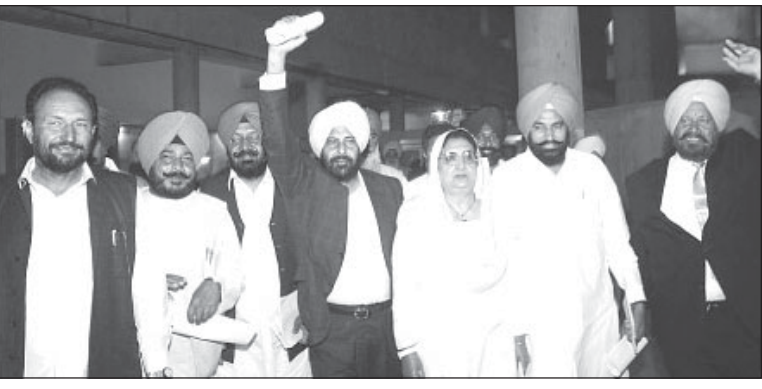
ਪੰਜਾਬ ਕਾਂਗਰਸ ਵਲੋਂ ਵਾਕਆਉਟ ਕੀਤੇ ਜਾਣ ਦਾ ਦ੍ਰਿਸ਼।

ਯਾਦ ਰਹੇ 26 ਮਾਰਚ ਤੱਕ ਚੱਲਣ ਵਾਲਾ ਪੰਜਾਬ ਵਿਧਾਨ ਸਭਾ ਦਾ 9ਵਾਂ ਇਜਲਾਸ (ਬਜਟ ਸੈਸ਼ਨ) ਲੰਘੀ 4 ਮਾਰਚ ਨੂੰ ਪੰਜਾਬ ਦੇ ਰਾਜਪਾਲ ਸ਼ਿਵਰਾਜ ਪਾਟਿਲ ਦੇ ਭਾਸ਼ਣ ਨਾਲ ਸ਼ੁਰੂ ਹੋਇਆ ਸੀ। ਭਾਸ਼ਨ ਦੌਰਾਨ ਸ੍ਰੀ ਪਾਟਿਲ ਨੇ ਮੁਲਕ ਵਿਚ ਹਕੀਕੀ ਸੰਘੀ ਢਾਂਚੇ ਦੀ ਕਾਇਮੀ ਉਤੇ ਜ਼ੋਰ ਦਿੰਦਿਆਂ ਕਿਹਾ ਕਿ ਭਾਰਤ ਵਰਗੇ ਬਹੁਭਾਂਡੀ ਦੇਸ਼ ਲਈ ਇਹ ਸਭ ਤੋਂ ਵਧ ਢੁੱਕਵਾਂ ਸਿਆਸੀ ਢਾਂਚਾ ਹੈ। 13ਵੀਂ ਪੰਜਾਬ ਵਿਧਾਨ ਸਭਾ ਦੇ 9ਵੇਂ ਇਜਲਾਸ ਨੂੰ ਸੰਬੋਧਨ ਕਰਦਿਆਂ ਸ੍ਰੀ ਪਾਟਿਲ ਨੇ ਅਪਣੇ