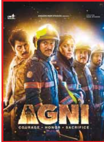
ਫਿਲਮ 'ਅਗਨੀ' ਦਾ ਪੋਸਟਰ।