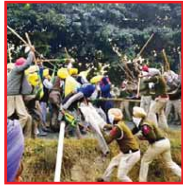
ਬਾਰੇ ਸੋਚਣ ਦੀ ਥਾਂ ਗੁਜਰਾਤ ਰਾਹੀਂ ਵਪਾਰ ਬਾਰੇ ਸੋਚਣ ਪਿੱਛੇ ਸਰਕਾਰ ਦਾ ਮੰਤਵ ਸਮਝਿਆ ਜਾ ਸਕਦਾ ਹੈ।

ਮਾਹਿਰਾਂ ਵੱਲੋਂ ਗੁਜਰਾਤ ਦੇ ਜਾਮਨਗਰ ਤੋਂ ਅੰਮ੍ਰਿਤਸਰ ਤੱਕ ਇਹ ਹਾਈਵੇਅ ਬਣਾਉਣ ਦਾ ਮੰਤਵ ਇਹ ਦੱਸਿਆ ਜਾ ਰਿਹਾ ਹੈ ਕਿ ਇਸ ਹਾਈਵੇਅ ਰਾਹੀਂ ਪੰਜਾਬ ਅਤੇ ਨੇੜਲੇ ਸੂਬੇ ਗੁਜਰਾਤ ਰਾਹੀਂ ਕੇਂਦਰੀ ਸੜਕੀ ਸੰਪਰਕ ਬਣਾਉਣਗੇ। ਅੰਮ੍ਰਿਤਸਰ ਜ਼ਿਲ੍ਹਾ ਖੁਦ ਸਰਹੱਦੀ ਜ਼ਿਲ੍ਹਾ ਹੈ ਤੇ 1947 ਦੀ ਵੰਡ ਤੋਂ ਪਹਿਲਾਂ ਪੰਜਾਬ ਰਾਹੀਂ ਭਾਰਤ ਮੱਧ ਪੂਰਬ ਤੱਕ ਵਪਾਰ ਕਰਦਾ ਰਿਹਾ ਹੈ। ਇਹ ਸਰਹੱਦ ਰਾਹੀਂ ਮੁੜ ਵਪਾਰ