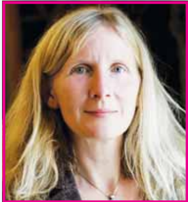
ਬੁੱਕਰ ਪੁਰਸਕਾਰ ਜੇਤੂ ਸਾਮੰਥਾ ਹਾਰਵੇ।