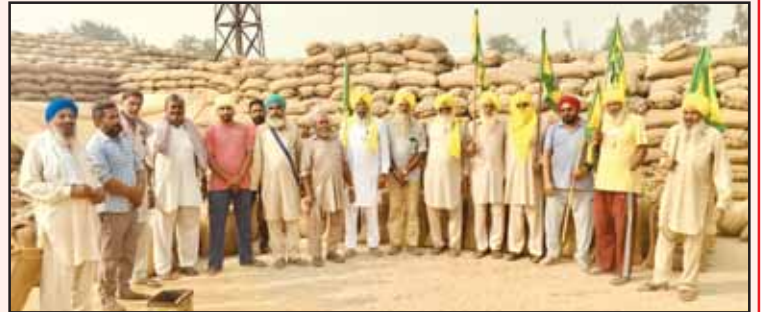
ਵੱਡੀਆਂ ਵੱਡੀਆਂ ਮਾਰ ਕੇ ਡੀਂਗਾਂ, ਲੋਕਾਂ ਤਾਈਂ ਮੂਰਖ ਬਣਾਇਆ। 'ਦਾਣਾ ਦਾਣਾ ਚੁੱਕਣ' ਵਾਲਾ, ਸਰਕਾਰਾਂ ਝੂਠਾ ਲਾਰਾ ਲਾਇਆ। ਮੰਡੀਆਂ ਵਿਚ ਅੰਬਾਰ ਲੱਗ ਗਏ, ਕਿਰਤ ਕਿਸਾਨੀ ਰੁਲਦੀ ਜਾਵੇ। ਬੱਸ, ਝੰਡੇ ਦੇ ਵਿਚ ਪਾਇਆ ਡੰਡਾ, ਸਭ ਨੂੰ ਸਿੱਧੇ ਰਸਤੇ ਪਾਵੇ।