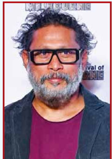
ਫਿਲਮ 'ਆਈ ਵਾਂਟ ਟੂ ਟਾਕ' ਦਾ ਪੋਸਟਰ, (ਵਿਚਕਾਰ) ਅਦਾਕਾਰ ਅਭਿਸ਼ੇਕ ਬੱਚਨ ਅਤੇ (ਸੱਜੇ) ਫਿਲਮ ਦਾ ਨਿਰਦੇਸ਼ਕ ਸੂਜੀਤ ਸਰਕਾਰ।