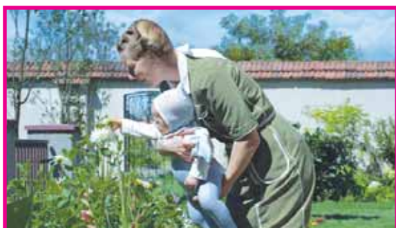
ਫਿਲਮ 'ਦਿ ਜ਼ੋਨ ਆਫ ਇੰਟਰਸਟ' ਬਣਾਉਣ ਵੇਲੇ ਅਦਾਕਾਰਾਂ ਨੂੰ ਸੀਨ ਸਮਝਾ ਰਿਹਾ ਜੋਨਾਥਨ ਗਲੇਜ਼ਰ ਤੇ (ਸੱਜੇ) ਫਿਲਮ ਦਾ ਦ੍ਰਿਸ਼।