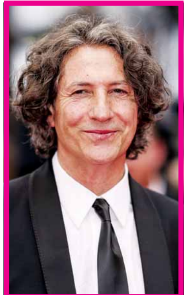
ਫਿਲਮ 'ਦਿ ਜ਼ੋਨ ਆਫ ਇੰਟਰਸਟ' ਦਾ ਨਿਰਦੇਸ਼ਕ ਜੋਨਾਥਨ ਗਲੇਜ਼ਰ।

ਅੰਦਰੋਂ ਗੈਰ-ਮਾਨਵੀ ਅਤੇ ਗੈਰ-ਸੰਵੇਦਨਸ਼ੀਲ ਹੋ ਰਹੇ ਜਰਮਨਾਂ ਦੇ ਠੰਢੇ ਦਿਲਾਂ ਵਿਚ ਕੋਈ ਰੌਸ਼ਨੀ ਕਰ ਸਕੇ। ਉਸ ਨੂੰ ਅਜਿਹਾ ਕਿਰਦਾਰ ਇੱਕ ਨਿੱਕੀ ਲੜਕੀ ਦੇ ਰੂਪ ਵਿਚ ਮਿਲਦਾ ਹੈ ਜਿਹੜੀ ਰਾਤਾਂ ਨੂੰ ਯਹੂਦੀ ਕੈਂਪਾਂ ਲਈ ਕੈਂਪ ਦੇ ਆਲੇ-ਦੁਆਲੇ ਖਿੱਚੀਆਂ ਵਾਤਾਂ ਅਤੇ ਖਾਲਾਂ ਵਿਚ ਸੋਝ ਲੁਕਾ ਜਾਂਦੀ ਹੈ ਤਾਂ ਕਿ ਉਹ ਭੁੱਖ ਨਾਲ ਨਾ ਮਰ ਜਾਣ।