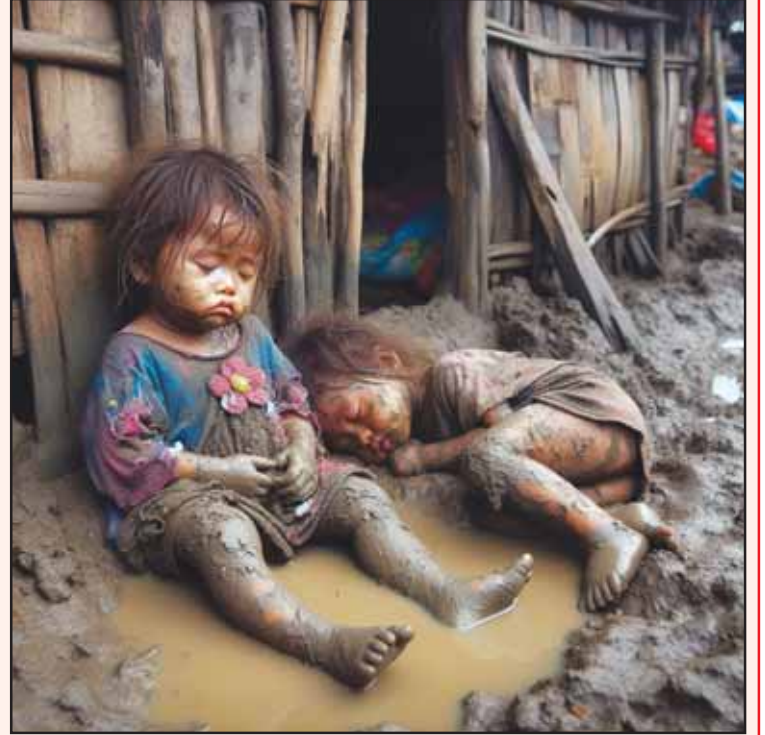
ਨੀਂਦ ਨਾ ਭਾਲੇ ਬਿਸਤਰਾ, ਨਾ ਦੇਖੇ ਬਾਂਹ ਕੁਥਾਂਹ, ਵਿਚ ਗਾਰਿਆਂ ਦੇ ਘੋਰ ਕੇ, ਫੜੀ ਨੀਂਦ ਆ ਬਾਂਹ। ਦੁੱਖ ਦੁਨੀਆਂ ਦੇ ਭੁੱਲ ਕੇ, ਸਭ ਰੱਖ ਗਮ ਪਰਾਂਹ, ਝੁੰਗੀਆਂ ਦੇ ਵਿਚ ਵੱਸਣਾ, ਸ਼ਹਿਰ ਨ ਪਿੰਡ ਗਰਾਂ।