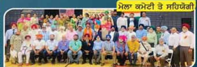
ਮੇਲਾ ਕਮੇਟੀ ਤੇ ਸਹਿਯੋਗੀ

4.0 ਜੀ.ਪੀ.ਏ ਗਰੇਡ ਵਾਲੇ ਹਾਈ ਸਕੂਲ ਅਤੇ ਕਾਲਜ ਦੇ ਵਿਦਿਆਰਥੀਆਂ ਦਾ ਵਿਸ਼ੇਸ਼ ਸਨਮਾਨ ਕੀਤਾ ਜਾਵੇਗਾ। Note: Students with 4.0 Grade should register at IAHFForum@gmail.com