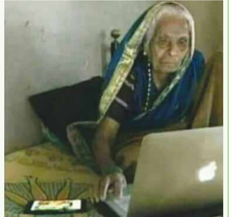
ਪੜ੍ਹਨ ਲਿਖਣ ਦੀ ਹਰ ਉਮਰ ਜੋ, ਮਨ ਸਿੱਖਣ ਦਾ ਚਾਅ, ਅੱਸੀਆਂ ਤੋਂ ਲੰਘੀ ਬੇਬੇ ਨੂੰ ਤੱਕੀਏ, ਕੰਪਿਊਟਰ ਰਹੀ ਚਲਾ। ਮੋਬਾਈਲ ਫੋਨ ਵੀ ਚਾਲੂ ਰੱਖਿਆ, ਜਾਪੇ ਗੂਗਲ ‘ਤੇ ਰੁੱਝੀ, ਮੁਰਤ ਖਿੱਚਣ ਦੀ ਪੋਤੇ-ਪੋਤੀਆਂ ਨੂੰ, ਹੈ ਝੱਟ ਸ਼ਰਾਰਤ ਸੁੱਝੀ।