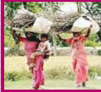
ਆਤਮ ਨਿਰਭਰ ਭਾਰਤ ਦੇਖੋ, ਗਰੀਬੀ ਕਿੰਝ ਹੰਢਾਵੇ, ਦੋ ਵਕਤਾਂ ਦੀ ਨਾ ਪੈਂਦੀ ਪੂਰੀ, ਤਸਵੀਰ ਇਹ ਦਿਖਾਵੇ। ਵਿਚ ਅਖਬਾਰਾਂ ਗੈਸਾਂ ਵੰਡ ਕੇ, ਨੇਤਾ ਫੋਟੋ ਖੜ੍ਹ ਲੁਆਵੇ, ਸੋਸ਼ੇਬਾਜ਼ੀ ਨਿੱਤ ਨਿੱਤ ਕਰ ਕੇ, ਗਰੀਬਾਂ ਦੀ ਖਿੱਲੀ ਪਾਵੇ। -ਸੇਵਾ ਸਿੰਘ ਨੂਰਪੁਰੀ

ਦੇਖੋ ‘ਮਹਾਨ ਦੇਸ਼’ ਦੀਆਂ ਨਾਰੀਆਂ ਪਸੂਆਂ ਵਰਗੀ ਜੂਨ ਹੰਢਾਵਣ। ਠੰਢਾ ਚੁੱਲ੍ਹਾ ਤਪਾਉਣ ਦੀ ਖਾਤਰ ਡੱਕੇ ਚੁਗ ਚੁਗ ਡੰਗ ਟਪਾਵਣ। ਸਿਰਾਂ ‘ਤੇ ਬਾਲਣ ਵੋਂਹਦੇ ਵੋਂਹਦੇ ਬੱਸ, ਖੁਦ ਬਾਲਣ ਹੋ ਜਾਵਣ। -ਜਗਮੀਤ ਸਿੰਘ ਪੰਧੋਰ ਕਲਾਹੜ (ਲੁਧਿਆਣਾ) ਫੋਨ: 98783-37222