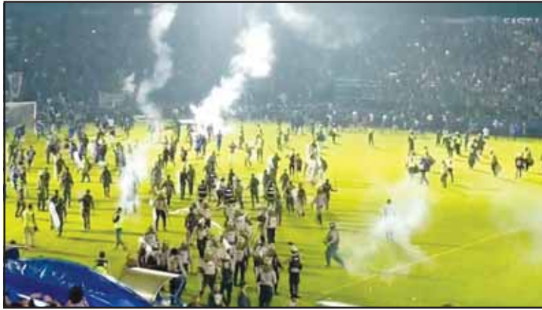
ਅਧਿਕਾਰੀਆਂ 'ਤੇ ਬੋਲਦੇ ਹੋਰ ਚੀਜ਼ਾਂ ਸੁੱਟੀਆਂ। ਉਤਰ ਕੇ ਰੋਸ ਮੁਜ਼ਾਹਰਾ ਕਰਨ ਲੱਗੇ ਅਤੇ ਉਨ੍ਹਾਂ ਪ੍ਰਸ਼ੰਸਕ ਕੰਜ਼ਰੂਹਾਨ ਸਟੇਡੀਅਮ ਦੇ ਮੈਦਾਨ 'ਤੇ ਅਰੇਮਾ ਪ੍ਰਬੰਧਕਾਂ ਤੋਂ ਪੁੱਛਿਆ ਕਿ ਘਰੇਲੂ ਮੈਚਾਂ

ਮਲਾਂਗ (ਇੰਡੋਨੇਸ਼ੀਆ): ਇੰਡੋਨੇਸ਼ੀਆ 'ਚ ਇਕ ਫੁਟਬਾਲ ਮੈਚ ਮਗਰੋਂ ਮਚੀ ਭਗਦੜ 'ਚ ਮਰਨ ਵਾਲਿਆਂ ਦੀ ਗਿਣਤੀ ਵਧ ਕੇ 125 ਹੋ ਗਈ ਹੈ। ਮੈਚ ਮਗਰੋਂ ਹੋਏ ਵਿਵਾਦ ਕਾਰਨ ਬਣੀ ਸਥਿਤੀ ਨਾਲ ਨਜਿੱਠਣ ਲਈ ਪੁਲਿਸ ਨੇ ਅੱਥਰੂ ਗੈਸ ਦੇ ਗੋਲੇ ਦਾਗੇ ਜਿਸ ਕਾਰਨ ਦਰਸ਼ਕਾਂ 'ਚ ਭਗਦੜ ਮੱਚ ਗਈ ਤੇ ਜ਼ਿਆਦਾਤਰ ਲੋਕਾਂ ਦੀ ਮੌਤ ਦਰਤੇ ਜਾਣ ਕਾਰਨ ਹੋਈ ਹੈ।