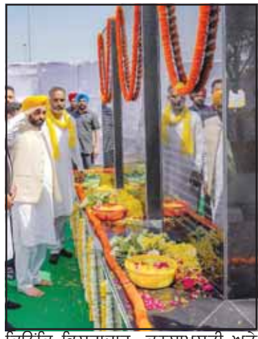
ਕਿਉਂਕਿ ਭ੍ਰਿਸ਼ਟਾਚਾਰ, ਕੁਨਬਾਪੂਸਤੀ ਅਤੇ ਗੁਰਬਤ ਦੀਆਂ ਜੜ੍ਹਾਂ ਅਜੇ ਵੀ ਮੌਜੂਦ ਹਨ। ਉਨ੍ਹਾਂ

ਦਾ ਵੀ ਐਲਾਨ ਕੀਤਾ। ਉਨ੍ਹਾਂ ਕਿਹਾ ਕਿ ਇਹ ਚੇਅਰ ਸ਼ਹੀਦ ਭਗਤ ਦੇ ਜੀਵਨ ਤੇ ਵਿਚਾਰਧਾਰਾ ਉੱਤੇ ਖੋਜ ਕਰਨ ਦੀ ਜ਼ਿੰਮੇਵਾਰੀ ਨਿਭਾਉਣ ਦੇ ਨਾਲ ਆਉਣ ਵਾਲੀਆਂ ਪੀੜ੍ਹੀਆਂ ਨੂੰ ਦੇਸ਼ ਸੇਵਾ ਲਈ ਪ੍ਰੇਰਿਤ ਕਰੇਗੀ। ਮੁੱਖ ਮੰਤਰੀ ਨੇ ਆਪਣੇ ਸੰਬੋਧਨ ਵਿੱਚ ਲੋਕਾਂ ਨੂੰ ਇਹ ਪੁਣ ਕਰਨ ਦਾ ਸੱਦਾ ਦਿੱਤਾ ਕਿ ਉਹ ਚੰਗੇ ਮੌਕਿਆਂ ਦੀ ਤਲਾਸ਼ ਵਿੱਚ ਆਪਣਾ ਵਤਨ ਛੱਡ ਕੇ ਨਹੀਂ ਜਾਣਗੇ। ਉਨ੍ਹਾਂ ਕਿਹਾ ਕਿ ਸਾਨੂੰ ਸਾਰਿਆਂ ਨੂੰ ਇਹ ਅਹਿੰਦ ਲੈਣਾ ਚਾਹੀਦਾ ਹੈ ਕਿ ਬਿਹਤਰ ਜ਼ਿੰਦਗੀ ਦੀ ਭਾਲ ਵਿੱਚ ਦੇਸ਼ ਛੱਡ ਕੇ ਜਾਣ ਦੀ ਬਜਾਏ ਇਥੇ ਹੀ ਸ਼ਾਸਨ ਪ੍ਰਣਾਲੀ ਨੂੰ ਸੁਧਾਰਾਗੇ। ਉਨ੍ਹਾਂ ਲੋਕਾਂ ਨੂੰ ਭਰੋਸਾ ਦਿਵਾਇਆ ਕਿ ਉਨ੍ਹਾਂ ਦੀ ਸਰਕਾਰ ਪੰਜਾਬ ਦੀ ਪੁਰਾਤਨ ਸ਼ਾਨ ਬਹਾਲ ਕਰਨ ਲਈ ਵਚਨਬੱਧ ਹੈ। ਮੁੱਖ ਮੰਤਰੀ ਨੇ ਕਿਹਾ ਕਿ ਸ਼ਹੀਦ-ਏ-ਆਜ਼ਮ ਦੇ ਸੁਪਨੇ ਅਜੇ ਵੀ ਸਾਕਾਰ ਨਹੀਂ ਹੋਏ