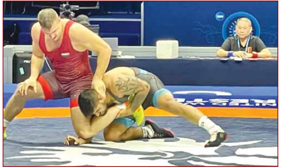
ਵਿਚ ਭਾਗ ਲਿਆ। ਇਨ੍ਹਾਂ ਵਿਸ਼ਵ ਕੁਸ਼ਤੀ ਮੁਕਾਬਲਿਆਂ ਵਿਚ ਅਮਰੀਕਾ ਤੇ ਇਰਾਨ ਦੇ ਪਹਿਲਵਾਨਾਂ ਦੀ ਸਰਦਾਰੀ ਰਹੀ। ਇਸ ਵਿਸ਼ਵ ਦੰਗਲ ਵਿਚ ਸ਼ਾਮਲ ਹੋਏ।