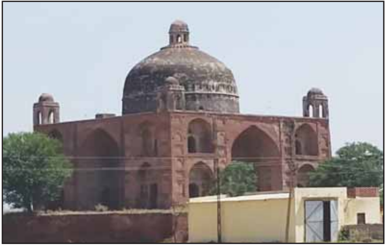
ਉਸਤਾਦ ਦਾ ਮਕਬਰਾ

ਦਾ ਹੰਕਾਰ ਤੋੜਿਆ, ਜਿਸ ਕਾਰਨ ਇਨ੍ਹਾਂ ਮਕਬਰਿਆਂ ਨੂੰ ਹੰਕਾਰ ਤੋੜਨ ਦਾ ਪ੍ਰਤੀਕ ਵੀ ਮੰਨਿਆ ਜਾਂਦਾ ਹੈ ਅਤੇ ਇਹ ਵੀ ਸਿੱਧ ਹੁੰਦਾ ਹੈ ਕਿ ਉਸਤਾਦ ਹਮੇਸ਼ਾ ਉਸਤਾਦ ਹੀ ਰਹਿੰਦਾ ਹੈ। ਅੱਜ ਵੀ ਸ਼ਾਗਿਰਦ ਖਵਾਜ਼ਾ ਖਾਨ ਵਲੋਂ ਬਣਾਇਆ ਮਕਬਰਾ ਸਿਖਰਲੀ ਬੋਦੀ ਤੋਂ ਸੱਖਣਾ ਹੈ ਜਦਕਿ ਉਸਤਾਦ ਵਲੋਂ ਬਣਾਏ ਮਕਬਰੇ ਦੇ ਸਾਰੇ ਗੁੰਬਦ ਬਣੇ ਹੋਏ ਹਨ। ਇਨ੍ਹਾਂ ਮਕਬਰਿਆਂ 'ਤੇ ਭਾਰਤ ਸਰਕਾਰ ਦੇ ਪ੍ਰਾਚੀਨ ਤੇ ਇਤਿਹਾਸਕ ਵਿਭਾਗ ਵਲੋਂ ਇਮਾਰਤਾਂ ਨੂੰ ਨੁਕਸਾਨ ਨਾ ਪਹੁੰਚਾਉਣ ਸਬੰਧੀ ਤਾਂ ਬੋਰਡ ਲਗਾਇਆ ਹੋਇਆ ਹੈ ਪਰ ਇਸ ਸਮਾਰਕ ਦੀ ਜਾਣਕਾਰੀ ਜਾਂ ਇਤਿਹਾਸ ਸਬੰਧੀ ਕੋਈ ਬੋਰਡ ਨਹੀਂ ਹੈ।