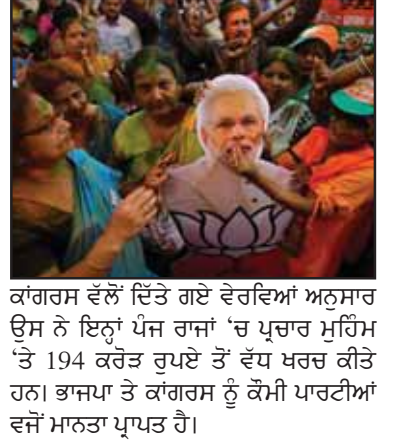
ਕਾਂਗਰਸ ਵੱਲੋਂ ਦਿੱਤੇ ਗਏ ਵੇਰਵਿਆਂ ਅਨੁਸਾਰ ਉਸ ਨੇ ਇਨ੍ਹਾਂ ਪੰਜ ਰਾਜਾਂ 'ਚ ਪ੍ਰਚਾਰ ਮੁਹਿੰਮ 'ਤੇ 194 ਕਰੋੜ ਰੁਪਏ ਤੋਂ ਵੱਧ ਖਰਚ ਕੀਤੇ ਹਨ। ਭਾਜਪਾ ਤੇ ਕਾਂਗਰਸ ਨੂੰ ਕੌਮੀ ਪਾਰਟੀਆਂ ਵਜੋਂ ਮਾਨਤਾ ਪ੍ਰਾਪਤ ਹੈ।

ਨਵੀਂ ਦਿੱਲੀ: ਭਾਰਤੀ ਜਨਤਾ ਪਾਰਟੀ ਨੇ ਇਸ ਸਾਲ ਹੋਈਆਂ ਪੰਜ ਰਾਜਾਂ ਦੀਆਂ ਵਿਧਾਨ ਸਭਾ ਚੋਣਾਂ ਦੇ ਪ੍ਰਚਾਰ 'ਤੇ 340 ਕਰੋੜ ਰੁਪਏ ਖਰਚ ਕੀਤੇ, ਜਦਕਿ ਕਾਂਗਰਸ ਨੇ ਇਨ੍ਹਾਂ ਰਾਜਾਂ 'ਚ 194 ਕਰੋੜ ਰੁਪਏ ਤੋਂ ਵੱਧ ਦਾ ਖਰਚ ਕੀਤਾ ਹੈ। ਚੋਣ ਕਮਿਸ਼ਨ ਨੂੰ ਇਨ੍ਹਾਂ ਦੋਵਾਂ ਪਾਰਟੀਆਂ ਵੱਲੋਂ ਖਰਚ ਸਬੰਧੀ ਸੌਂਪੇ ਗਏ ਵੇਰਵਿਆਂ ਤੋਂ ਇਹ ਜਾਣਕਾਰੀ ਸਾਹਮਣੇ ਆਈ ਹੈ। ਭਾਜਪਾ ਵੱਲੋਂ ਦਿੱਤੇ ਗਏ ਵੇਰਵਿਆਂ ਅਨੁਸਾਰ ਉਸ ਨੇ ਉੱਤਰ ਪ੍ਰਦੇਸ਼ 'ਚ ਸਭ ਤੋਂ ਵੱਧ 221 ਕਰੋੜ ਰੁਪਏ ਖਰਚੇ ਜਦਕਿ ਮਨੀਪੁਰ 'ਚ 23 ਕਰੋੜ, ਉੱਤਰਾਖੰਡ 'ਚ 43.67 ਕਰੋੜ, ਪੰਜਾਬ 'ਚ 36 ਕਰੋੜ ਤੋਂ ਵੱਧ ਅਤੇ ਗੋਆ 'ਚ 19 ਕਰੋੜ ਰੁਪਏ ਤੋਂ ਵੱਧ ਦਾ ਖਰਚਾ ਕੀਤਾ ਹੈ।