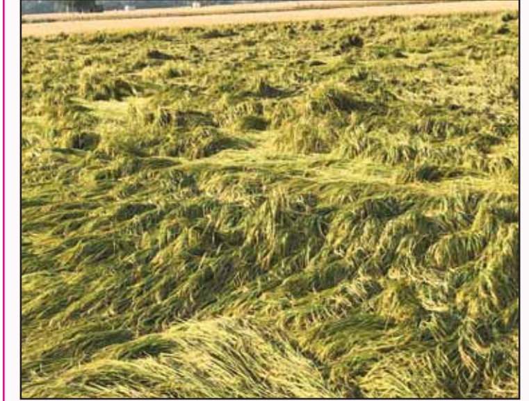
ਝੱਖੜ ਆਏ ਵਿਛ ਗਿਆ ਝੋਨਾ ਕਿਸਾਨ ਵਿਚਾਰਾ ਕਿੱਧਰ ਜਾਵੇ। ਪੱਕੀ ਫਸਲ 'ਤੇ ਮਾਰ ਪੈ ਗਈ ਖਰੀਦਣ ਵਾਲਾ ਵੱਟਾ ਲਾਵੇ। ਕਰਜ਼ੇ ਦਾ ਹੈ ਫਿਕਰ ਸਤਾਉਂਦਾ ਸਾਰ ਲੈਣ ਵੀ ਕੋਈ ਨਾ ਆਵੇ।