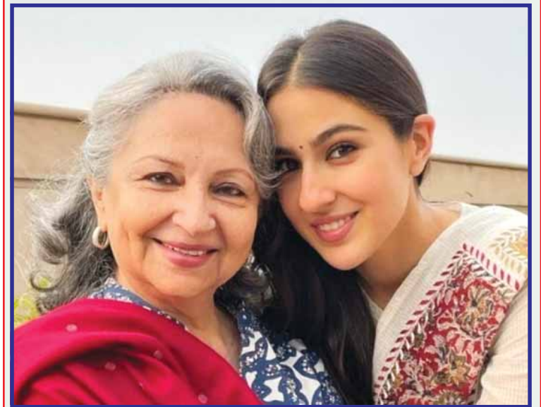
ਅਦਾਕਾਰਾ ਸ਼ਰਮੀਲਾ ਟੈਗੋਰ ਅਤੇ ਸਾਰਾ ਅਲੀ ਖਾਨ।

ਹੁਣ ਖਬਰ ਮਿਲੀ ਹੈ ਕਿ ਸਾਰਾ ਅਲੀ ਖਾਨ ਹੁਣ ਲਕਸ਼ਮਨ ਉਤੇਕਰ ਦੀ ਫਿਲਮ ਵਿਚ ਵਿੱਕੀ ਕੌਸਲ ਨਾਲ ਨਜ਼ਰ ਆਵੇਗੀ। ਉਹ ਵਿਕਰਾਂਤ ਮੈਸੀ ਨਾਲ ਫਿਲਮ 'ਗੈਸਲਾਈਟ' ਵਿਚ ਵੀ ਕੰਮ ਕਰ ਰਹੀ ਹੈ।