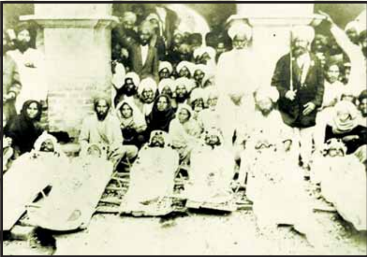
ਸ਼ਹੀਦਾਂ ਹੋਏ 6 ਬੱਬਰਾਂ ਦੀਆਂ ਦੇਹਾਂ ਨਾਲ ਲੋਕ।