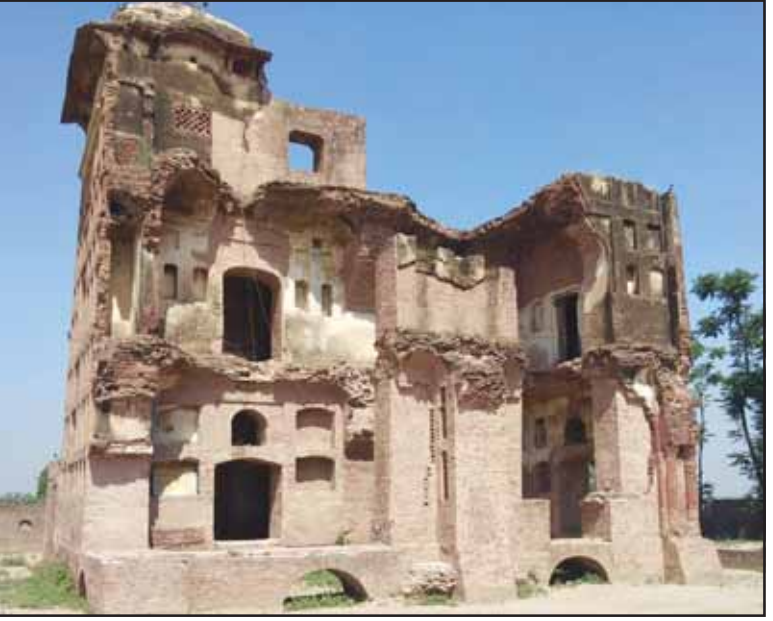
ਦੀਵਾਨ ਟੋਡਰ ਮਲ ਦੀ ਜਹਾਜ਼ ਹਵੇਲੀ

ਬਣੀਆਂ ਜ਼ਿਆਦਾਤਰ ਸਮਾਰਕਾਂ ਖੰਡਰਾਂ ਦਾ ਰੂਪ ਧਾਰਨ ਕਰ ਚੁੱਕੀਆਂ ਹਨ। ਭਾਰਤ ਅਤੇ ਪੰਜਾਬ