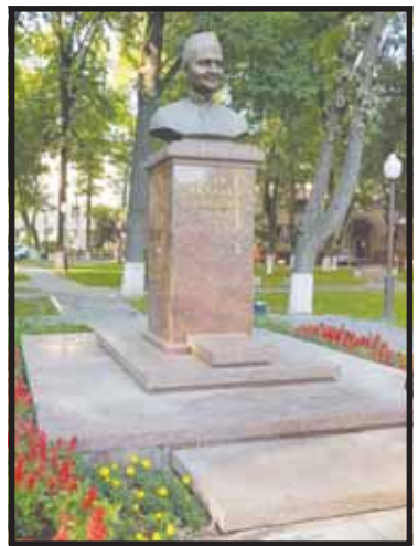
ਤਾਸ਼ਕੰਦ ਵਿਚ ਭਾਰਤ ਦੇ ਮਰਹੂਮ ਪ੍ਰਧਾਨ ਮੰਤਰੀ ਲਾਲ ਬਹਾਦਰ ਸ਼ਾਸਤਰੀ ਦੀ ਯਾਦਗਾਰ।

ਤਾਸ਼ਕੰਦ ਤੋਂ ਬਾਅਦ ਇਹ ਭਾਰਤੀ ਮੰਡਲੀ ਇਤਿਹਾਸਕ ਉਜ਼ਬੇਕ ਸ਼ਹਿਰ ਸਮਰਕੰਦ ਦੀ ਯਾਤਰਾ ਵਾਸਤੇ ਉਥੇ ਪੁੱਜੀ। ਦੁਨੀਆ ਦੇ ਤਿੰਨ ਵੱਡੇ ਸੂਰਮੇ ਜਰਨੈਲਾਂ ਦਾ ਨਾਂ ਸਮਰਕੰਦ ਨਾਲ