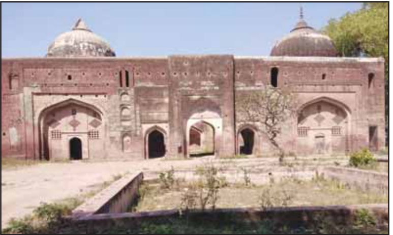
ਭਗਤ ਸਧਨੇ ਦੀ ਮਸੀਤ

ਆਪ 'ਚ ਕਲਾ ਦਾ ਇਕ ਨਮੂਨਾ ਹਨ। ਇਥੇ ਬਣੇ ਸਰਦਖਾਨੇ ਨੂੰ ਗਰਮੀਆਂ 'ਚ ਠੰਢਾ ਰੱਖਣ ਲਈ ਵਿਸ਼ੇਸ਼ ਇੰਜਾਮ ਕੀਤੇ ਗਏ ਸਨ। ਜਹਾਂਗੀਰ ਵਲੋਂ ਬਣਾਏ ਸਰਦਖਾਨੇ 'ਚ ਕਮਰੇ ਨੂੰ ਠੰਢਾ ਰੱਖਣ ਲਈ ਨਾਲ ਲੱਗਦੇ 32 ਚਰਸਾ ਖੂਹ ਵਿੱਚੋਂ ਪਾਣੀ ਕੱਢ ਕੇ ਵੱਡੇ ਹੋਦਾਂ 'ਚ ਸਪਲਾਈ ਕੀਤਾ ਜਾਂਦਾ ਸੀ ਅਤੇ ਕੰਧਾਂ 'ਚ ਬਣੀਆਂ ਨਾਲੀਆਂ ਰਾਹੀਂ ਪਾਣੀ ਕਮਰੇ ਨੂੰ ਠੰਢਾ ਰੱਖਦਾ ਸੀ। ਇਥੇ ਅੰਬਾਂ, ਨਾਸ਼ਪਤੀਆਂ ਤੇ ਅਮਰੂਦਾਂ ਦੇ ਬਾਗ ਹਨ, ਜੋ ਕਿ 11 ਏਕੜ ਤਕ ਫੈਲੇ ਹੋਏ ਹਨ। ਇੰਨਾ ਸਮਾਂ ਪਹਿਲਾਂ ਤੇ ਇੰਨੀ ਉੱਚ ਤਕਨੀਕ ਨਾਲ ਬਣਿਆ ਆਮ-ਖਾਸ ਬਾਗ ਸੱਚਮੁੱਚ ਹੀ ਵੇਖਣਯੋਗ ਹੈ। ਅੱਜ ਸਾਂਭ-ਸੰਭਾਲ ਦੀ ਘਾਟ ਕਾਰਨ ਇੱਥੇ