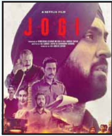
ਫਿਲਮ 'ਜੋਗੀ' ਵਿਚ ਦਿਲਜੀਤ ਦੁਸਾਂਝ ਅਤੇ (ਸੱਜੇ) ਫਿਲਮ ਦਾ ਪੋਸਟਰ।