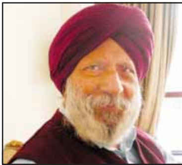
ਖੋਜ ਪੱਤਰ ਵੀ ਲਿਖੇ।