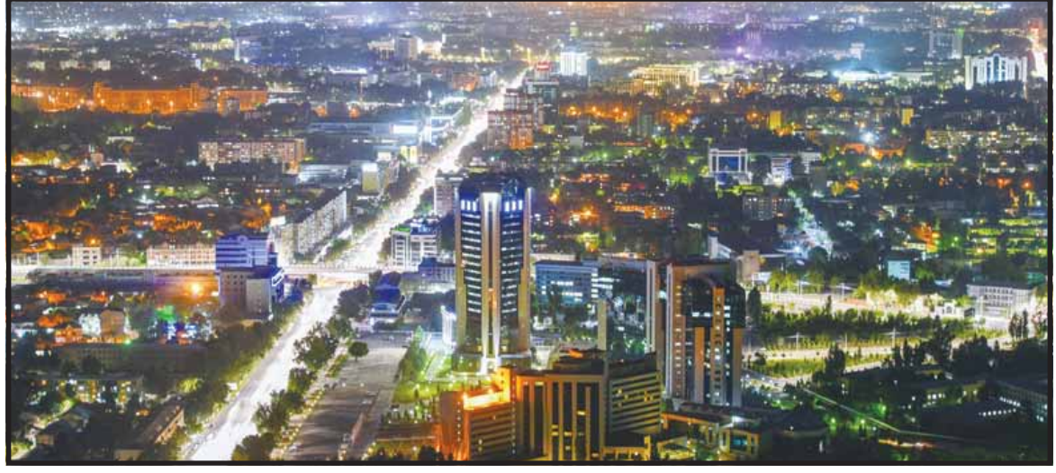
ਜਗਮਗਾ ਰਿਹਾ ਸ਼ਹਿਰ ਤਾਸ਼ਕੰਦ।

ਜੁੜਿਆ ਹੋਇਆ ਹੈ ਜਿਨ੍ਹਾਂ ਇਸ ਸ਼ਹਿਰ ‘ਤੇ ਆਪਣਾ ਝੰਡਾ ਬੁਲਾਇਆ। ਯੂਨਾਨ ਦਾ ਸਿਕੰਦਰ ਮਹਾਨ, ਮੰਗੋਲੀਆ ਦਾ ਚੰਗੇਜ਼ ਖਾਂ ਅਤੇ ਤੈਮੂਰ ਲੰਗ। ਸਮਰਕੰਦ ਦੀਆਂ ਮਸਜਿਦਾਂ ਇਮਾਰਤਕਲਾ ਦੇ ਸ਼ਾਹਕਾਰ ਨਹੂਨੇ ਹਨ, ਖਾਸਕਰ ਬੀਬੀ ਖਾਨਮ ਦੀ