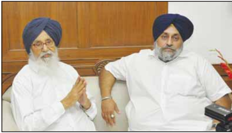
ਕਮੇਟੀ ਦੇ ਹੋਂਦ 'ਚ ਆਉਣ ਨਾਲ ਸ਼੍ਰੋਮਣੀ ਕਮੇਟੀ ਨੂੰ ਵੱਜੀ ਸੱਟ ਦੇ ਨਾਲ-ਨਾਲ ਦਲ ਨੂੰ ਸਿਆਸੀ ਤੌਰ 'ਤੇ ਖੜ੍ਹੀਆਂ ਹੋਣ ਵਾਲੀਆਂ ਚੁਣੌਤੀਆਂ ਬਾਰੇ ਵੀ ਚਰਚਾ ਕੀਤੀ ਗਈ। ਪਾਰਟੀ ਦੇ ਸੀਨੀਅਰ ਆਗੂਆਂ ਦੇ ਇਕ

ਚੰਡੀਗੜ੍ਹ: ਸ਼੍ਰੋਮਣੀ ਅਕਾਲੀ ਦਲ ਨੂੰ ਰਾਜਸੀ ਖੇਤਰ ਦੇ ਨਾਲ-ਨਾਲ ਪਾਰਟੀ ਖੇਤਰ ਦੀਆਂ ਚੁਣੌਤੀਆਂ ਨੇ ਵੀ ਘੇਰ ਲਿਆ ਹੈ। ਸੁਪਰੀਮ ਕੋਰਟ ਵੱਲੋਂ ਹਰਿਆਣਾ ਦੀ ਵੱਖਰੀ ਸ਼੍ਰੋਮਣੀ ਕਮੇਟੀ ਨੂੰ ਮਾਨਤਾ ਦੇਣ ਨਾਲ ਪਾਰਟੀ ਨੂੰ ਹੀ ਨਹੀਂ ਸਗੋਂ ਪਾਰਟੀ ਦੇ ਸੁਪਰੀਮ ਸੁਖਬੀਰ ਸਿੰਘ ਬਾਦਲ ਨੂੰ ਵੀ ਵੱਡਾ ਝਟਕਾ ਲੱਗਿਆ ਹੈ।