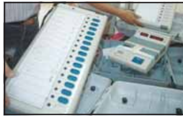
ਤਰੀਕ ਨਿਰਧਾਰਤ ਕੀਤੀ ਜਾਂਦੀ।

ਨਵੀਂ ਦਿੱਲੀ: ਸੂਬਾ ਸਰਕਾਰ ਤੋਂ ਵੱਖ-ਵੱਖ ਸਿਆਸੀ ਪਾਰਟੀਆਂ ਵੱਲੋਂ ਕੀਤੀ ਬੇਨਤੀ ਨੂੰ ਸਵੀਕਾਰ ਕਰਦਿਆਂ ਚੋਣ ਕਮਿਸ਼ਨ ਨੇ ਪੰਜਾਬ ਅਸੈਂਬਲੀ ਲਈ 14 ਫਰਵਰੀ ਨੂੰ ਹੋਣ ਵਾਲੀਆਂ ਚੋਣਾਂ ਨੂੰ ਗੁਰੂ ਰਵਿਦਾਸ ਜੈਅੰਤੀ ਦੇ ਵਾਲੇ ਨਾਲ ਹੁਣ 20 ਫਰਵਰੀ ਨੂੰ ਕਰਵਾਉਣ ਦਾ ਫੈਸਲਾ ਕੀਤਾ ਹੈ।