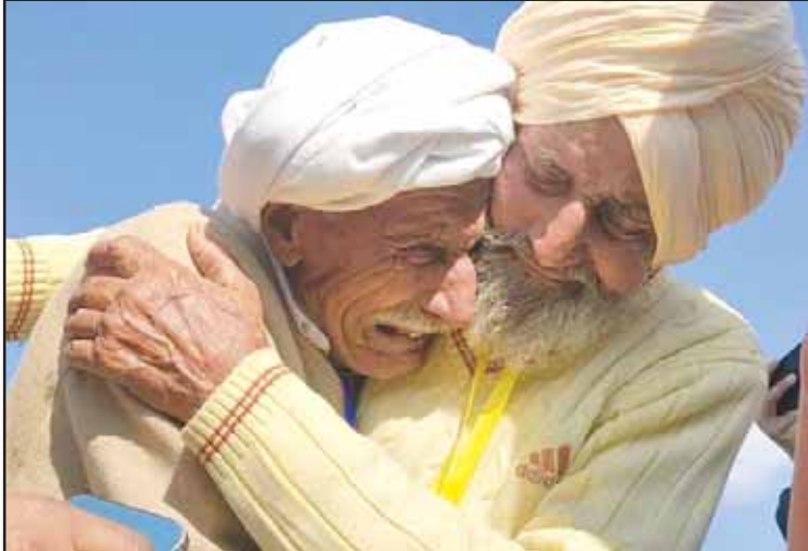
ਵੱਡੀ ਗਈ ਧਰਤ ਪਾ ਕੇ, ਵਾਘੇ ਦੀ ਲਕੀਰ ਸੀ, ਵਹਿਸ਼ੀ ਹੋ ਗਏ ਲੋਕ, ਹੋਏ ਰਾਜੇ ਵੀ ਫਕੀਰ ਸੀ। ਮਾਵਾਂ ਤੋਂ ਪੁੱਤ-ਧੀਆਂ, ਵਿੱਛੜੇ ਭੈਣਾਂ ਤੋਂ ਵੀਰ ਸੀ, ਖੁੱਲ੍ਹਿਆ ਹੈ ਲਾਂਘਾ, ਮਿਲੇ ਦਿਲ ਦਿਲਗੀਰ ਸੀ।