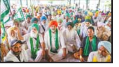
ਅਜੇ ਤੱਕ ਮੁਆਵਜ਼ਾ ਦੇਣ ਦਾ ਵਾਅਦਾ ਵਾਅਦਾ ਵੀ ਪੂਰਾ ਨਹੀਂ ਕੀਤਾ।

ਬੰਦ ਹਨ। ਜਦ ਐੱਸ.ਆਈ.ਟੀ. ਇਸ ਮਸਲੇ ਨੂੰ 'ਯੋਜਨਾਬੱਧ' ਕਹਿ ਰਹੀ ਹੈ ਤਾਂ ਉਨ੍ਹਾਂ ਕਿਸਾਨਾਂ ਨੂੰ ਤੁਰੰਤ ਰਿਹਾਅ ਕਰਨਾ ਬਣਦਾ ਹੈ ਅਤੇ ਉਨ੍ਹਾਂ ਖਿਲਾਫ ਦਰਜ ਕੇਸ ਤੁਰੰਤ ਵਾਪਸ ਲੈਣੇ ਚਾਹੀਦੇ ਹਨ ਪਰ ਸਰਕਾਰੀ ਵਕੀਲ ਅਦਾਲਤ ਵਿਚ ਇਸ ਗੱਲ ਦੀ ਲਗਾਤਾਰ ਪੈਰਵੀ ਕਰ ਰਹੇ ਹਨ ਕਿ ਉਹਨਾਂ ਨੂੰ ਜ਼ਮਾਨਤ ਨਾ ਮਿਲੇ। ਸੰਯੁਕਤ ਕਿਸਾਨ ਮੋਰਚਾ ਨਾਲ ਉੱਤਰ ਪ੍ਰਦੇਸ਼ ਸਰਕਾਰ ਦੇ ਵਾਅਦੇ ਅਨੁਸਾਰ ਵੀ ਜੇਲ੍ਹਾਂ ਵਿਚ ਬੰਦ ਕਿਸਾਨ ਰਿਹਾਅ ਕਰਨੇ ਬਣਦੇ ਸਨ। ਇਹਨਾਂ ਵਿਚ ਉਹ ਕਿਸਾਨ ਸ਼ਾਮਲ ਹਨ ਜਿਨ੍ਹਾਂ ਦੇ ਪਰਿਵਾਰਾਂ ਨੇ ਤਰਾਈ ਇਲਾਕੇ ਦੀਆਂ ਬੇਆਬਾਦ ਜ਼ਮੀਨਾਂ ਆਪਣੀ ਮਿਹਨਤ ਨਾਲ ਉਪਜਾਊ ਬਣਾਈਆਂ। ਸਰਕਾਰ ਨੇ ਮਾਰੇ ਗਏ ਕਿਸਾਨਾਂ ਦੇ ਪਰਿਵਾਰਾਂ ਅਤੇ ਜ਼ਖਮੀ ਕਿਸਾਨਾਂ ਨੂੰ