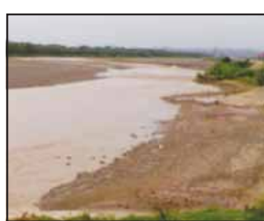
ਅਧਿਐਨ ਰਿਪੋਰਟ ਮੁਤਾਬਕ ਸਿਫਾਰਸ਼ਾਂ ਨੂੰ ਲਾਗੂ ਕਰਨਾ ਚਾਹੀਦਾ ਹੈ ਤਾਂ ਜੋ ਘੱਗਰ ਦਰਿਆ 'ਚ

ਨਵੀਂ ਦਿੱਲੀ: ਘੱਗਰ ਦਰਿਆ 'ਚ ਹੜ੍ਹ ਦੀ ਸਮੱਸਿਆ ਸੁਲਝਾਉਣ ਲਈ ਸੁਪਰੀਮ ਕੋਰਟ ਨੇ ਪੰਜਾਬ ਅਤੇ ਹਰਿਆਣਾ ਸਰਕਾਰਾਂ ਨੂੰ ਹੁਕਮ ਦਿੱਤੇ ਹਨ ਕਿ ਉਹ ਕੇਂਦਰੀ ਜਲ ਤੇ ਊਰਜਾ ਖੋਜ ਸਟੇਸ਼ਨ, ਪੁਣੇ (ਸੀ. ਡਬਲਿਊ. ਪੀ. ਆਰ. ਐਸ.) ਦੀਆਂ ਸਿਫਾਰਸ਼ਾਂ ਲਾਗੂ ਕਰਨ।