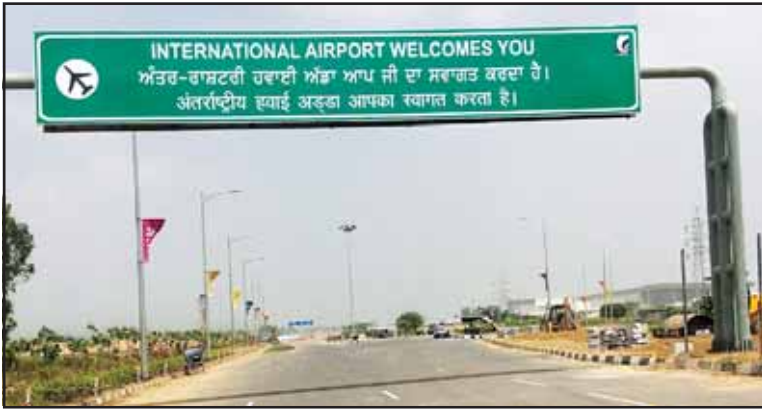
ਨੂੰ ਪੱਤਰ ਭੇਜਣਗੀਆਂ। ਇਸ ਤੋਂ ਬਾਅਦ ਹੀ ਚੰਡੀਗੜ੍ਹ ਕੌਮਾਂਤਰੀ ਹਵਾਈ ਅੱਡੇ ਦਾ ਨਾਮ ਬਦਲਿਆ ਜਾ ਸਕਦਾ ਹੈ। ਗੌਰਤਲਬ ਹੈ ਕਿ ਚੰਡੀਗੜ੍ਹ ਕੌਮਾਂਤਰੀ ਹਵਾਈ ਅੱਡੇ ਦਾ ਨਾਮ ਸ਼ਹੀਦ ਭਗਤ ਸਿੰਘ ਦੇ ਨਾਂ 'ਤੇ ਰੱਖਣ ਲਈ ਕਾਫੀ ਸਮੇਂ ਤੋਂ ਮੰਗ ਉੱਠ ਰਹੀ ਹੈ। ਇਸ ਮਾਮਲੇ 'ਤੇ ਕੇਂਦਰ ਸਰਕਾਰ ਨੇ ਪੰਜਾਬ ਅਤੇ ਹਰਿਆਣਾ ਦੀਆਂ ਸਰਕਾਰਾਂ ਤੋਂ ਸਹਿਮਤੀ ਮੰਗੀ ਸੀ।

ਚੰਡੀਗੜ੍ਹ: ਚੰਡੀਗੜ੍ਹ ਕੌਮਾਂਤਰੀ ਹਵਾਈ ਅੱਡੇ ਦਾ ਨਵਾਂ ਨਾਮ ਹੁਣ ਸ਼ਹੀਦ ਭਗਤ ਸਿੰਘ ਦੇ ਨਾਂ 'ਤੇ ਹੋਵੇਗਾ। ਇਸ ਸਬੰਧੀ ਪੰਜਾਬ ਅਤੇ ਹਰਿਆਣਾ ਵਿਚਾਲੇ ਸਹਿਮਤੀ ਬਣ ਗਈ ਹੈ। ਪੰਜਾਬ ਦੇ ਮੁੱਖ ਮੰਤਰੀ ਭਗਵੰਤ ਮਾਨ ਦੀ ਰਿਹਾਇਸ਼ 'ਤੇ ਹਰਿਆਣਾ ਦੇ ਉਪ ਮੁੱਖ ਮੰਤਰੀ ਦੁਸ਼ਿੰਯੰਤ ਚੌਟਾਲਾ ਨਾਲ ਚੰਡੀਗੜ੍ਹ ਕੌਮਾਂਤਰੀ ਹਵਾਈ ਅੱਡੇ ਦਾ ਨਾਮ ਸ਼ਹੀਦ ਭਗਤ ਸਿੰਘ ਦੇ ਨਾਂ 'ਤੇ ਰੱਖਣ ਲਈ ਚਰਚਾ ਹੋਈ।