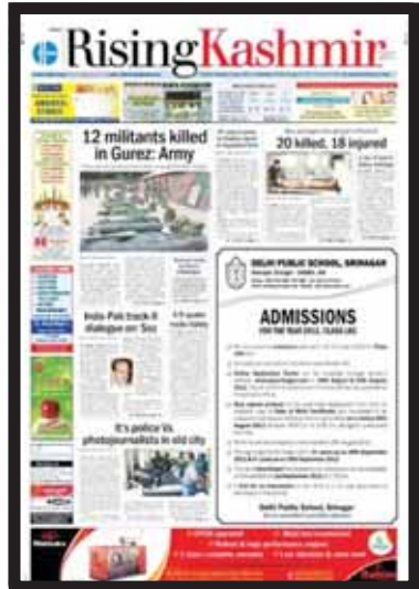
'ਦਿ ਰਾਈਜ਼ਿੰਗ ਕਸ਼ਮੀਰ' ਅਖਬਾਰ ਦਾ ਪਹਿਲਾ ਪੰਨਾ।