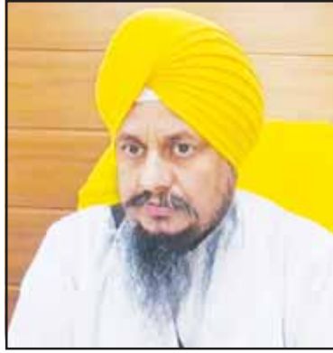
ਅਤੇ ਬਾਕੀ ਵੀਹ ਫੀਸਦ ਤਜਰਬੇਕਾਰ ਸਿੱਖ ਆਗੂ ਸ਼ਾਮਲ ਹੋਣ ਜੋ ਇਨ੍ਹਾਂ ਦਾ ਰਾਹ ਦਸੇਰਾ ਬਣਨ।

ਉਨ੍ਹਾਂ ਕਿਹਾ ਕਿ ਫੈਡਰੇਸ਼ਨ ਵੱਲੋਂ ਪਹਿਲਾਂ ਵੀ ਅਜਿਹੇ ਗੁਰਮਤਿ ਸਿਖਲਾਈ ਕੈਂਪ ਲਾਏ ਜਾਂਦੇ ਸਨ ਪਰ ਸਮੇਂ ਦੀਆਂ ਸਰਕਾਰਾਂ ਨੇ ਇਸ ਜਥੇਬੰਦੀ 'ਤੇ ਰੋਕ ਲਾ ਦਿੱਤੀ ਜਿਸ ਨਾਲ ਜਥੇਬੰਦੀ ਕਈ ਧੜਿਆਂ ਵਿਚ ਵੰਡੀ ਗਈ, ਜਿਸ ਲਈ ਸਿੱਖ ਆਗੂ ਵੀ ਜ਼ਿੰਮੇਵਾਰ ਹਨ। ਉਨ੍ਹਾਂ ਕਿਹਾ ਕਿ ਫੈਡਰੇਸ਼ਨਾਂ ਵਿਚ ਆਈ ਖੜੋਤ ਤੋਂ ਬਾਅਦ ਚੰਗੇ ਸਿੱਖ ਆਗੂਆਂ ਦੀ ਘਾਟ ਪੈਦਾ ਹੋ ਗਈ ਹੈ ਅਤੇ ਅੱਜ ਸ਼੍ਰੋਮਣੀ ਅਕਾਲੀ ਦਲ ਵਿਚ ਅਜਿਹਾ ਸਾਇਦ ਹੀ ਕੋਈ ਆਗੂ ਹੋਵੇਗਾ ਜੋ ਸਿੱਖ ਇਤਿਹਾਸ, ਸਿੱਖ ਧਰਮ ਅਤੇ ਸਿਧਾਂਤਾਂ 'ਤੇ ਗੱਲ ਕਰ ਸਕਦਾ ਹੋਵੇ। ਉਨ੍ਹਾਂ ਕਿਹਾ ਕਿ ਸ਼੍ਰੋਮਣੀ ਅਕਾਲੀ ਦਲ ਸਿੱਖਾਂ ਦੀ ਜਥੇਬੰਦੀ ਹੈ ਅਤੇ ਕਿਸੇ ਇਕ ਦੀ ਸੰਪਤੀ ਨਹੀਂ ਹੈ। ਉਨ੍ਹਾਂ ਕਿਹਾ ਕਿ ਇਸ ਜਥੇਬੰਦੀ ਵਿਚ ਅੱਸੀ ਫੀਸਦ ਵਿਦਿਆਰਥੀ ਭਰਤੀ ਕੀਤੇ ਜਾਣ