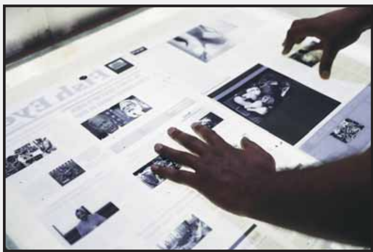
ਸ਼੍ਰੀਨਗਰ ਦੇ ਬਾਹਰੀ ਇਲਾਕੇ ਰੰਗਰੇਟ ਦੀ ਇਕ ਪ੍ਰੈੱਸ ਵਿਚ ਇਕ ਅਖਬਾਰ ਦੀ ਛਪਾਈ ਦੀ ਤਸਵੀਰ। ਇਸ ਇਲਾਕੇ ਦੇ ਅਖਬਾਰ ਵੱਡੇ ਪੈਮਾਨੇ 'ਤੇ ਸਿਰਫ ਲੈਫਟੀਨੈਂਟ ਗਵਰਨਰ ਮਨੋਜ ਸਿਨਹਾ ਦੇ ਪ੍ਰੈੱਸ ਬਿਆਨ ਅਤੇ ਭਾਜਪਾ ਦੇ ਬੁਲਾਰਿਆਂ ਦੇ ਬਿਆਨ ਕਢ ਕਰ ਰਹੇ ਹਨ। ਕਈ ਪੱਤਰਕਾਰਾਂ ਨੇ ਸ਼ਿਕਾਇਤ ਕੀਤੀ ਕਿ ਉਨ੍ਹਾਂ ਨੂੰ ਨੈਸ਼ਨਲ ਕਾਨਫਰੰਸ ਜਾਂ ਪੀ.ਡੀ.ਪੀ. ਦੇ ਬਿਆਨਾਂ ਅਤੇ ਖੇਤਰ 'ਚ ਹੋਈਆਂ ਹਿੰਸਕ ਝੜਪਾਂ ਬਾਰੇ ਰਿਪੋਰਟ ਕਰਨ ਦੀ ਇਜਾਜ਼ਤ ਨਹੀਂ ਹੈ।