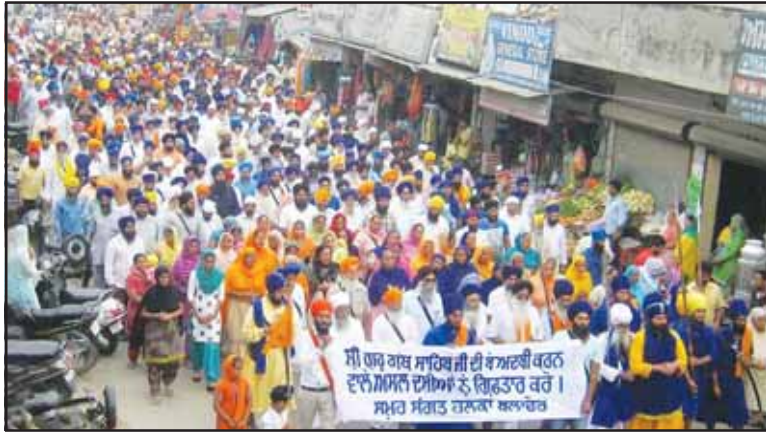
ਨਹੀਂ ਹੋ ਸਕਿਆ। ਪਿਛਲੀ ਤਰੀਕ ਉਤੇ ਅਦਾਲਤ ਨੇ ਜਾਂਚ ਟੀਮ ਨੂੰ ਕੋਟਕਪੂਰਾ ਗੋਲੀ ਕਾਂਡ ਵਿਚ ਸਟੇਟਸ ਰਿਪੋਰਟ ਪੇਸ਼ ਕਰਨ ਲਈ ਕਿਹਾ ਸੀ।

ਦੱਸਣਯੋਗ ਹੈ ਕਿ ਬਹਿਬਲ ਗੋਲੀ ਕਾਂਡ ਦੇ ਮੁਲਜ਼ਮਾਂ ਨੇ ਚਾਰਜਸ਼ੀਟ ਰੱਦ ਕਰਵਾਉਣ ਲਈ ਹਾਈਕੋਰਟ ਵਿਚ ਰਿਟ ਦਾਇਰ ਕੀਤੀ ਸੀ। ਪੰਜਾਬ ਤੇ ਹਰਿਆਣਾ ਹਾਈਕੋਰਟ ਨੇ ਇਸ ਰਿਟ ਦਾ ਨਿਪਟਾਰਾ ਕਰਦਿਆਂ ਮੁਲਜ਼ਮਾਂ ਨੂੰ ਫਰੀਦਕੋਟ ਅਦਾਲਤ ਵਿਚ ਮੁਕੱਦਮੇ ਦਾ ਸਾਹਮਣਾ ਕਰਨ ਲਈ ਕਿਹਾ ਸੀ ਅਤੇ ਇਸ ਦੇ ਨਾਲ ਹੀ ਫਰੀਦਕੋਟ ਦੀ ਅਦਾਲਤ ਨੇ ਆਦੇਸ਼ ਦਿੱਤੇ ਸਨ ਕਿ ਕੋਟਕਪੂਰਾ ਅਤੇ ਬਹਿਬਲ ਗੋਲੀ ਕਾਂਡ ਦੀ ਸੁਣਵਾਈ ਇਕੋ ਦਿਨ ਕੀਤੀ ਜਾਵੇ ਪਰ ਕੋਟਕਪੂਰਾ ਗੋਲੀ ਕਾਂਡ ਵਿਚ ਅਜੇ ਤੱਕ ਚਲਾਨ ਅਦਾਲਤ ਵਿਚ ਪੇਸ਼ ਵੀ