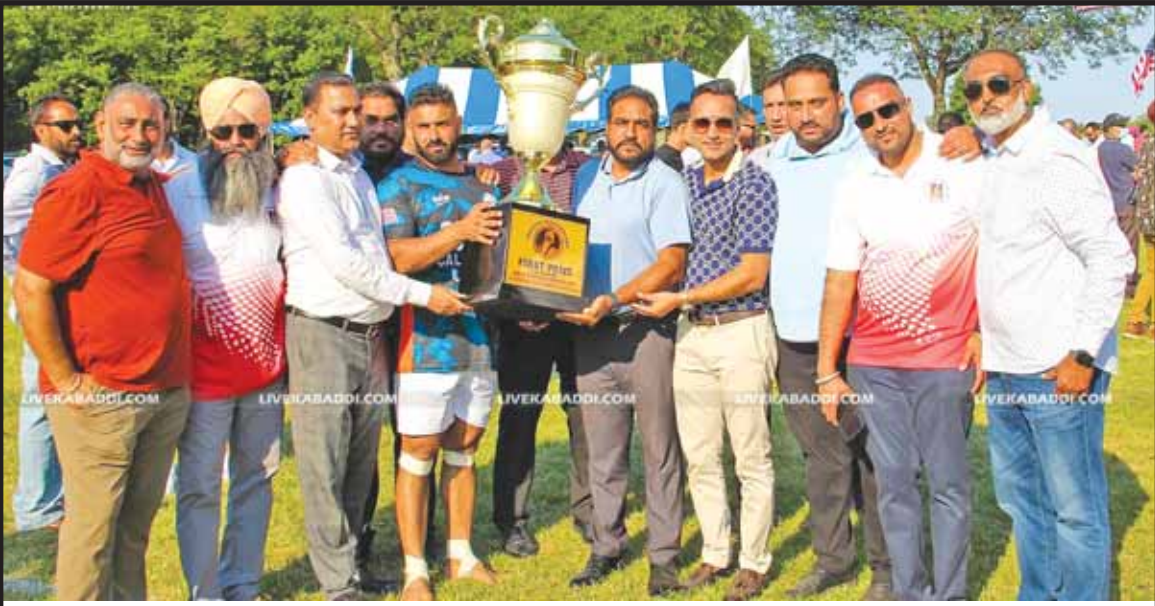
ਸ਼ੇਰੇ ਪੰਜਾਬ ਸਪੋਰਟਸ ਐਂਡ ਕਲਚਰਲ ਕਲੱਬ ਸ਼ਿਕਾਗੋ ਵੱਲੋਂ ਕਰਵਾਏ ਗਏ ਕਬੱਡੀ ਟੂਰਨਾਮੈਂਟ ਦੀ ਜੇਤੂ ਰਹੀ ਨਿਊ ਯਾਰਕ ਮੈਟਰੋ ਟੀਮ ਜੇਤੂ ਕੱਪ ਨਾਲ।