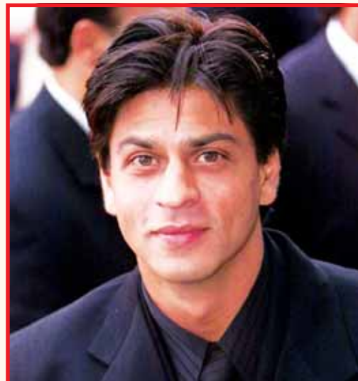
ਅੱਜ ਦਾ ਸ਼ਾਹਰੁਖ ਖਾਨ, (ਉਪਰ ਸੱਜੇ) ਟੈਲੀਵਿਜ਼ਨ ਲੜੀਵਾਰ 'ਫੌਜੀ' ਦੇ ਟ੍ਰਿਸ਼ ਵਿਚ ਅਤੇ ਕਰੀਅਰ ਵਿਚ ਚੜ੍ਹਤ ਵੇਲੇ।

(1994) ਵਰਗੀਆਂ ਫਿਲਮਾਂ ਵਿਚ ਖਲਨਾਇਕ ਦੇ ਰੋਲ ਵੀ ਨਿਭਾਏ ਪਰ 1995 ਵਿਚ ਆਈ ਰੁਮਾਂਟਿਕ ਫਿਲਮ 'ਦਿਲ ਵਾਲੇ ਦੁਲਹਨੀਆ ਲੇ ਜਾਏਗੇ' ਨਾਲ ਤਾਂ ਉਸ ਦੇ ਵਾਰੇ-ਨਿਆਰੇ ਹੋ ਗਏ। ਇਸ ਤੋਂ ਬਾਅਦ ਤਾਂ ਫਿਰ ਚੱਲ ਸੇ ਚੱਲ...। 'ਦਿਲ ਤੋ ਪਾਗਲ ਹੈ' (1997), 'ਕੁਫ ਕੁਫ ਹੋਤਾ ਹੈ' (1998), 'ਮੁਹੱਬਤੋ' (2000), 'ਕਭੀ ਖੁਸ਼ੀ ਕਭੀ ਗਮ' (2001) ਵਰਗੀਆਂ ਫਿਲਮਾਂ ਨਾਲ ਉਸ ਦਾ ਕਰੀਅਰ ਸਿਖਰ 'ਤੇ ਪੁੱਜ ਗਿਆ। 2002 ਵਿਚ ਫਿਲਮ 'ਦੇਵਦਾਸ' ਵਿਚ ਉਸ ਵੱਲੋਂ ਨਿਭਾਈ ਸ਼ਰਾਬੀ ਦੀ ਭੂਮਿਕਾ ਦੀ ਬਹੁਤ ਤਾਰੀਫ ਹੋਈ। ਇਸੇ ਤਰ੍ਹਾਂ 'ਸਵਦੇਸ਼', 'ਚੱਕ ਦੇ! ਇੰਡੀਆ', 'ਮਾਈ ਨੇਮ ਇਜ਼ ਖਾਨ', 'ਚੇਨਈ ਐਕਸਪ੍ਰੈੱਸ', 'ਹੈਪੀ ਨਿਊ ਯੀਅਰ', 'ਦਿਲਵਾਲੇ', 'ਰਈਸ' ਆਦਿ ਫਿਲਮਾਂ ਨਾਲ ਉਸ ਨੇ ਵੱਡੀਆਂ ਪੁਲਾਝਾਂ ਪੁੱਟੀਆਂ। ਸ਼ਾਹਰੁਖ ਖਾਨ ਦਾ ਜਨਮ ਨਵੀਂ ਦਿੱਲੀ ਵਿਚ ਹੋਇਆ। ਜੀਵਨ ਦੇ ਪਹਿਲੇ ਪੰਜ ਸਾਲ ਉਹਨੇ ਮੰਗਲੋਰ ਵਿਚ ਬਿਤਾਏ। ਉਸ ਦੇ ਪਿਤਾ ਮੀਰ ਤਾਜ ਮੁਹੰਮਦ ਖਾਨ ਨੇ ਆਜ਼ਾਦੀ ਦੀ ਲੜਾਈ ਵਿਚ ਹਿੱਸਾ ਲਿਆ ਸੀ। ਉਨ੍ਹਾਂ ਪੇਸ਼ਾਵਰ ਵਿਚ ਚੱਲੀ 'ਖੁਦਾਈ ਖਿਦਮਤਗਾਰ' ਲਹਿਰ ਵਿਚ ਹਿੱਸਾ ਲਿਆ ਸੀ। ਇਹ ਲਹਿਰ ਅਬਦੁਲ ਗੱਫਾਰ ਖਾਨ ਦੀ ਅਗਵਾਈ ਵਿਚ ਆਰੰਭ ਹੋਈ ਸੀ। 1948 ਵਿਚ ਮੀਰ ਤਾਜ ਮੁਹੰਮਦ ਖਾਨ ਨਵੀਂ ਦਿੱਲੀ ਪੁੱਜ ਗਏ। ਸ਼ਾਹਰੁਖ ਖਾਨ ਨੂੰ ਮੁੱਢ ਤੋਂ ਹੀ ਫਿਲਮਾਂ ਦਾ ਸ਼ੌਕ ਸੀ। ਫਿਰ ਹੌਲੀ-ਹੌਲੀ ਉਹ ਟੈਲੀਵਿਜ਼ਨ ਨਾਲ ਜੁੜ ਗਿਆ। ਉਸ ਦਾ ਪਹਿਲਾ ਡਰਾਮਾ 'ਦਿਲ ਦਰਿਆ' ਸੀ ਜੋ 1988 ਵਿਚ ਲੇਖ ਟੰਡਨ ਨੇ ਸ਼ੁਰੂ ਕੀਤਾ ਸੀ ਪਰ ਕੁਝ ਕਾਰਨਾਂ ਕਰਕੇ ਇਹ ਡਰਾਮਾ ਲੇਟ ਹੋ ਗਿਆ ਅਤੇ ਫਿਰ 1989 ਵਿਚ ਆਇਆ ਲੜੀਵਾਰ 'ਫੌਜੀ' ਉਸ ਦਾ ਪਹਿਲਾ ਟੈਲੀਵਿਜ਼ਨ ਲੜੀਵਾਰ ਹੋ ਨਿਬੜਿਆ। -ਜਗਜੀਤ ਸਿੰਘ ਸੇਖੋਂ