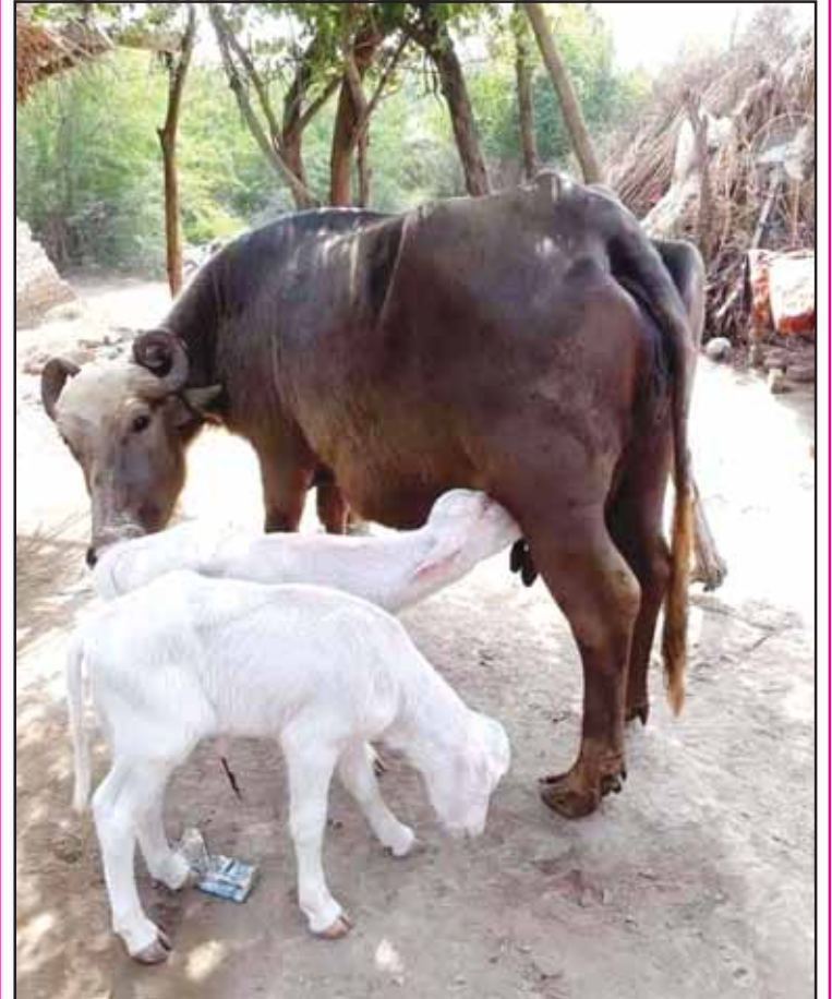
ਕਾਦਰ ਦੀ ਕਲਾ ਦੇਖ ਕੇ ਆਦੇਸ਼ ਆਖੀਏ ਪਿਆਰੇ ਇਕੋ ਨਸਲ ਦੇ ਰੰਗ ਅਨੇਕਾਂ ਸਾਜਣਹਾਰੇ ਦੇ ਬਲਿਹਾਰੇ !