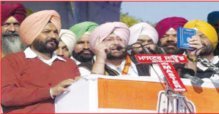
ਗੁਟਕਾ ਹੱਥ ਵਿਚ ਫੜ ਕੇ ਸਹੁੰ ਚੁਕਦੇ ਹੋਏ ਕੈਪਟਨ ਅਮਰਿੰਦਰ ਸਿੰਘ।