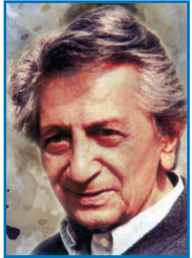
ਬੀਸ਼ਮ ਸਾਹਨੀ ਅਨੁਵਾਦ: ਪ੍ਰੋ. ਨਵ ਸੰਗੀਤ ਸਿੰਘ

ਆਖਰ ਪੰਜ ਵੱਜਦੇ-ਵੱਜਦੇ ਤਿਆਰੀ ਪੂਰੀ ਹੋ ਗਈ। ਕੁਰਸੀਆਂ, ਮੇਜ਼, ਤਿਪਾਈਆਂ, ਨੈਪਕਿਨ, ਫੁੱਲ ਸਭ ਕੁਝ ਬਰਾਂਡੇ ਵਿਚ ਆ ਗਿਆ। ਡਰਿੰਕ ਦਾ ਪ੍ਰਬੰਧ ਬੈਠਕ ਵਿਚ ਕਰ ਦਿਤਾ ਗਿਆ। ਘਰ ਦਾ ਫਾਲਤੂ ਸਮਾਨ ਅਲਮਾਰੀਆਂ ਦੇ