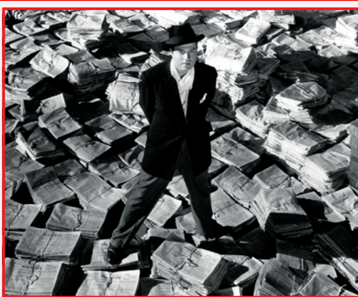
ਫਿਲਮ 'ਸਿਟੀਜ਼ਨ ਕੇਨ' ਦੇ ਇਕ ਚਰਚਿਤ ਦ੍ਰਿਸ਼ ਵਿਚ ਅਦਾਕਾਰ/ਫਿਲਮਸਾਜ਼ ਓਰਸਨ ਵੈਲੇਸ।

ਫਿਲਮ 'ਸਿਟੀਜ਼ਨ ਕੇਨ' ਬਾਰੇ ਚਰਚਾ ਸ਼ੁਰੂ ਕਰਨ ਤੋਂ ਪਹਿਲਾਂ ਤਿੰਨ ਅਹਿਮ ਨੁਕਤਿਆਂ 'ਤੇ ਗੱਲ ਕਰਨੀ ਜ਼ਰੂਰੀ ਹੈ। ਪਹਿਲਾਂ: ਫਿਲਮ ਇਸ ਤੱਥ ਨੂੰ ਪੱਕੇ ਪੈਰੀਂ ਕਰਦੀ ਹੈ ਕਿ ਯਾਦ ਉਪਰ ਬਹੁਤ ਜ਼ਿਆਦਾ