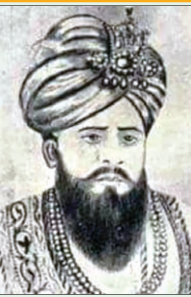
ਨਵਾਬ ਸ਼ੇਰ ਮੁਹੰਮਦ