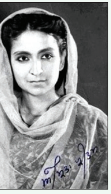
ਅੰਮ੍ਰਿਤਾ ਪ੍ਰੀਤਮ ਜਵਾਨੀ ਵੇਲੇ।

ਚੋਣ ਅਤੇ ਪਸੰਦ ਤਾਂ ਹਰ ਇੱਕ ਦੀ ਆਪੋ-ਆਪਣੀ ਹੀ ਹੁੰਦੀ ਹੈ। ਉੱਝ ਇਸ ਸਿਲਸਲੇ ਵਿਚ ਮੇਰੀ ਨਿੱਜੀ ਰਾਇ ਸਿਰਫ ਏਨੀ ਹੈ ਕਿ ਜੇ ਅੰਮ੍ਰਿਤਾ ਲੇਖਕ ਦੇ ਤੌਰ 'ਤੇ ਹੀ ਚੰਗੇ ਸਨ ਤਾਂ ਉਨ੍ਹਾਂ ਨੂੰ ਸਖੀ, ਸਹੇਲੀ ਜਾਂ ਦੋਸਤ ਬਣਾਉਣ ਜਾਂ ਕਹਿਣ ਵਿਚ ਕੋਈ ਤੁਕ ਜਾਂ ਸੁਹਿਰਦਤਾ ਨਜ਼ਰ ਨਹੀਂ ਆਉਂਦੀ। ਕੇਵਲ ਉਨ੍ਹਾਂ ਦੀਆਂ ਲਿਖਤਾਂ ਨੂੰ ਪੜ੍ਹਨ ਸਲਾਹੁਣ ਤੀਕ ਸੀਮਿਤ ਰਿਹਾ ਜਾ ਸਕਦਾ ਸੀ।