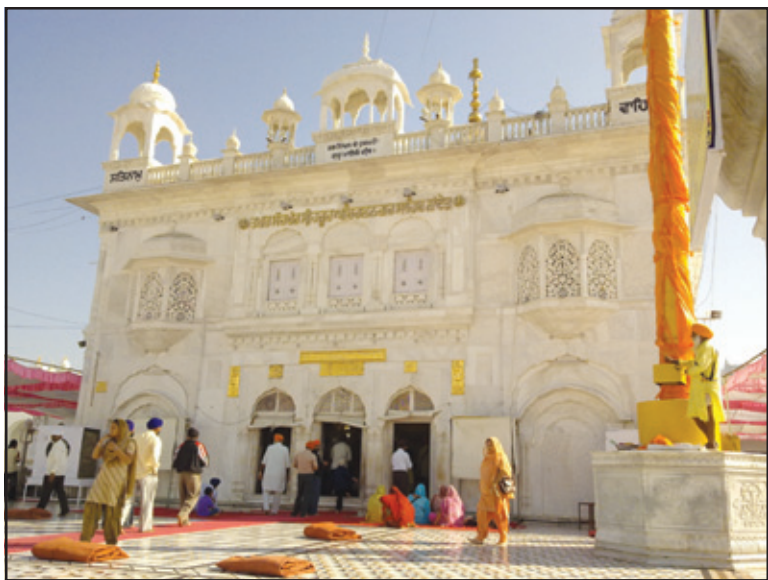
ਮੰਗਵਾਈਆਂ ਗਈਆਂ ਹਨ। ਹਸਪਤਾਲ ਆਈ.ਸੀ.ਯੂ, ਵੈਟੀਲੇਟਰ ਅਤੇ ਆਕਸੀਜਨ

ਅੰਮ੍ਰਿਤਸਰ: ਤਖਤ ਸ੍ਰੀ ਹਜ਼ੂਰ ਸਾਹਿਬ ਪ੍ਰਬੰਧਕੀ ਬੋਰਡ ਨਾਦੇਤ ਵੱਲੋਂ ਮਨੁੱਖਤਾ ਦੀ ਸੇਵਾ ਲਈ ਜਲਦੀ ਹੀ ਇਕ ਵੱਡਾ ਮਲਟੀ ਸਪੈਸ਼ਲਿਟੀ ਹਸਪਤਾਲ ਸਥਾਪਤ ਕਰਨ ਦੀ ਯੋਜਨਾ ਹੈ। ਤਖਤ ਸ੍ਰੀ ਹਜ਼ੂਰ ਸਾਹਿਬ 'ਤੇ ਸੰਗਤ ਵੱਲੋਂ ਦਾਨ ਵਜੋਂ ਭੇਟ ਕੀਤਾ ਗਿਆ ਸੋਨਾ ਵੀ ਇਸ ਨੇਕ ਕੰਮ 'ਚ ਵਰਤਿਆ ਜਾਵੇਗਾ। ਕਰੋਨਾ ਮਹਾਮਾਰੀ ਦੌਰਾਨ ਸਿੱਖ ਸੰਸਥਾਵਾਂ ਵੱਲੋਂ ਇਸ ਬਿਮਾਰੀ ਤੋਂ ਮਨੁੱਖਤਾ ਨੂੰ ਬਚਾਉਣ ਲਈ ਇਸ ਦਿਸ਼ਾ ਵਿਚ ਕਈ ਅਹਿਮ ਕੰਮ ਕੀਤੇ ਜਾ ਰਹੇ ਹਨ।