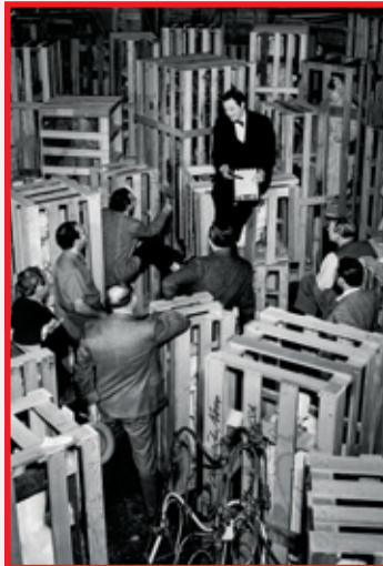
ਫਿਲਮ 'ਸਿਟੀਜ਼ਨ ਕੇਨ' ਦਾ ਪੋਸਟਰ ਅਤੇ (ਸੱਜੇ) ਫਿਲਮ ਦਾ ਇਕ ਦ੍ਰਿਸ਼ ਸਮਝਾ ਰਿਹਾ ਓਰਸਨ ਵੈਲੇਸ।

ਭਰੋਸਾ ਨਹੀਂ ਕੀਤਾ ਜਾ ਸਕਦਾ। ਫਿਲਮ ਦੇ ਮੁੱਖ ਕਿਰਦਾਰ ਚਾਰਲਸ ਫੋਸਟਰ ਕੇਨ ਦੀ ਕਹਾਣੀ ਉਸ ਦੀ ਮੌਤ ਤੋਂ ਬਾਅਦ, ਉਸ ਦੇ ਸੰਪਰਕ ਵਿਚ ਆਉਣ ਵਾਲਿਆਂ ਦੇ ਨਜ਼ਰੀਏ ਤੋਂ ਨਿੱਕੇ-ਨਿੱਕੇ ਟੁਕੜਿਆਂ ਰਾਹੀਂ ਘੜੀ ਜਾਂਦੀ ਹੈ। ਉਸ ਦਾ ਸਭ ਤੋਂ ਕਰੀਬੀ ਮੁਲਾਜ਼ਮ ਉਸ ਪ੍ਰਤੀ ਸ਼ਰਧਾ ਨਾਲ ਭਰਿਆ ਹੋਣ ਕਾਰਨ ਉਸ ਦੀ ਕਹਾਣੀ ਵਿਚ ਸਾਰਾ ਕੁਝ ਚਮਤਕਾਰੀ ਤੇ ਅਸਾਧਾਰਨ ਹੀ ਦੇਖਦਾ ਹੈ। ਉਸ ਨੂੰ ਇਹ ਦਿਸਦਾ ਹੀ ਨਹੀਂ ਕਿ ਆਪਣੇ ਕੈਰੀਅਰ ਦੇ ਸ਼ੁਰੂਆਤੀ ਦਿਨਾਂ ਵਿਚ ਬੇਹੱਦ ਆਦਰਸ਼ਕ ਤੇ ਸਚਾਈ ਨਾਲ ਭਰਿਆ ਉਸ ਦਾ ਬਾਸ ਕੇਨ ਕਿਵੇਂ