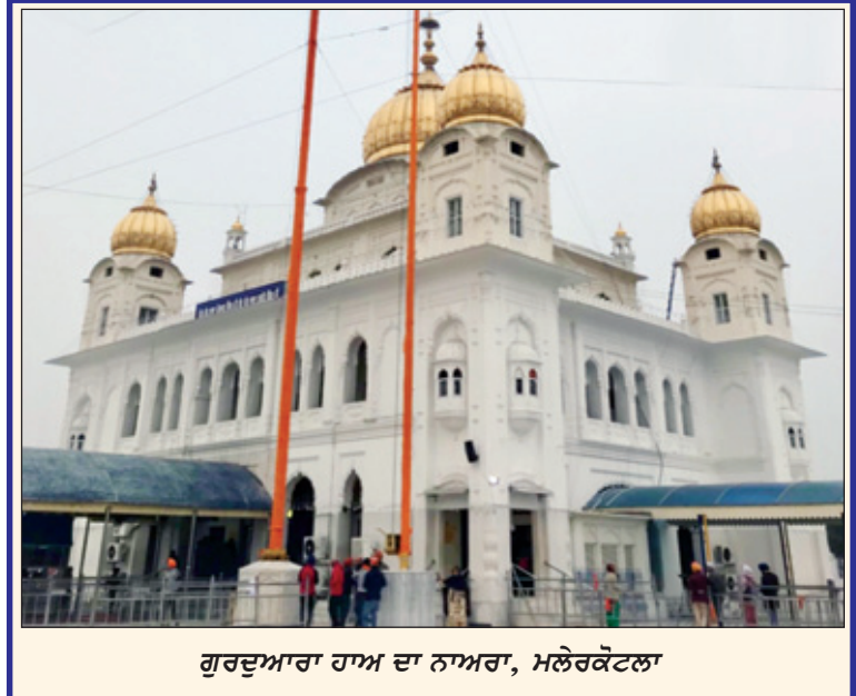
ਗੁਰਦੁਆਰਾ ਹਾਅ ਦਾ ਨਾਅਰਾ, ਮਲੇਰਕੋਟਲਾ

'ਜਰਗ ਦੇ ਮੇਲੇ' ਵਾਂਗ ਪੰਜਾਬੀ ਜੱਟਾਂ ਸਿੱਖਾਂ ਤੇ ਮੁਸਲਮਾਨਾਂ ਦਾ ਲੋਕ ਮੇਲਾ ਅੰਤਾਂ ਦੀ ਸ਼ਰਧਾ, ਸੇਵਾ ਤੇ ਨਿਮਰਤਾ ਨਾਲ ਭਰਦਾ ਹੈ। ਰਿਆਸਤ ਤੇ ਹੁਣ ਜਿਲਾ ਮਲੇਰਕੋਟਲਾ ਵਿਚ 68% ਮੁਸਲਿਮ, 21% ਹਿੰਦੂ, 10% ਸਿੱਖ ਤੇ 2%