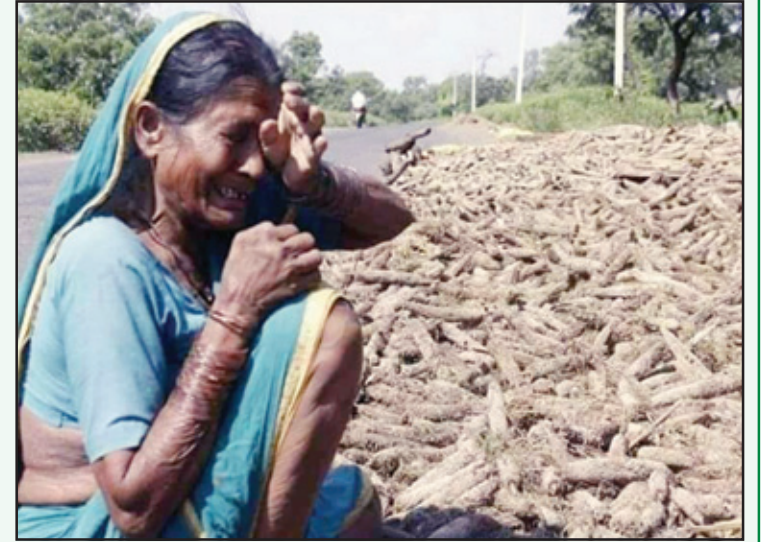
ਕੋਸੇ ਹੰਝੂ ਦਿਲ-ਦਿਲਾਸਾ ਢਾਹ ਗਏ ਨੇ। ਪਹਾੜ ਦੁੱਖਾਂ ਦੇ ਲਗਾਰ-ਜ਼ਿੰਦਗੀ ਖਾ ਗਏ ਨੇ। ਕੋਈ ਤਾਂ ਆ ਕੇ ਸੁਣੇ ਦਿਲਾਂ ਦੀਆਂ ਹੁਕਾਂ ਨੂੰ, ਕਾਲੇ ਵੇਲੇ ਆਣ ਹਨੇਰਾ ਪਾ ਗਏ ਨੇ।