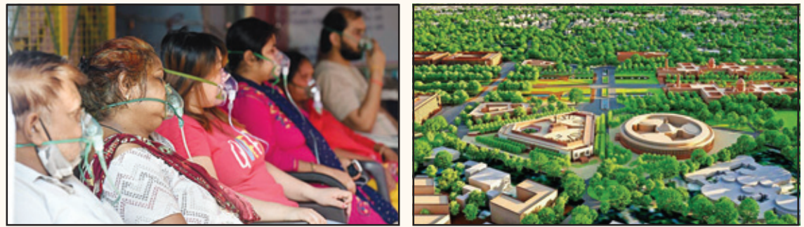
ਦਿੱਲੀ ਵਿਚ ਆਕਸੀਜਨ ਸੰਕਟ ਦੀ ਮੂੰਹ ਬੋਲਦੀ ਤਸਵੀਰ ਅਤੇ (ਸੱਜੇ) ਸੈਂਟਰਲ ਵਿਸਟਾ ਪ੍ਰੋਜੈਕਟ ਜਿਸ ਨੂੰ ਮੁਕੰਮਲ ਕਰਨ ਦੇ ਹੁਕਮ ਦਿੱਤੇ ਗਏ ਹਨ।

ਦੇ ਉਹ ਭਾਗੀ ਸਨ। (ਇਕ ਵਾਰ ਫਿਰ, ਸਾਡੀ ਸੁਪਰੀਮ ਕੋਰਟ ਕੋਲ ਇਸ ਮਾਮਲੇ ਦੀ ਪਟੀਸ਼ਨ ਪਹੁੰਚੀ ਸੀ, ਇਸ ਨੇ ਸਰਕਾਰ ਦੇ ਨਜ਼ਰੀਏ ਨਾਲ ਰਜ਼ਾਮੰਦੀ ਜ਼ਾਹਿਰ ਕੀਤੀ।) ਸੋ, ਜਿਵੇਂ ਤੁਸੀਂ ਦੇਖ ਸਕਦੇ ਹੋ, ਸਰਕਾਰ ਬੇਹੱਦ, ਬੇਹੱਦ ਮਸਰੂਫ ਸੀ। ਇਸ ਫੌਰੀ ਸਰਗਰਮੀ 'ਚ ਸਭ ਤੋਂ ਉਪਰ ਇਕ ਚੋਣ ਹੈ ਜਿਸ ਨੂੰ ਪੱਛਮੀ ਬੰਗਾਲ ਵਿਚ ਜਿੱਤਣਾ ਹੈ। ਇਸ ਵਿਚ ਸਾਡੇ ਗ੍ਰਹਿ ਮੰਤਰੀ, ਪ੍ਰਧਾਨ ਮੰਤਰੀ, ਮੌਦੀ ਦੇ ਅਜ਼ੀਜ਼ ਅਮਿੱਤ ਸ਼ਾਹ ਦੇ ਲਈ