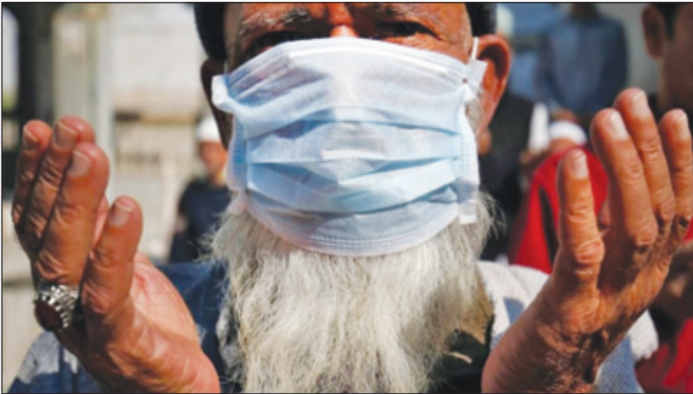
ਇਹ ਸਵਾਲ ਪੁੱਛ ਰਹੇ ਹਨ ਕਿ ਜੇਕਰ ਵਿਦਿਆਰਥੀ ਅਤੇ ਸੇਵਾਮੁਕਤ ਡਾਕਟਰ ਕੋਵਿਡ-19 ਦੇ ਮਰੀਜ਼ਾਂ ਦਾ ਇਲਾਜ ਕਰ ਸਕਦੇ ਹਨ ਤਾਂ ਦੂਸਰੇ ਰੋਗਾਂ ਦੇ ਸਪੈਸ਼ਲਿਸਟ ਡਾਕਟਰ ਇਨ੍ਹਾਂ ਮਰੀਜ਼ਾਂ ਦਾ ਇਲਾਜ ਕਿਉਂ ਨਹੀਂ ਕਰ ਸਕਦੇ? ਇਹ ਸਵਾਲ (ਬਾਕੀ ਸਫਾ 6 ਉੱਤੇ)

ਦੌਰਾਨ ਦਵਾਈਆਂ ਤੇ ਆਕਸੀਜਨ ਦੀ ਵਧ ਰਹੀ ਕਾਲਾਬਾਜ਼ਾਰੀ ਦਾ ਹੈ। ਦੇਸ਼ ਦੇ ਵੱਖ-ਵੱਖ ਥਾਵਾਂ ਤੋਂ ਕੋਵਿਡ-19 ਦੇ ਇਲਾਜ ਲਈ ਨਕਲੀ ਦਵਾਈਆਂ ਬਣਾਉਣ, ਆਕਸੀਜਨ ਬਲੈਕ (ਮਹਿੰਗੇ ਭਾਅ) ਵਿਚ ਵੇਚਣ, ਆਕਸੀਜਨ ਕੰਸੈਂਟਰੇਟਰਾਂ ਦੀ ਜ਼ਖੀਰੇਬਾਜ਼ੀ ਅਤੇ ਐਂਬੂਲੈਂਸਾਂ ਦੀ ਵਰਤੋਂ ਲਈ ਬਹੁਤ ਜ਼ਿਆਦਾ ਪੈਸੇ ਵਸੂਲਣ ਦੀਆਂ ਖਬਰਾਂ ਆ ਰਹੀਆਂ ਹਨ। ਸਵਾਲ ਇਹ ਵੀ ਹੈ ਕਿ ਇਕ ਪਾਸੇ ਸਰਕਾਰਾਂ ਕੋਵਿਡ-19 ਦੇ ਮਰੀਜ਼ਾਂ ਦੇ ਇਲਾਜ ਲਈ ਐਮ.ਬੀ.ਬੀ.ਐਸ. ਦੇ ਆਖਰੀ ਸਾਲ ਦੇ ਵਿਦਿਆਰਥੀਆਂ ਅਤੇ ਸੇਵਾਮੁਕਤ ਡਾਕਟਰਾਂ ਦੀਆਂ ਸੇਵਾਵਾਂ ਲੈ ਰਹੀਆਂ ਹਨ, ਉਥੇ ਹਸਪਤਾਲਾਂ ਦੇ ਦੂਸਰੇ ਵਾਰਡ ਲਗਭਗ ਬੰਦ ਪਏ ਹਨ। ਲੋਕ