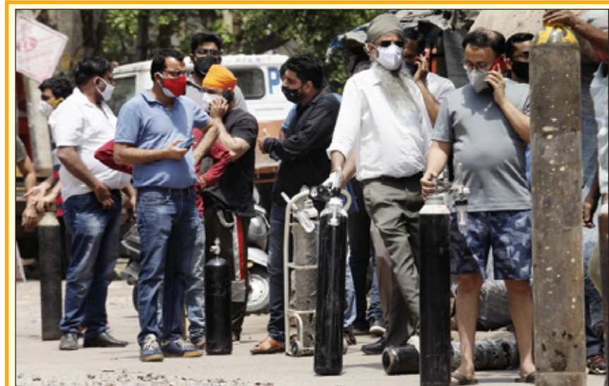
ਸਿਲੰਡਰਾਂ 'ਚ ਆਕਸੀਜਨ ਭਰਵਾਉਣ ਲਈ ਕਤਾਰ 'ਚ ਲੱਗੇ ਲੋਕ

30 ਅਪਰੈਲ ਨੂੰ ਐਸੋਸੀਏਟਡ ਪ੍ਰੈੱਸ ਵੱਲੋਂ ਨਸ਼ਰ ਕੀਤੀ ਇੱਕ ਖਬਰ ਅਨੁਸਾਰ ਭਾਰਤੀ ਵਿਗਿਆਨੀਆਂ ਨੇ ਪ੍ਰਧਾਨ ਮੰਤਰੀ ਨਰਿੰਦਰ ਮੋਦੀ ਨੂੰ ਬੇਨਤੀ ਕੀਤੀ ਸੀ ਕਿ ਵਾਇਰਸ ਦਾ ਡਾਟਾ ਜਨਤਕ ਤੌਰ 'ਤੇ ਨਸ਼ਰ ਕੀਤਾ ਜਾਵੇ, ਜਿਸ ਨਾਲ ਉਨ੍ਹਾਂ ਨੂੰ ਸਿਖਰ ਵੱਲ ਜਾ ਰਹੇ ਕੋਵਿਡ ਵਾਇਰਸ ਤੋਂ ਲੋਕਾਂ ਦੀਆਂ ਜਾਨਾਂ ਬਚਾਉਣ ਦੀ ਆਗਿਆ ਮਿਲ ਸਕੇ। ਅਪਰੈਲ ਵਿਚ ਹੀ ਕੇਸ ਏਨੇ ਜ਼ਿਆਦਾ ਵਧ ਗਏ ਸਨ ਕਿ ਫੌਜ ਨੂੰ ਆਪਣੇ ਹਸਪਤਾਲ ਲੋਕਾਂ ਦੀ ਸੇਵਾ ਲਈ ਖੋਲ੍ਹਣੇ ਪਏ। ਤਾਜ਼ਾ ਖਬਰਾਂ ਅਨੁਸਾਰ ਭਾਰਤੀ ਮੈਡੀਕਲ ਐਸੋਸੀਏਸ਼ਨ ਨੇ ਕੇਂਦਰੀ ਸਿਹਤ ਮੰਤਰਾਲੇ ਨੂੰ ਚਿੱਠੀ ਲਿਖ ਕੇ ਬੇਨਤੀ