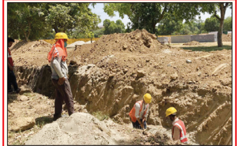
ਸੈਂਟਰਲ ਵਿਸਟਾ ਪ੍ਰੋਜੈਕਟ ਤਹਿਤ ਇੰਡੀਆ ਗੇਟ ਨੇੜੇ ਕੰਮ ਕਰ ਰਹੇ ਕਾਮੇ।