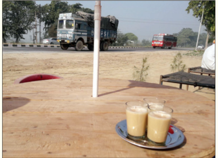
ਸੜਕ ਕਿਨਾਰੇ ਢਾਬਾ ਮਿੱਤਰਾਂ ਦਾ, ਆਵਾਜ਼ਾਂ ਮਾਰਨ ਚਾਹ ਦੇ ਗਲਾਸ ਤਿੰਨ। ਚਾਹ ਲਾਚੀਆਂ ਵਾਲੀ ਪੀ ਲਵੇ ਜਿਹੜਾ ਵੀ, ਮੁੜ ਕੇ ਨਾ ਲੰਘੂ ਪੀਤਿਆਂ ਬਿਨ।