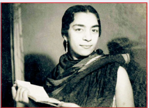
ਜਵਾਨੀ ਵੇਲੇ ਜ਼ੋਹਰਾ ਸਹਿਗਲ

ਦੀ ਮੁਲਾਕਾਤ ਉਦੈ ਸ਼ੰਕਰ ਨਾਲ ਹੋਈ ਜੋ ਮਸ਼ਹੂਰ ਸਿਤਾਰਵਾਦਕ ਰਵੀ ਸ਼ੰਕਰ ਦੇ ਵੱਡੇ ਭਰਾ ਸਨ। ਉਹ ਪੈਰਿਸ ਦੇ ਕੈਬਰੇ ਹਾਲ ਵਿਚ ਭਾਰਤੀ ਨਿੱਤ ਕਰਦੇ ਸਨ। ਉਹ ਵੀਹਵੀਂ ਸਦੀ ਦੇ ਤੀਜੇ ਦਹਾਕੇ 'ਚ ਲੰਡਨ ਵਿਚ ਵੀ ਰਹੀ। ਇਸ ਨੇ ਯੂਰਪ ਵਿਚ ਰਹਿੰਦੇ ਹੋਏ ਉਦੈ ਸ਼ੰਕਰ ਦੀ ਨਿੱਤ ਮੰਡਲੀ ਦੀਆਂ ਪੇਸ਼ਕਾਰੀਆਂ ਦੇਖੀਆਂ ਤੇ ਉਨ੍ਹਾਂ ਨਾਲ ਕੰਮ ਕਰਨ ਦਾ ਮਨ ਬਣਾ ਕੇ ਉਨ੍ਹਾਂ ਤੋਂ ਕੰਮ ਲੈਣ ਦਾ ਵਾਅਦਾ ਵੀ ਲੈ ਲਿਆ। ਲੰਡਨ ਵਿਚ ਹੀ ਰਹਿੰਦੇ ਜਪਾਨ ਪਹੁੰਚਣ ਦਾ ਟੈਲੀਗ੍ਰਾਮ ਉਦੈ ਸ਼ੰਕਰ ਪਾਸੋਂ ਪ੍ਰਾਪਤ ਹੋਇਆ। ਫਿਰ ਭਾਰਤ ਆ ਕੇ ਅਲਮੋੜਾ ਪਹੁੰਚੀ ਅਤੇ 1935 'ਚ ਉਦੈ ਸ਼ੰਕਰ ਦੀ ਨਿੱਤ ਮੰਡਲੀ ਦਾ ਹਿੱਸਾ ਬਣੀ।