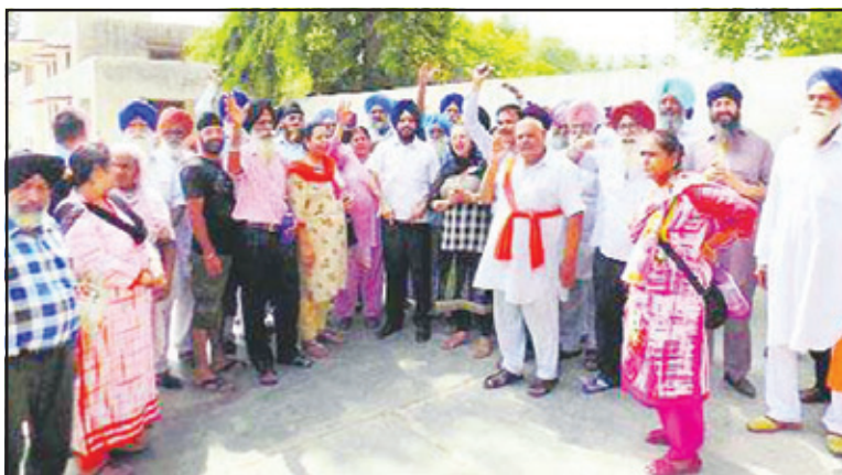
ਭਾਰਤ ਤੋਂ ਪਾਕਿਸਤਾਨ ਜਾਣ ਵੇਲੇ ਸਮੂਹ ਸ਼ਰਧਾਲੂਆਂ ਦੀ ਕਰੋਨਾ ਟੈਸਟ ਰਿਪੋਰਟ ਨੈਗੇਟਿਵ

ਸਿਹਤ ਵਿਭਾਗ ਵੱਲੋਂ ਦਿੱਤੀ ਜਾਣਕਾਰੀ ਅਨੁਸਾਰ ਪਾਕਿਸਤਾਨ ਤੋਂ ਪਰਤੇ ਸ਼ਰਧਾਲੂਆਂ 'ਚੋਂ ਕਰੋਨਾ ਪਾਜੀਟਿਵ ਕੇਸਾਂ ਦੀ ਗਿਣਤੀ 200 ਨੂੰ ਟੱਪ ਗਈ ਹੈ। ਜਿਕਰਯੋਗ ਹੈ ਕਿ ਸਿੱਖ ਜਥੇ ਦੇ