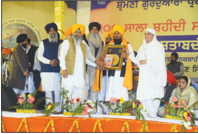
ਅਸਥਾਨ ਗੁਰਦੁਆਰਾ ਗੁਰੂ ਕੇ ਮਹਿਲ ਵਿਖੇ ਇਸ ਸਬੰਧੀ ਸਮਾਗਮ ਨਿਰੰਤਰ ਜਾਰੀ ਹਨ। ਇਸੇ ਦੌਰਾਨ ਉਨ੍ਹਾਂ ਮੁਕੇਰੀਆਂ ਦੇ ਪਿੰਡ

ਇਹ ਫੈਸਲਾ ਸਰਕਾਰੀ ਅਧਿਕਾਰੀਆਂ ਨਾਲ ਗੱਲਬਾਤ ਮਗਰੋਂ ਲਿਆ ਗਿਆ ਹੈ। ਉਨ੍ਹਾਂ ਦੱਸਿਆ ਕਿ ਸ਼ਤਾਬਦੀ ਸਮਾਗਮਾਂ ਪ੍ਰਤੀ ਸੰਗਤ ਵਿਚ ਭਾਰੀ ਉਤਸ਼ਾਹ ਸੀ ਪਰ ਕਰੋਨਾ ਕਾਰਨ ਸੰਗਤ ਦਾ ਵੱਡਾ ਇਕੱਠ ਨਹੀਂ ਕੀਤਾ ਜਾਵੇਗਾ। ਉਨ੍ਹਾਂ ਦੱਸਿਆ ਕਿ ਗੁਰੂ ਸਾਹਿਬ ਦੇ ਪ੍ਰਕਾਸ਼