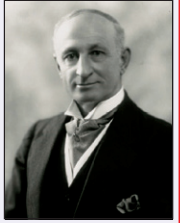
ਸਰ ਮੈਲਕਮ ਹੇਲੀ

ਡੇਰਾ ਗਾਜ਼ੀ ਖਾਨ ਜੇਹਲ ਵਿਚ ਬੰਦ ਸਨ। ਨਰਮ ਧੜੇ ਦੇ ਆਗੂ ਕਹਿੰਦੇ ਸਨ, ਇਹ ਕੋਈ ਸ਼ਰਤਾਂ ਨਹੀਂ। ਗੁਰਦੁਆਰਾ ਬਿਲ ਅਸਾਂ ਆਪ ਆਪਣੇ ਅਮਲ ਕਰਨ ਲਈ ਬਣਾਇਆ ਹੈ। ਜੇ ਅਮਲ ਨਹੀਂ ਕਰਨਾ ਤਾਂ ਬਣਾਇਆ ਹੀ ਕਿਉਂ ਹੈ? ਇਸ ਕਰ ਕੇ ਸਾਨੂੰ ਗੁਰਦੁਆਰਾ ਬਿਲ ਉਤੇ ਅਮਲ ਕਰਨ ਦਾ ਐਲਾਨ ਕਰ ਕੇ ਰਿਹਾਈ ਪ੍ਰਾਪਤ