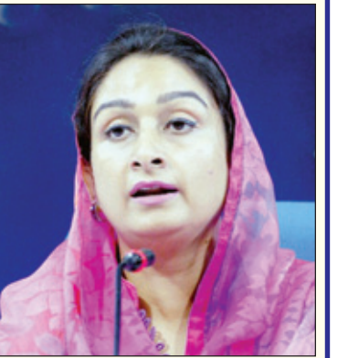
ਹਰਸਿਮਰਤ ਕੌਰ ਬਾਦਲ

ਬਿਹਾਰ ਤੋਂ ਆਰ. ਜੇ. ਡੀ. ਰਾਜ ਸਭਾ ਸੰਸਦ ਮੈਂਬਰ ਪ੍ਰੋ. ਮਨੋਜ ਝਾਅ ਨੇ ਕਿਸਾਨਾਂ ਦੇ ਹੱਕ ਵਿਚ ਆਵਾਜ਼ ਬੁਲੰਦ ਕਰਦਿਆਂ ਕਿਹਾ ਕਿ ਉਹ ਆਲੋਚਕ ਨਹੀਂ, ਸਮਾਲੋਚਕ ਹਨ। 1984 ਦੇ ਕਤਲੇਆਮ ਦਾ ਜ਼ਿਕਰ ਕਰਦਿਆਂ ਉਨ੍ਹਾਂ ਕਿਹਾ ਕਿ ਇਤਿਹਾਸ ਤੋਂ ਕੁਝ ਤਾਂ ਸਿੱਖੋ! ਇਤਿਹਾਸ