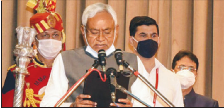
ਬਿਹਾਰ ਦੇ ਮੁੱਖ ਮੰਤਰੀ ਰਹੇ ਸਨ।