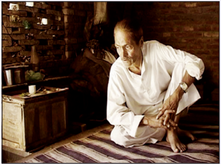
ਲਾਲ ਸਿੰਘ ਦਿਲ ਦੀਆਂ ਦੋ ਤਸਵੀਰਾਂ।

ਪੁਸਤਕਾਂ ‘ਸਤਲੁਜ ਦੀ ਹਵਾ’ (1971), ‘ਬਹੁਤ ਸਾਰੇ ਸੂਰਜ’ (1982), ‘ਸੱਥਰ’ (1997) ਅਤੇ ਸਵੈ-ਜੀਵਨੀ ‘ਦਾਸਤਾਨ’ (1998) ਛਪ ਚੁੱਕੀਆਂ ਸਨ। ਉਸ ਦੀ ਲੰਮੀ ਬਿਰਤਾਂਤਕ ਕਵਿਤਾ ‘ਅੱਜ ਬਿੱਲਾ ਫੇਰ ਆਇਆ’ ਉਸ ਦੇ ਦੇਹਾਂਤ ਤੋਂ ਦੋ ਵਰ੍ਹੇ ਮਗਰੋਂ 2009 ਵਿਚ ਛਪੀ।