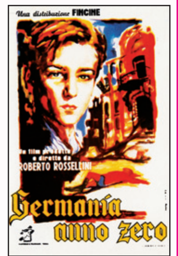
ਫਿਲਮ 'ਜਰਮਨੀ, ਯੀਅਰ ਜ਼ੀਰੋ' ਦਾ ਇੱਕ ਦ੍ਰਿਸ਼ ਅਤੇ (ਸੱਜੇ) ਪੋਸਟਰ।