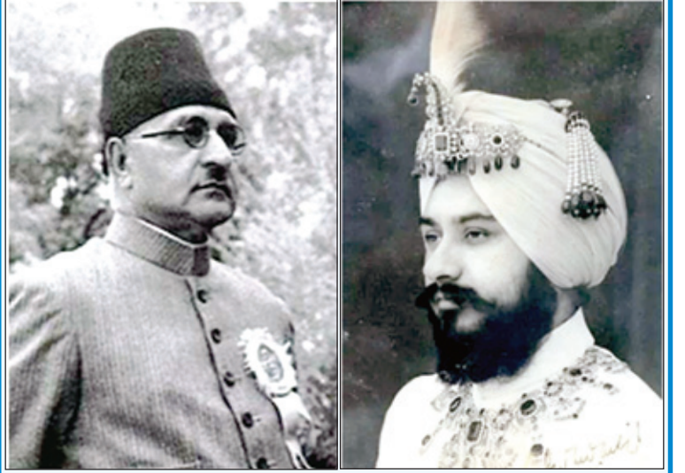
ਨਵਾਬ ਮਮਦੋਟ ਤੇ ਫਰੀਦਕੋਟੀ ਰਾਜਾ ਹਰਿੰਦਰ ਸਿੰਘ