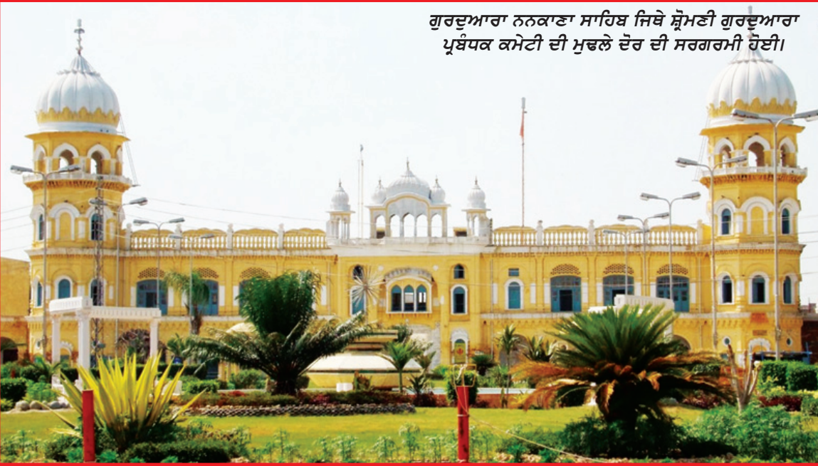
ਗੁਰਦੁਆਰਾ ਨਨਕਾਣਾ ਸਾਹਿਬ ਜਿਥੇ ਸ਼੍ਰੋਮਣੀ ਗੁਰਦੁਆਰਾ ਪ੍ਰਬੰਧਕ ਕਮੇਟੀ ਦੀ ਮੁਢਲੇ ਦੌਰ ਦੀ ਸਰਗਰਮੀ ਹੋਈ।