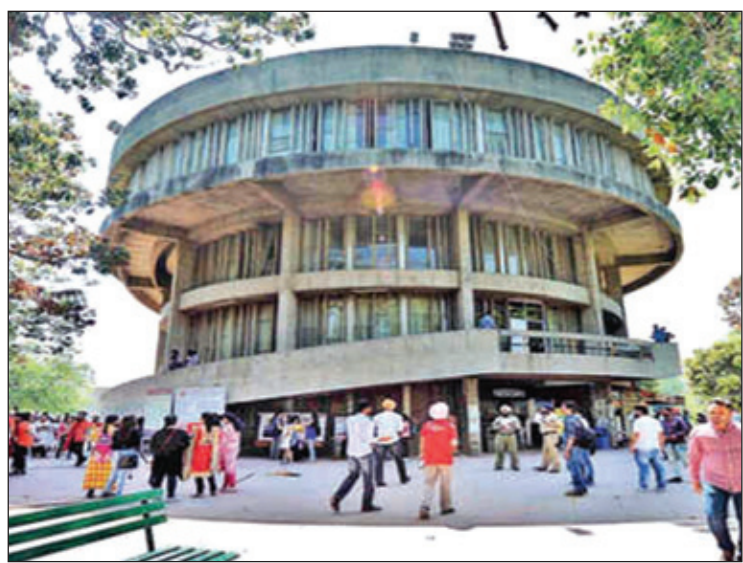
ਪੰਜਾਬ ਯੂਨੀਵਰਸਿਟੀ ਦਾ ਸਟੂਡੈਂਟ ਸੈਂਟਰ

ਪਖਤੂਨਖਵਾ) ਸ਼ਾਮਲ ਸਨ। ਜਿਥੋਂ ਮੋਹਿੰਦਰਾ ਕਾਲਜ ਪਟਿਆਲਾ, ਖਾਲਸਾ ਕਾਲਜ ਅੰਮ੍ਰਿਤਸਰ, ਯੂਨੀਵਰਸਿਟੀ ਕਾਲਜ ਲਾਹੌਰ ਤੇ ਸੇਂਟ ਸਟੀਫਨ