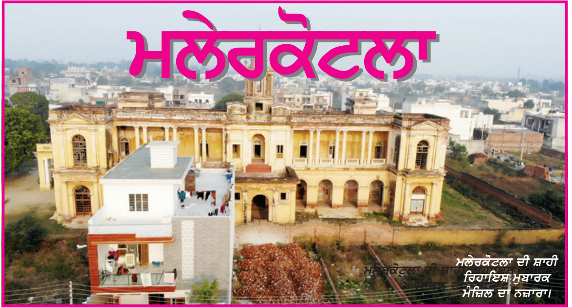
ਮਲੇਰਕੋਟਲਾ ਦੀ ਸ਼ਾਹੀ ਰਿਹਾਇਸ਼ ਮੁਬਾਰਕ ਮੰਜ਼ਿਲ ਦਾ ਨਜ਼ਾਰਾ।