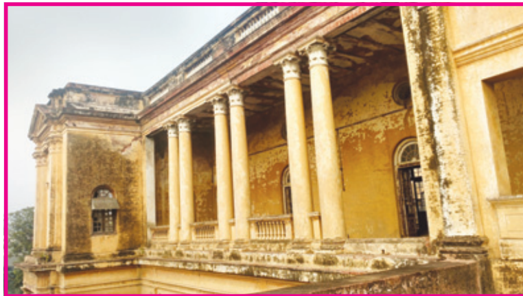
ਨੇੜਿਓਂ ਦਿਸਦੀ ਮੁਬਾਰਕ ਮੰਜ਼ਲ।