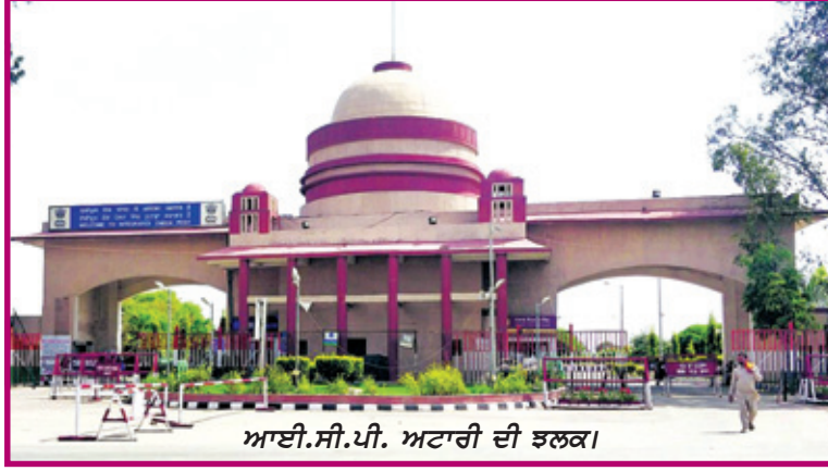
ਆਈ.ਸੀ.ਪੀ. ਅਟਾਰੀ ਦੀ ਝਲਕ।

ਸਾਡੇ ਅਨੁਮਾਨਾਂ ਤੋਂ ਖੁਲਾਸਾ ਹੋਇਆ ਹੈ ਕਿ ਉਪਰ ਬਿਆਨੇ ਇਨ੍ਹਾਂ ਸਾਰੇ ਸੇਵਾਕਾਰਾਂ ਨੂੰ ਪਿਛਲੇ 18 ਮਹੀਨਿਆਂ ਦੌਰਾਨ ਇਕੱਲੇ