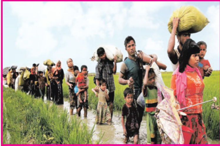
ਉਜੜੇ ਰੋਹਿੰਗਿਆ ਦਾ ਕਾਫਲਾ।