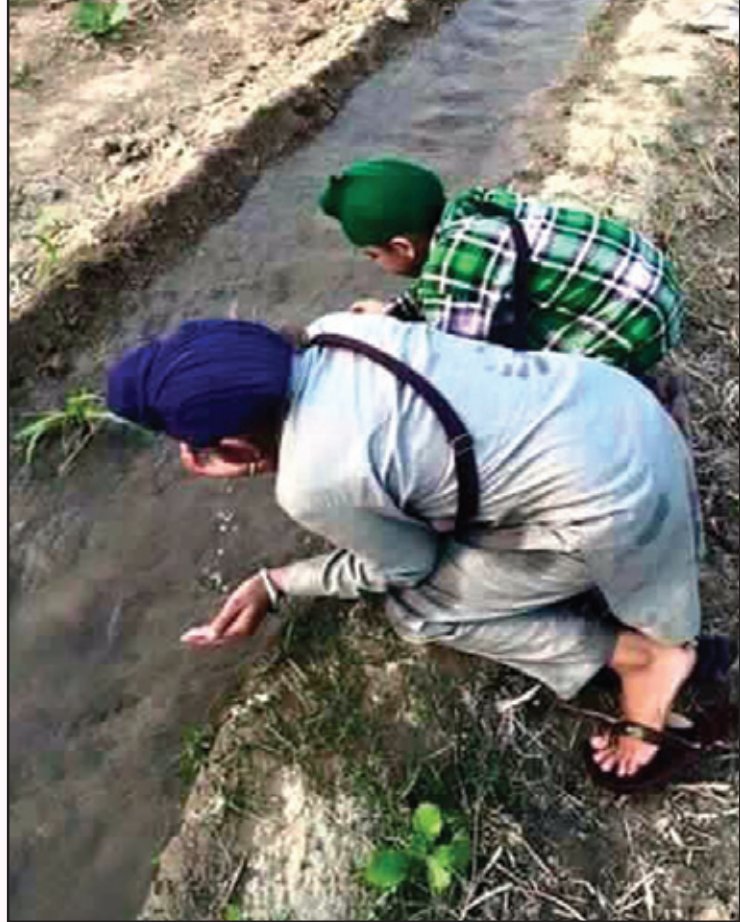
ਯੁੱਕ ਭਰ ਭਰ ਕੇ ਪੀ ਲਈਦਾ ਸੀ, ਆੜ 'ਚ ਵਗਦਾ ਪਾਣੀ। ਅੱਜ ਕੱਲ ਦੇ ਬੱਚਿਆਂ ਨੂੰ ਲੱਗੂ, ਇਹ ਕੋਈ ਗੱਪ-ਕਹਾਣੀ।